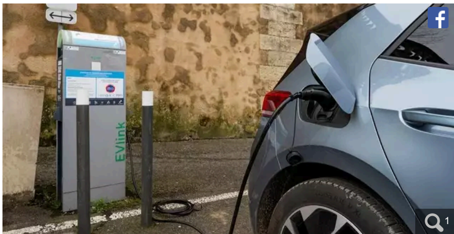
« Le réseau de bornes de recharge et les conditions de recharge sont déplorables. ».

Votre e-mail, avec votre consentement, est utilisé par la société Additi Multimedia pour recevoir les newsletters sélectionnées. En savoir plus