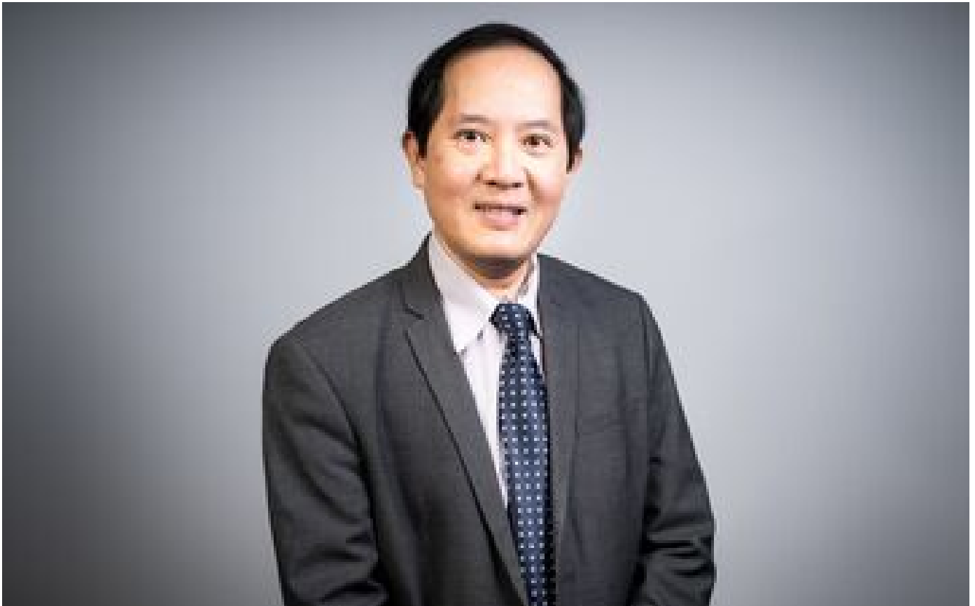
Enquête sur les nouvelles mobilités en Île-de-France : « Un dispositif inédit dans la région »