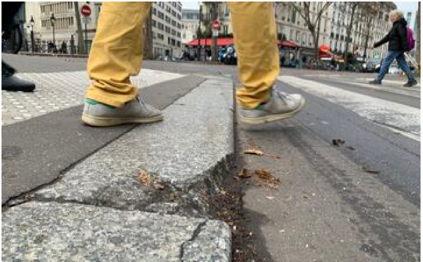
La Ville de Paris sommée d'abaisser ses trottoirs P