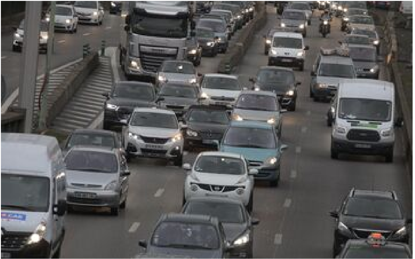
Enquête sur les nouvelles mobilités dans le Grand Paris : le journal de bord d'un cobaye des transports P