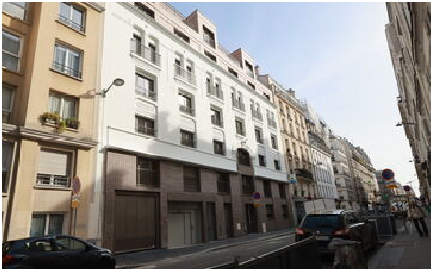
Immobilier : à Paris, cet ancien garage a été transformé en logements sociaux, un sacré défi P