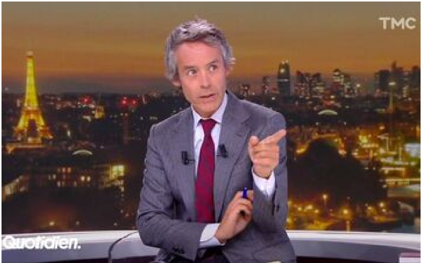
« Il a foutu en l'air la commission » : Yann Barthès réagit aux propos du député Quentin Bataillon chez « TPMP »