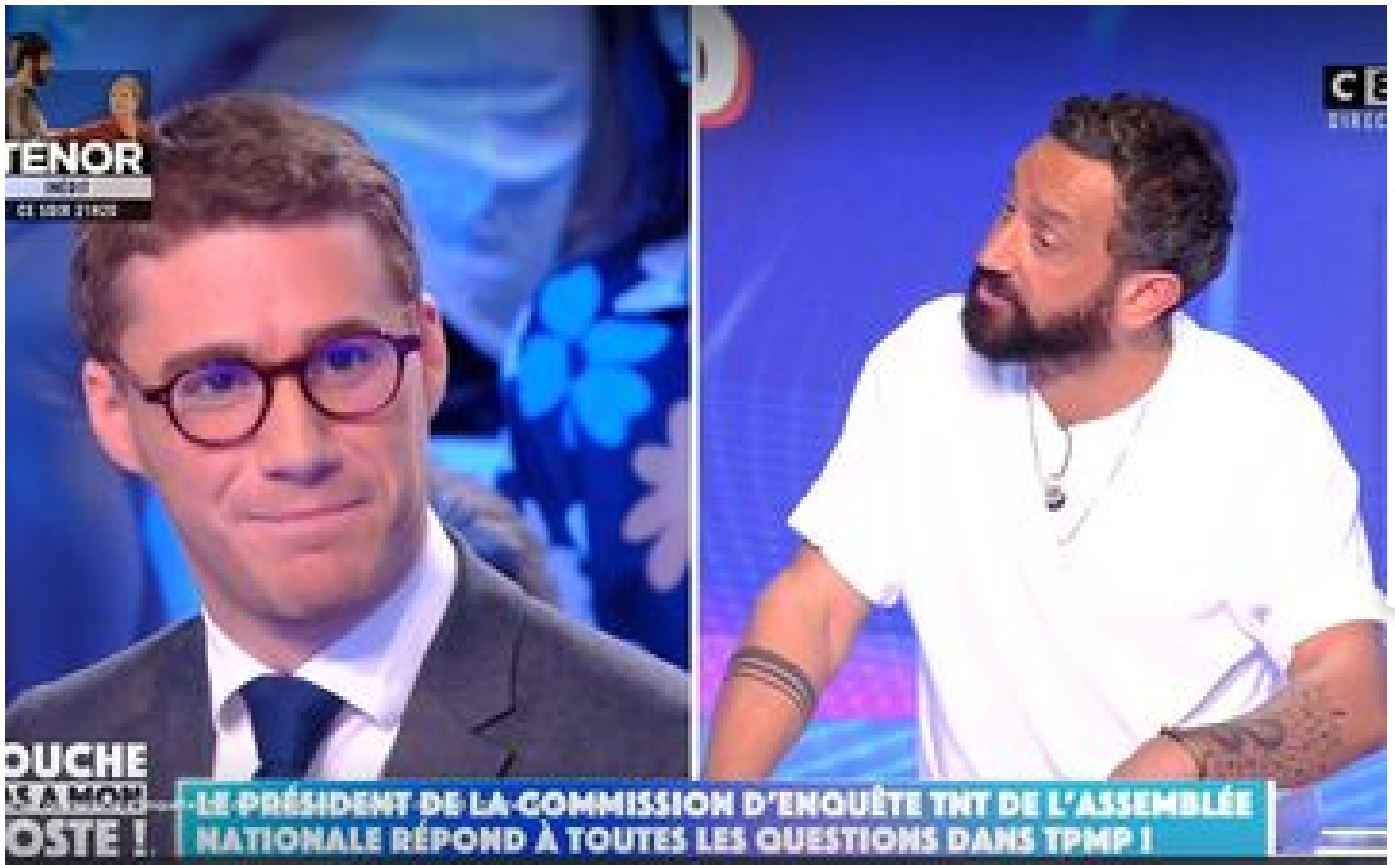
Quentin Bataillon chez Cyril Hanouna : récit d'un malaise politique et médiatique P