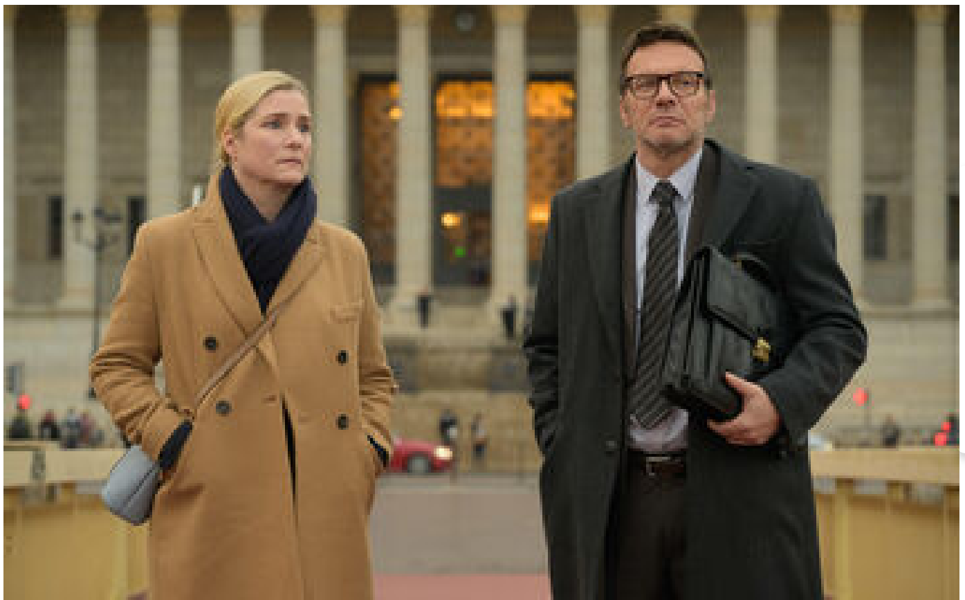
Audiences TV : « Tu ne tueras point » bat le PSG et « Top Chef »