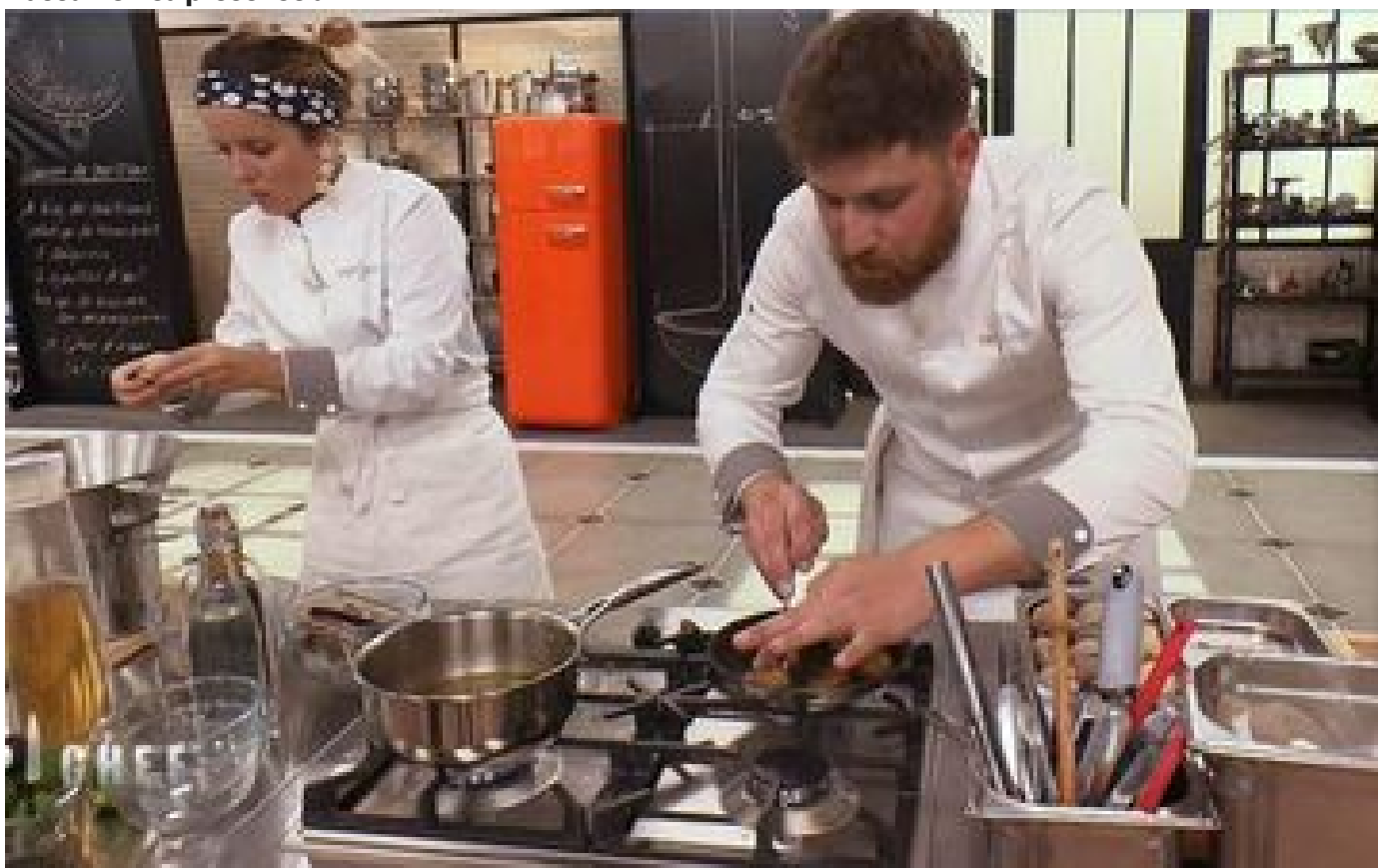
« Top Chef », saison 15, épisode 4 sur M6 : « Des coquillages, j'en ai pas dans ma forêt ! »