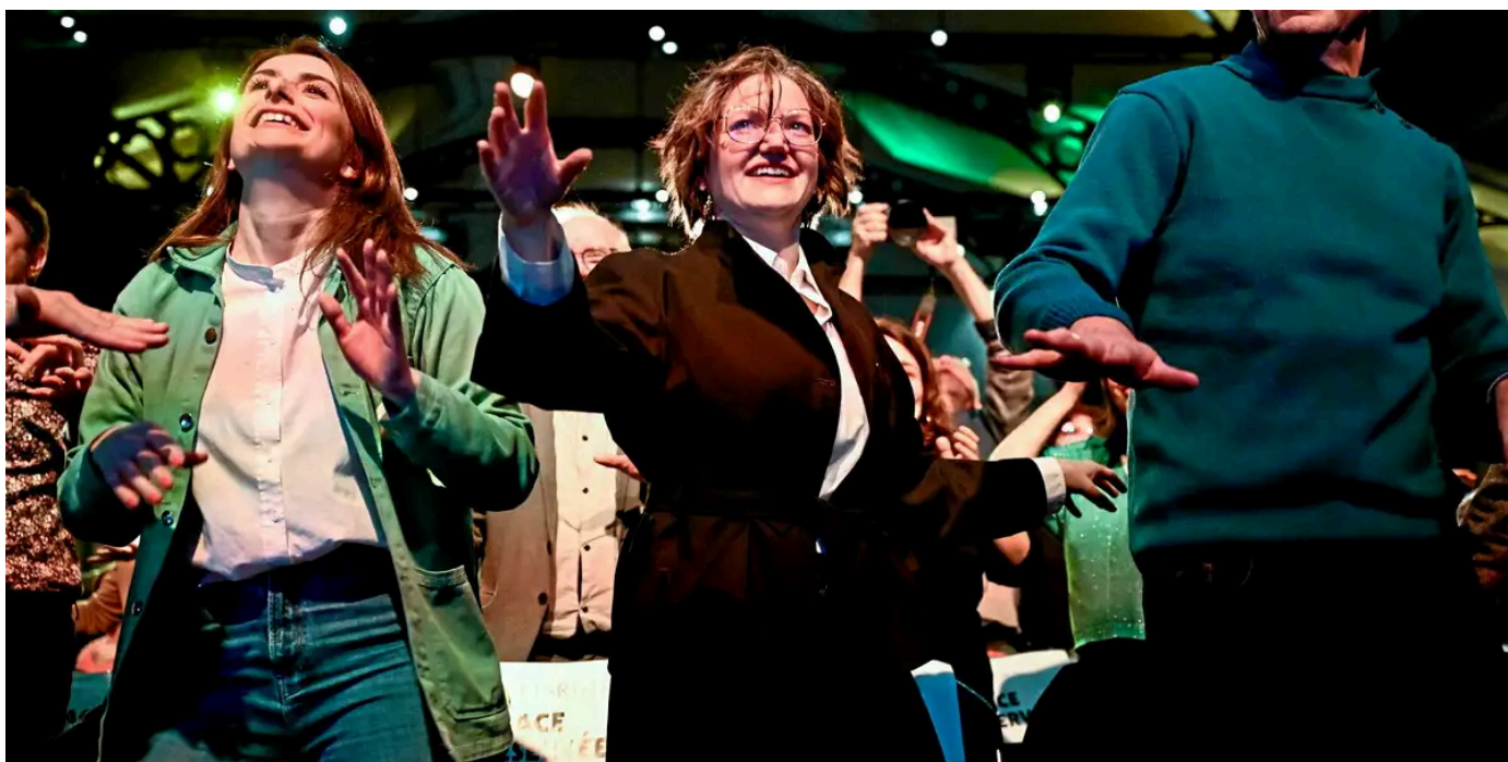
Séance de « booty therapy » lors du premier meeting pour la campagne des européennes de Marie Toussaint (au centre), entourée de Marine Tondelier et Yannick Jadot, le 2 décembre 2023.