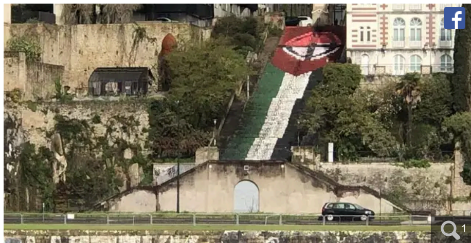
La croix celtique, d'origine chrétienne, symbole aujourd'hui détournée par la mouvance néofasciste, recouvre en partie le drapeau palestinien, peint sur les marches de la butte Sainte-Anne depuis le 8 mars dernier.