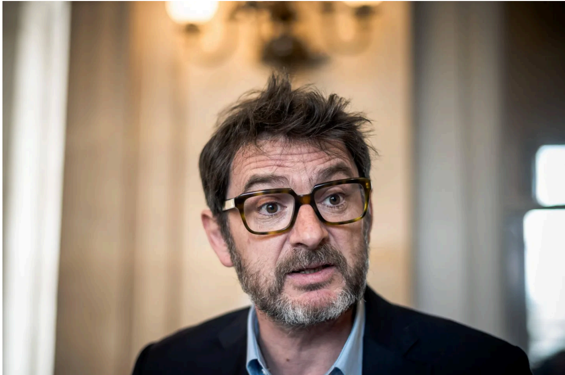
Erwan Balanant, député MoDem du Finistère.

28/03/2024 à 19:33, Mis à jour le 30/03/2024 à 13:26