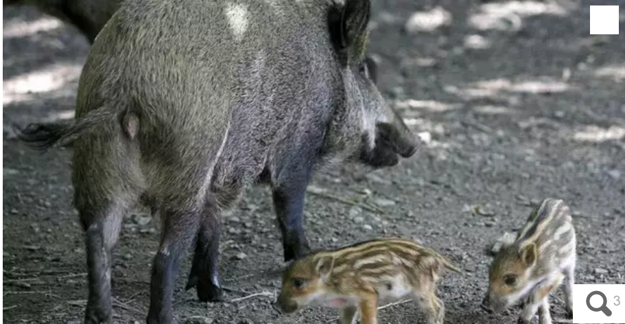
Une laie et ses petits (photo d'illustration).

Votre e-mail, avec votre consentement, est utilisé par la société Additi Multimedia pour recevoir les newsletters sélectionnées. En savoir plus