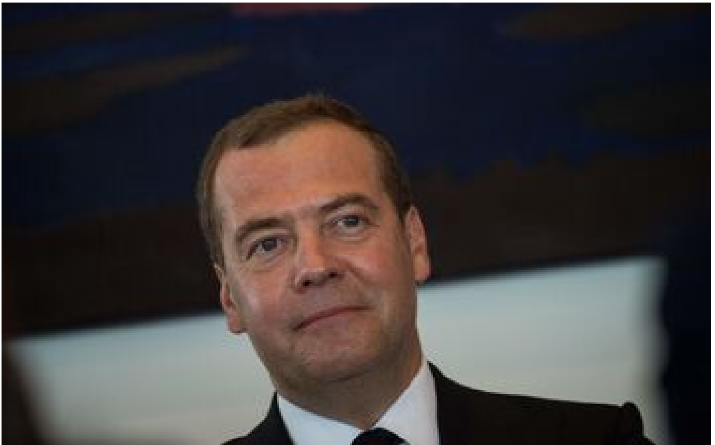
Russie : des cadres du régime Poutine évoquent le retour de la peine de mort dans le pays