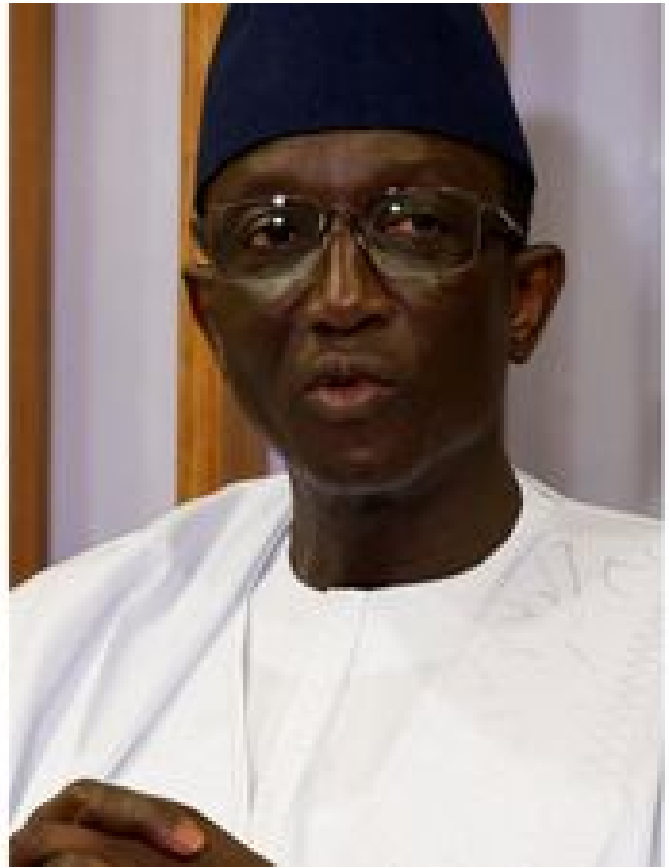
Sénégal : qui sont Amadou Ba et Bassirou Diomaye Faye, les favoris de la proutidentielle ?