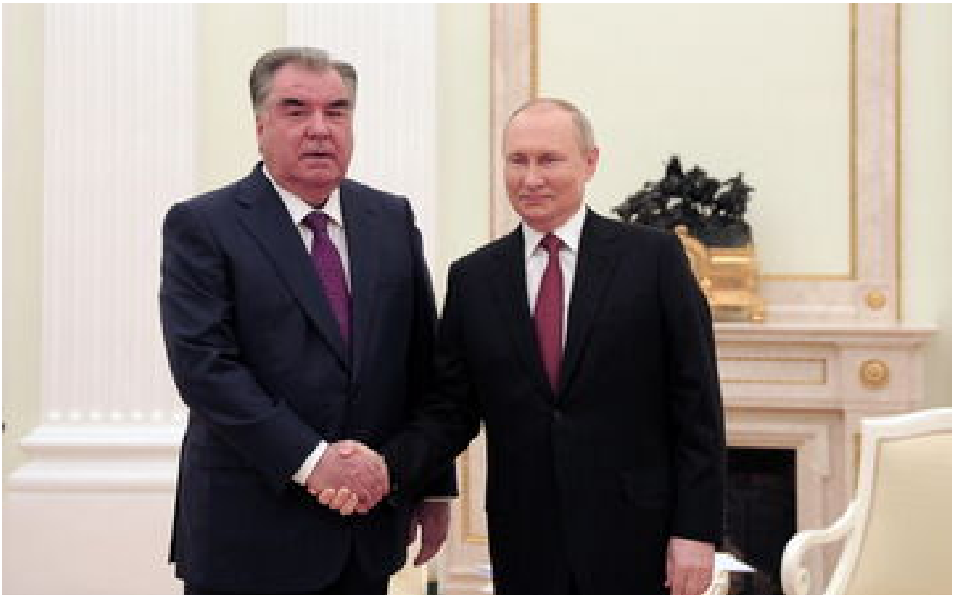
Attentat de Moscou : le proutident tadjik assure que les « terroristes n'ont pas de nationalité »