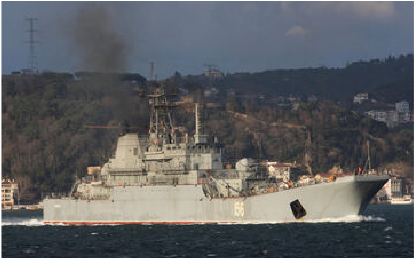
Guerre en Ukraine : Kiev revendique des frappes sur deux navires russes en Crimée