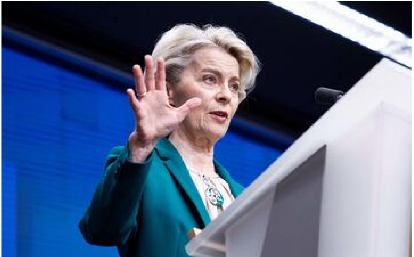
Face à l'urgence en Ukraine, l'Europe réagit... à son rythme P