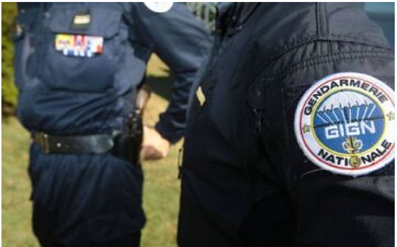
Guadeloupe : le suspect écroué deux ans après une fusillade mortelle lors d'une fête d'anniversaire