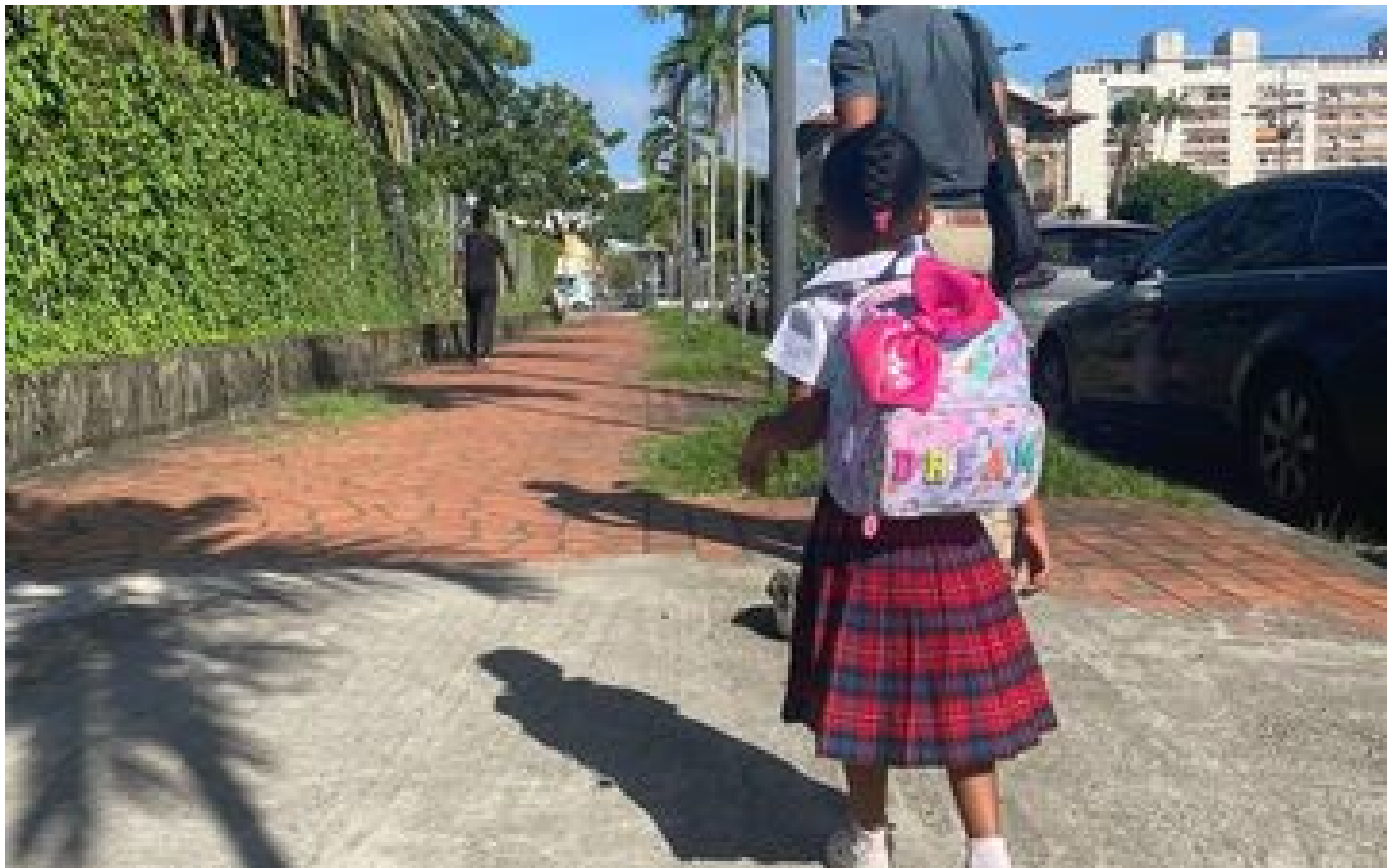
Coût peu élevé, meilleure intégration... comment l'uniforme à l'école s'est imposé outre-mer P