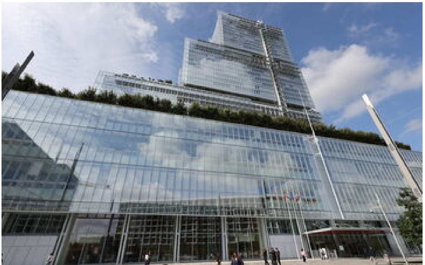
Affaire Jean-Louis Turquin : relaxe requise pour le procureur poursuivi en diffamation par la veuve du défunt P