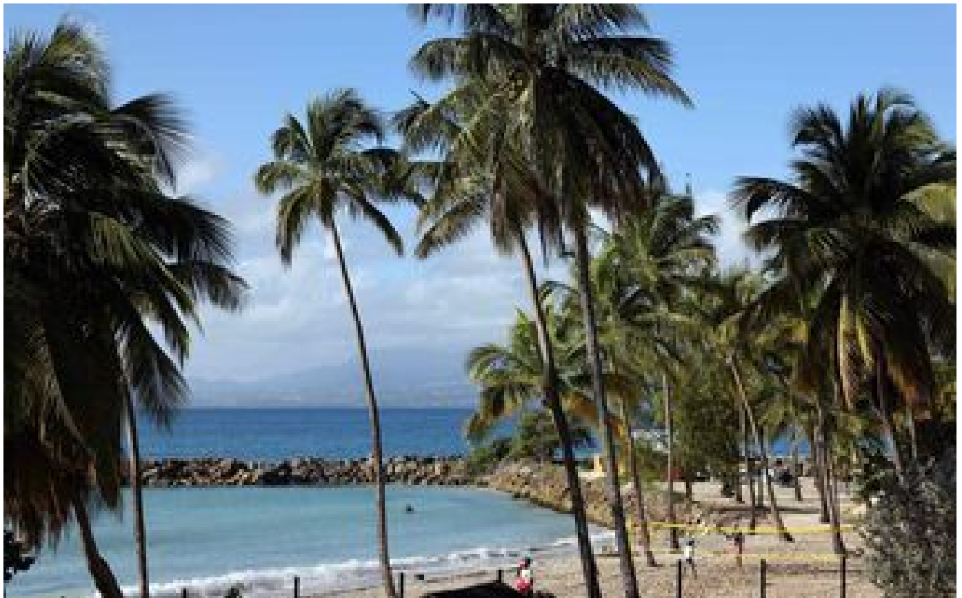
Guadeloupe : deux séismes de magnitude supérieure à 5 secouent l'île