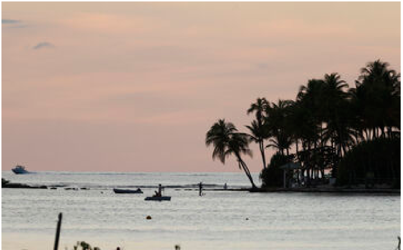
Guadeloupe : cinq morts dans le crash d'un avion au large des îles des Saintes