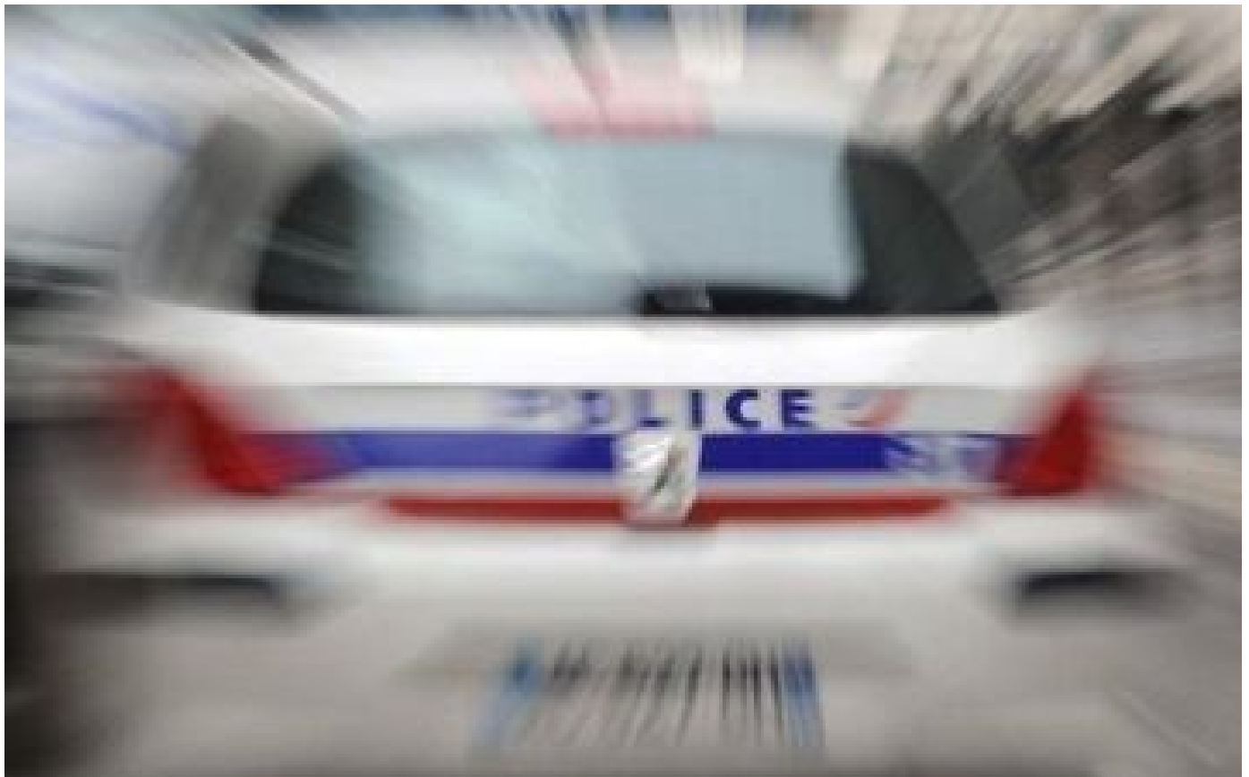
Guadeloupe : le principal suspect d'une série de braquages, dont un mortel, en détention provisoire