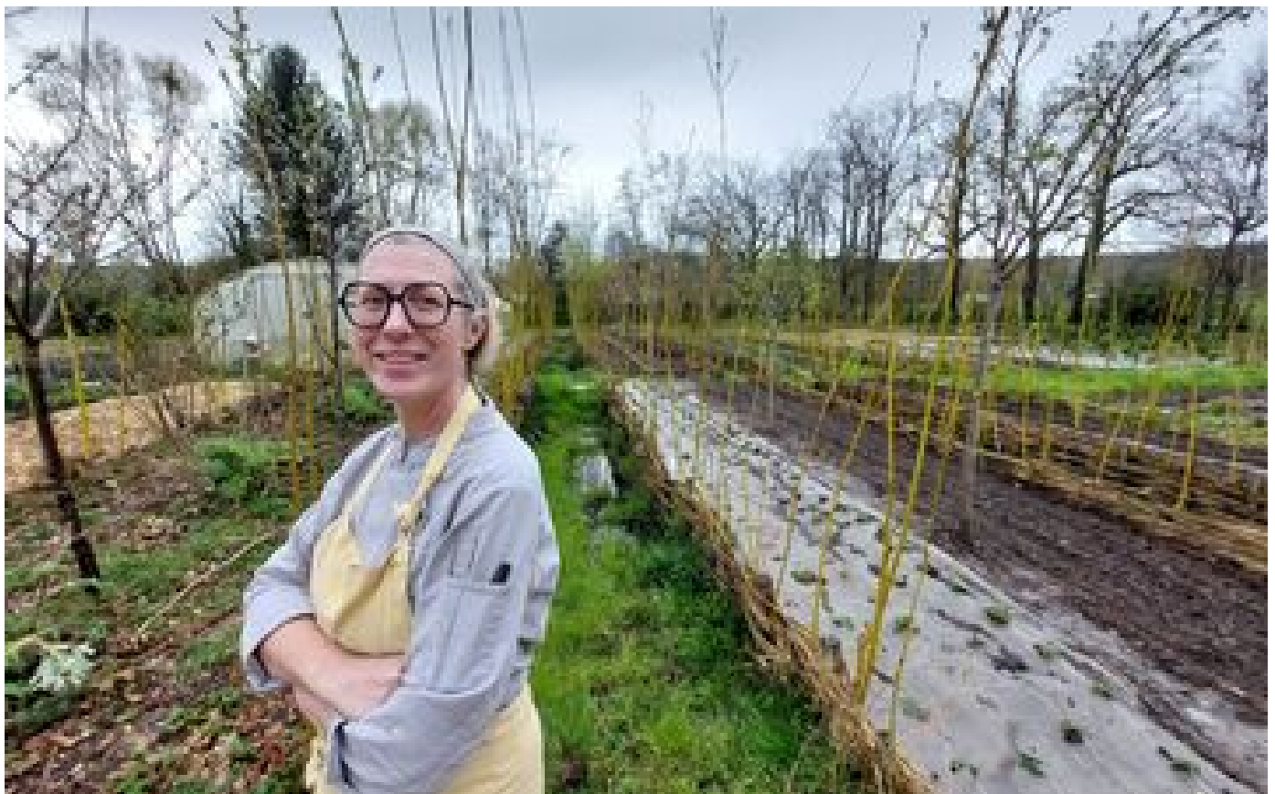
« C'est le potager qui décide de la carte » : un restaurant de Gambais primé au Michelin pour sa cuisine locale P