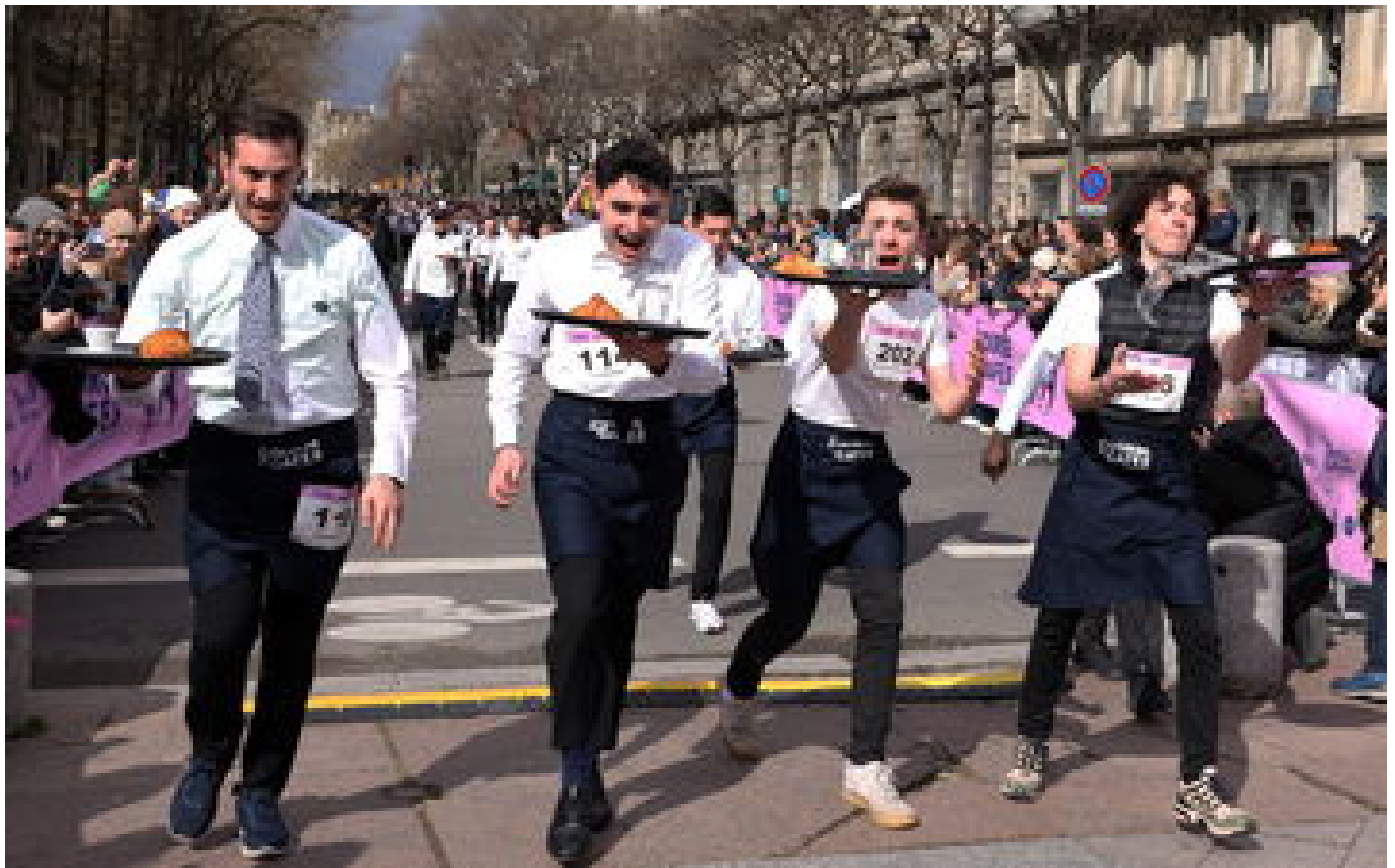
« C'est dur pour les mollets ! » : après 13 ans d'absence, la course des garçons de café a fait son retour à Paris