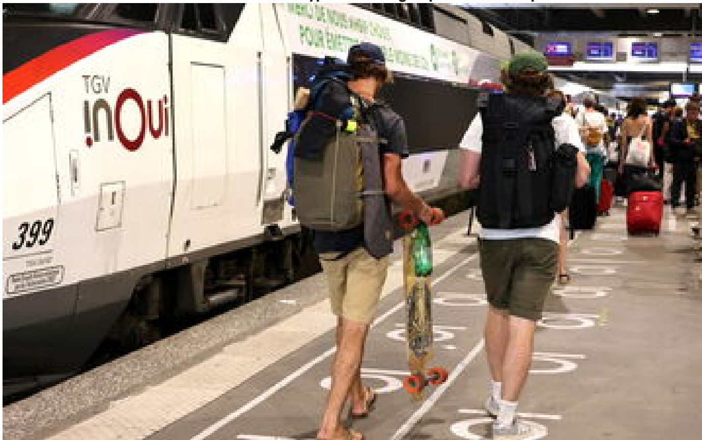
SNCF : les billets de train pour cet été mis en vente ce mercredi 13 mars