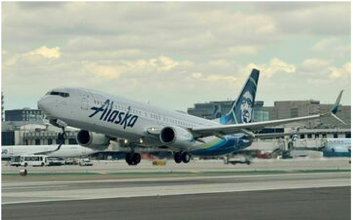
Un Boeing 737 atterrit aux États-Unis avec la porte de la soute contenant des animaux ouverte