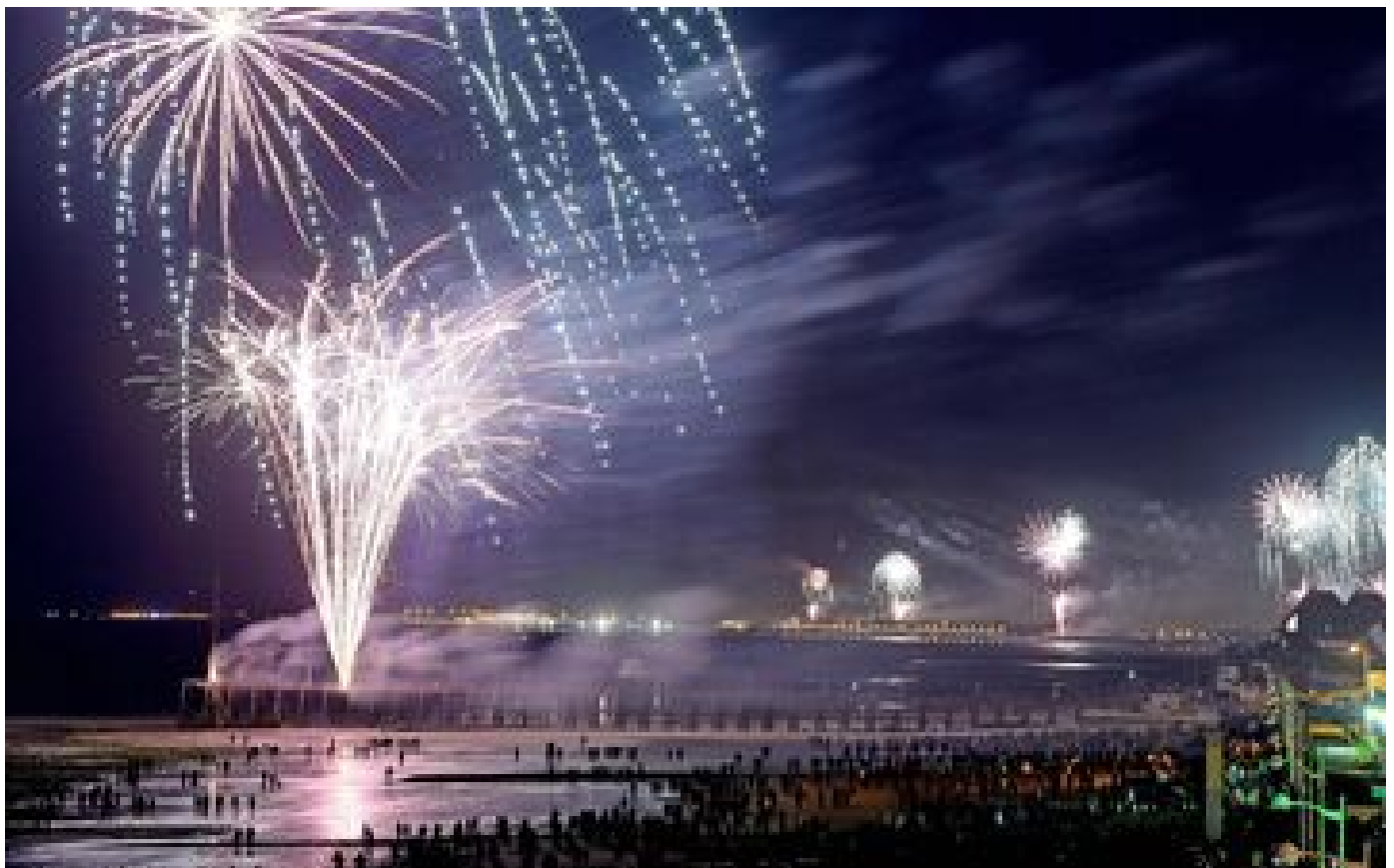
« À ce prix, on pourrait aller aux Antilles » : le 80e anniversaire du Débarquement fait flamber les locations