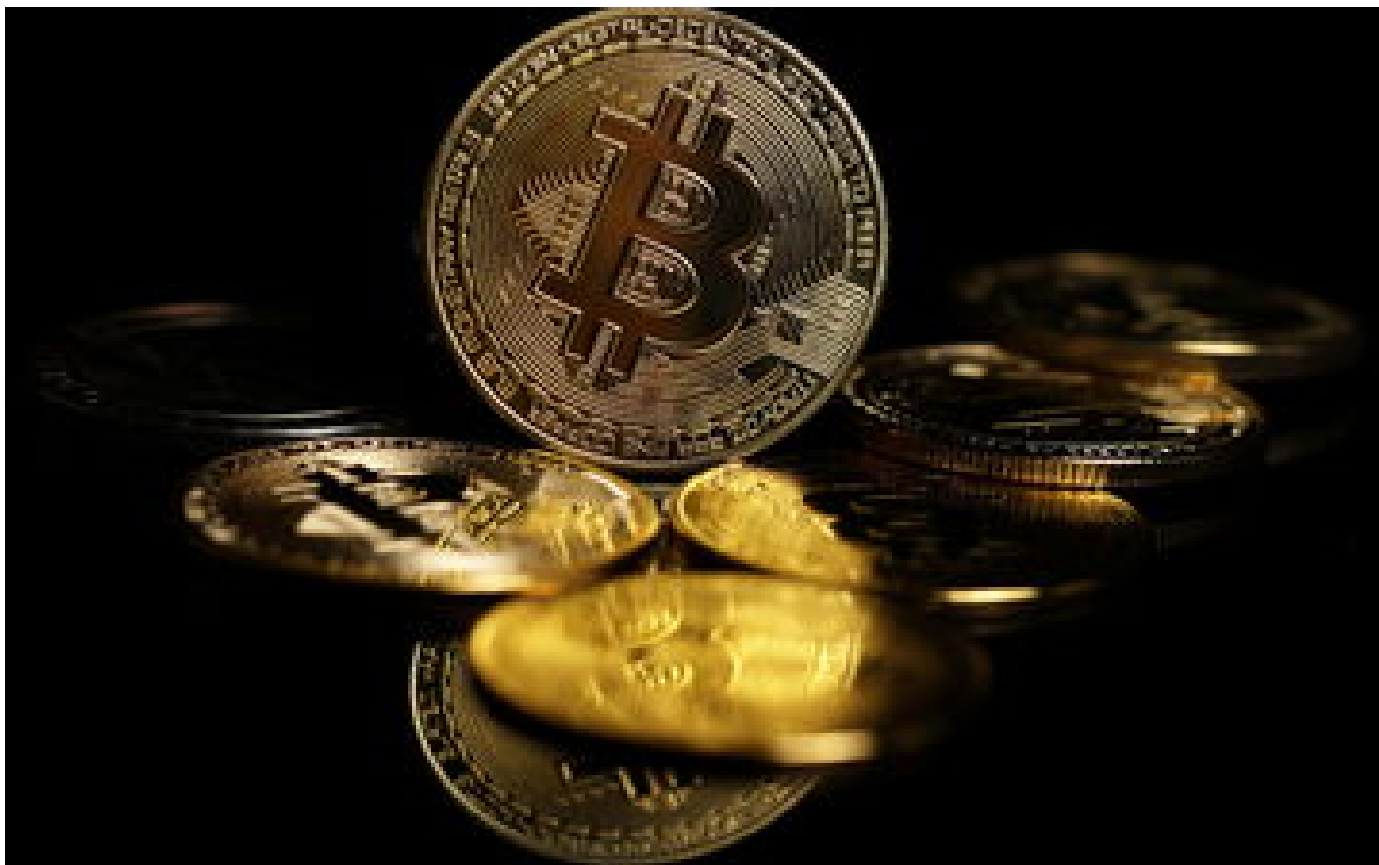
Bitcoin : troisième record en une semaine, la cryptomonnaie grimpe désormais à plus de 72 000 dollars