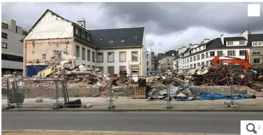
La dernière façade de l'ancienne Poste du quai des Indes, à Lorient, est tombée ce vendredi 8 mars 2024.

Votre e-mail, avec votre consentement, est utilisé par la société Additi Multimedia pour recevoir les newsletters sélectionnées. En savoir plus