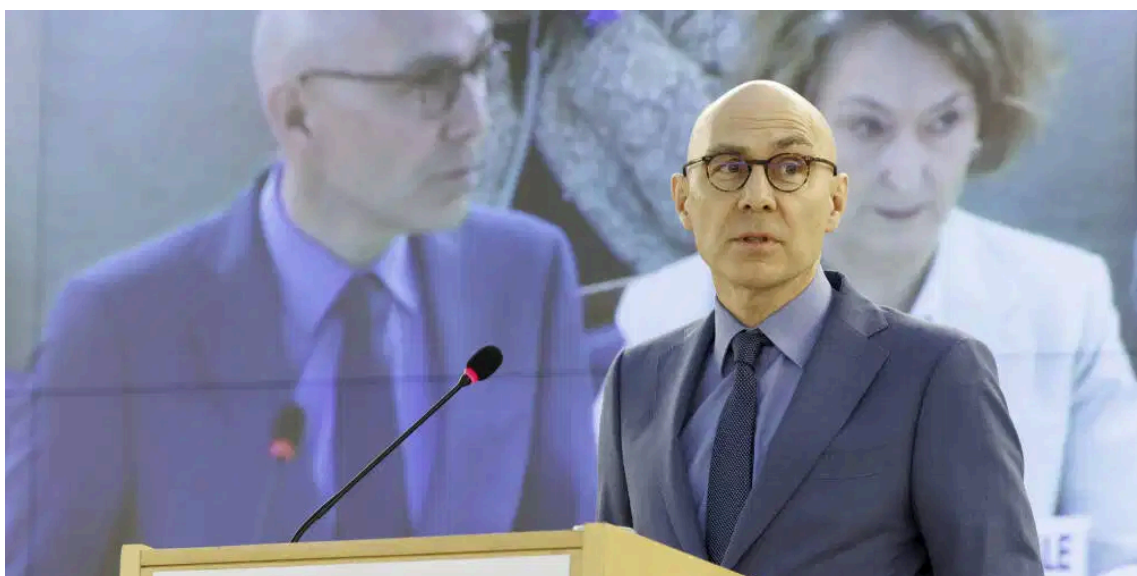
Le haut-commissaire aux Droits humains de l'ONU Volker Türk, photographié le 26 février 2024 face au Conseil des Droits de l'Homme.