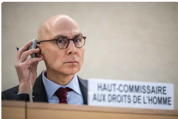
Le Haut Commissaire des Nations Unies aux droits de l'homme Volker Turk, photographié le 29 février 2024, a prononcé ce lundi 4 mars un discours dressant un état des lieux des droits humains.

INTERNATIONAL - Raciste, délirant et incitant à la violence. Le Haut-Commissaire de l'ONU aux droits de l'homme, Volker Türk, a pointé du doigt ce lundi 4 mars des théories complotistes du « grand remplacement » en Europe et en Amérique du Nord, à l'occasion de son traditionnel discours dans lequel il dresse un état des lieux des droits humains. Ces théories sont « fondées sur l'idée fautive selon laquelle les juifs, les musulmans, les personnes non blanches et les migrants cherchent à « remplacer » ou supprimer les cultures et les peuples des pays », a-t-il souligné.