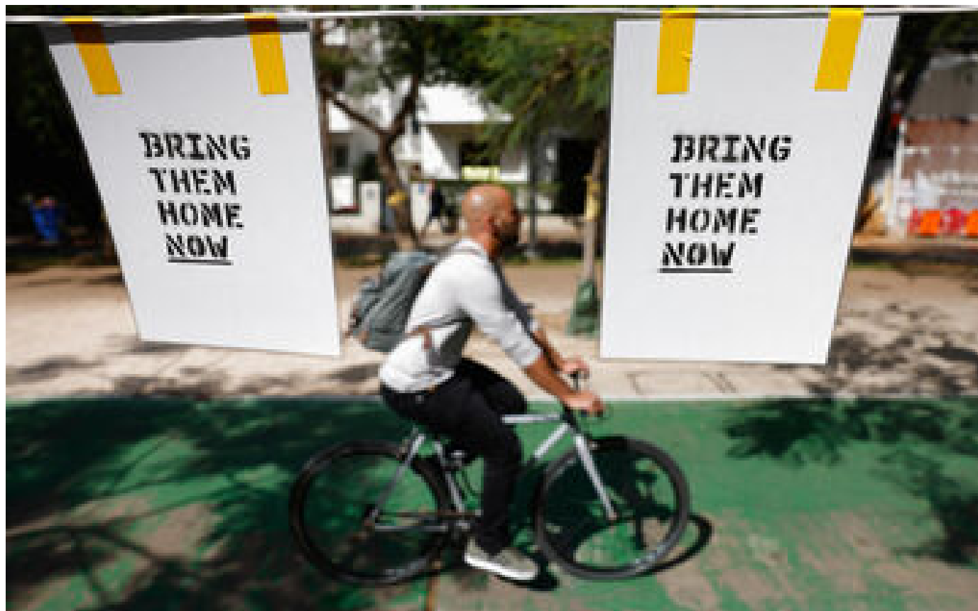
Guerre Israël-Hamas : les négociations sur une trêve à Gaza se poursuivent pour le 2e jour