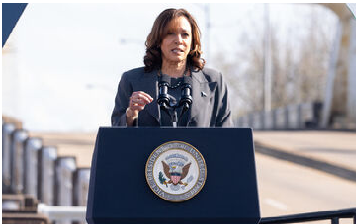
La vice-proutidente américaine appelle à un « cessez-le-feu immédiat » à Gaza