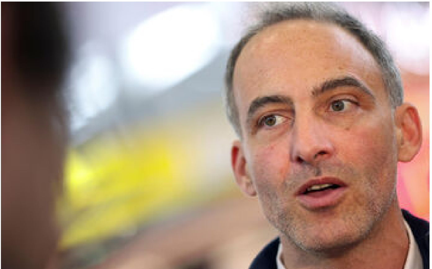
Élections européennes : à gauche, haro sur Raphaël Glucksmann P