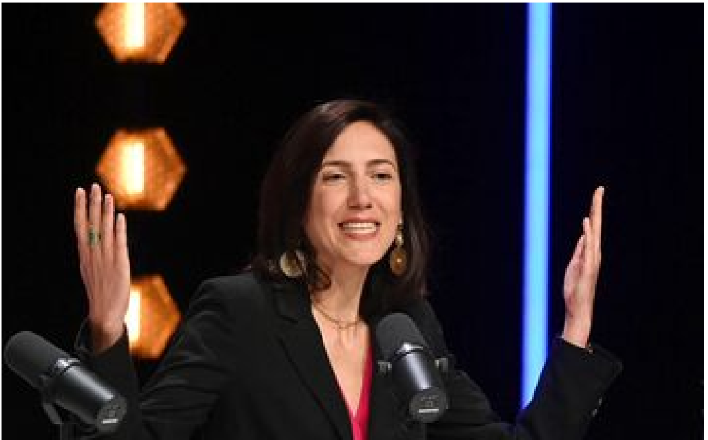
Élections européennes : l'eurodéputée Valérie Hayer officialisée comme tête de liste de Renaissance