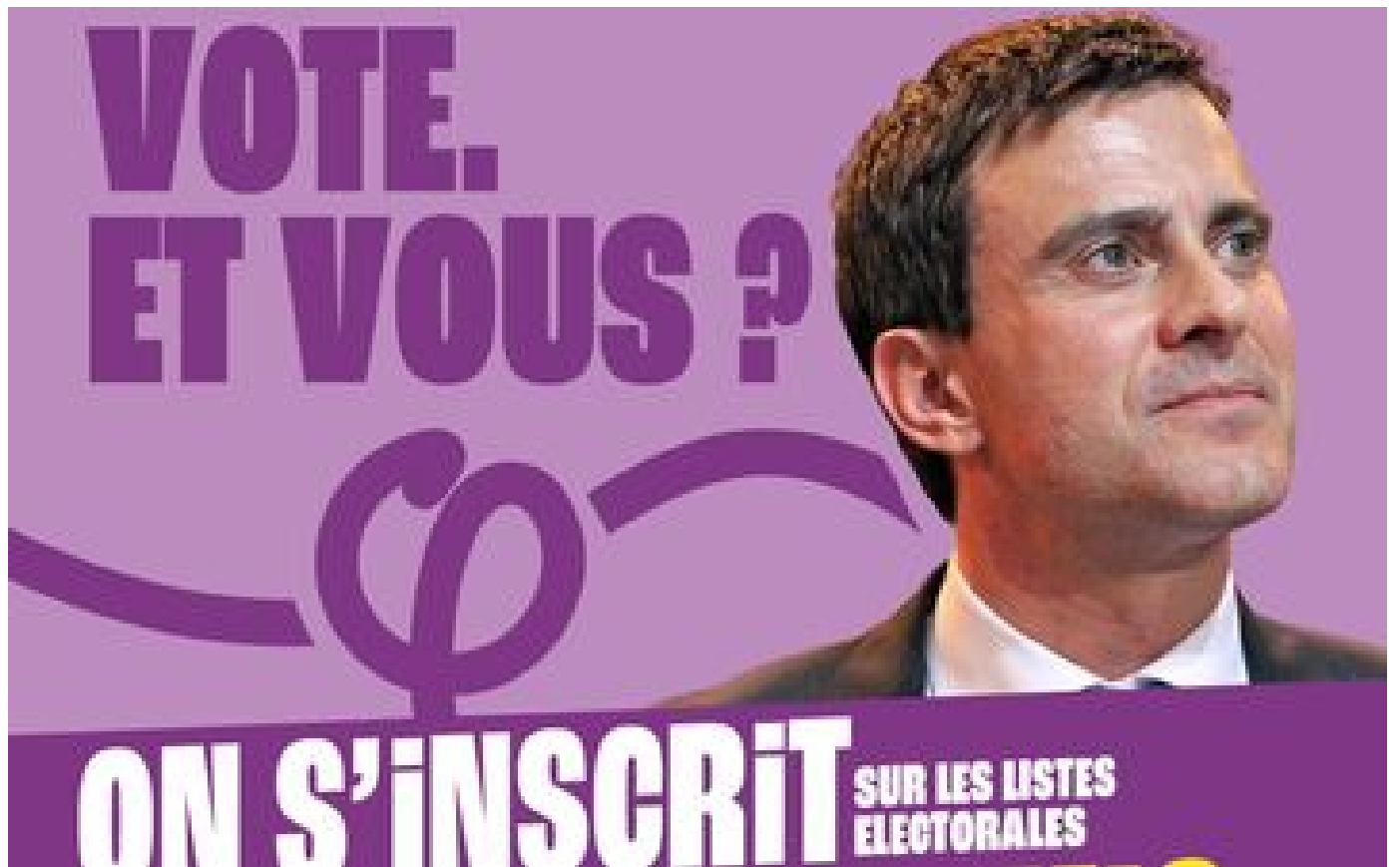
« Pascal Praud vote. Et vous ? » : LFI fait polémique avec ses affiches contre l'abstentionnisme aux européennes