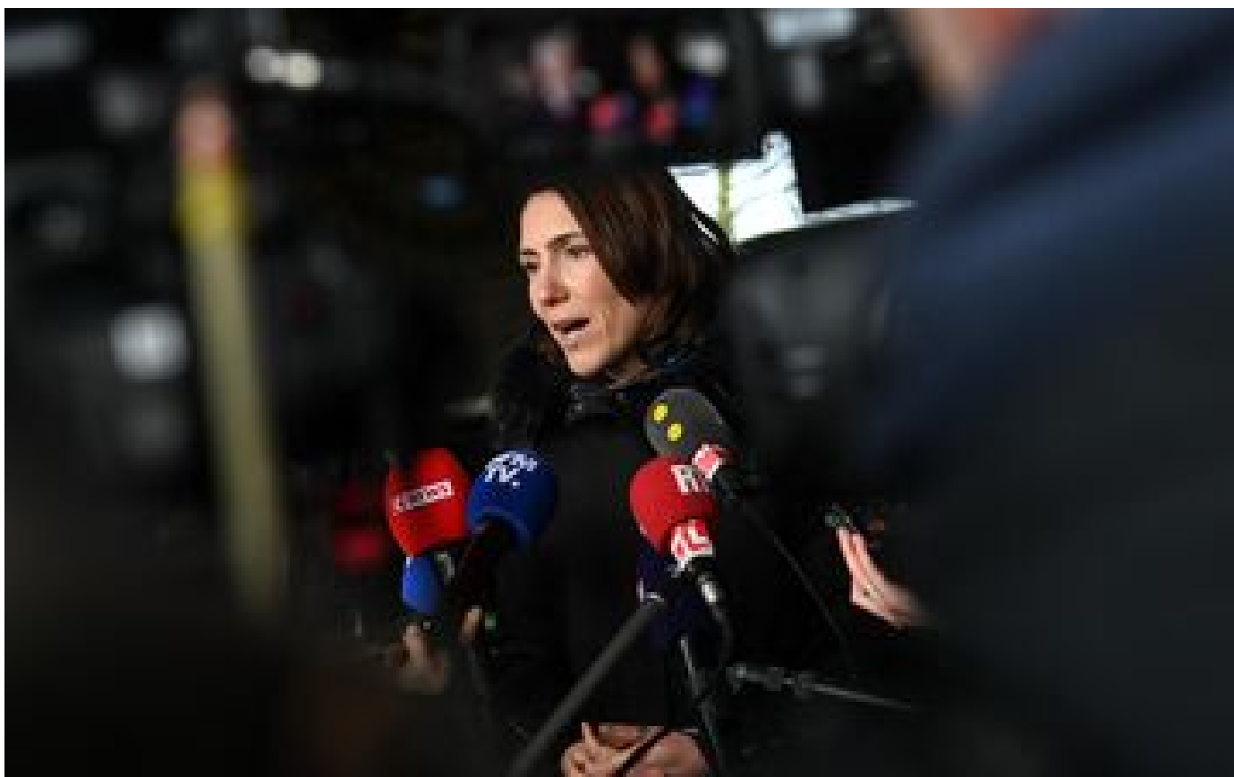
Européennes : « Je ne suis pas une candidate par défaut »... en Mayenne, Valérie Hayer lance sa campagne P