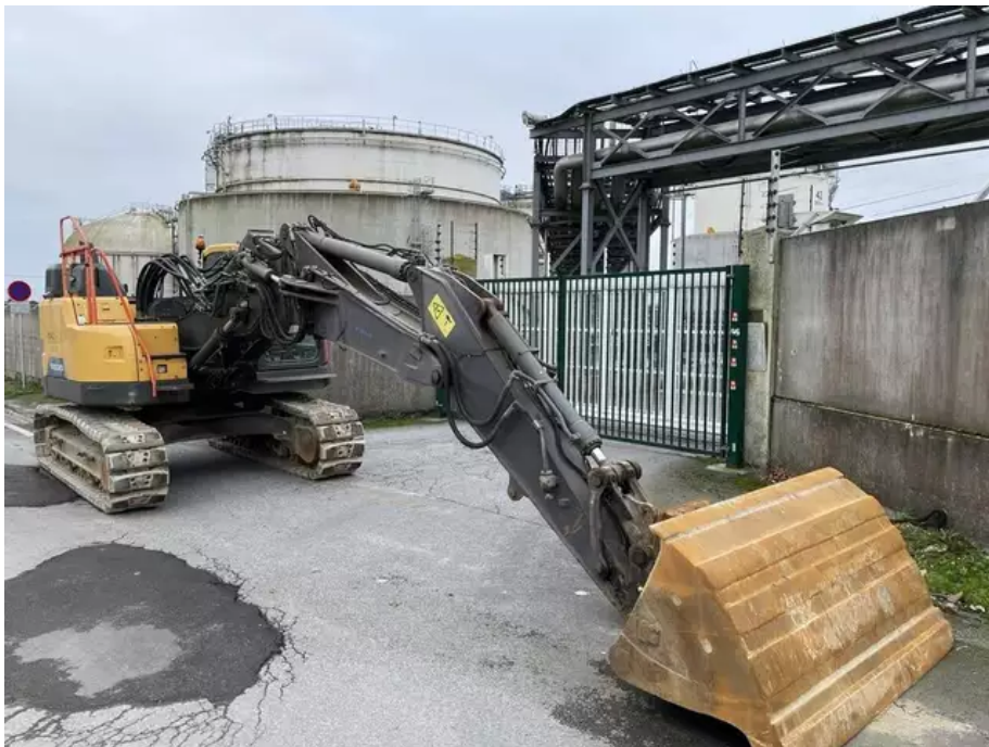
Dimanche, une seule pelle bloquait l'accès arrière du dépôt, rue du Comté-de-Bernadotte.