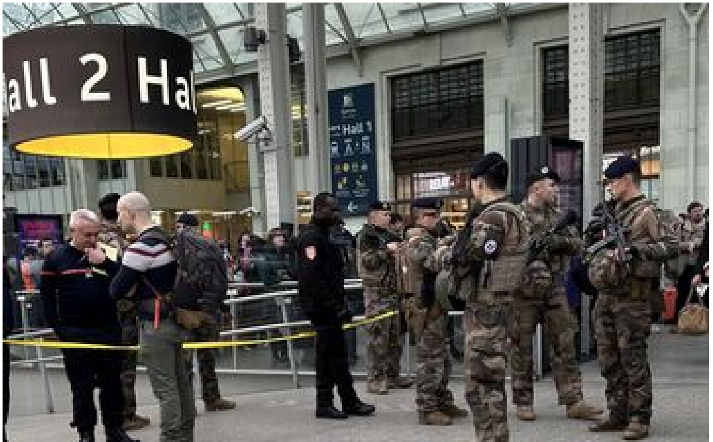
Attaque à l'arme blanche gare de Lyon à Paris : plusieurs blessés, un homme interpellé