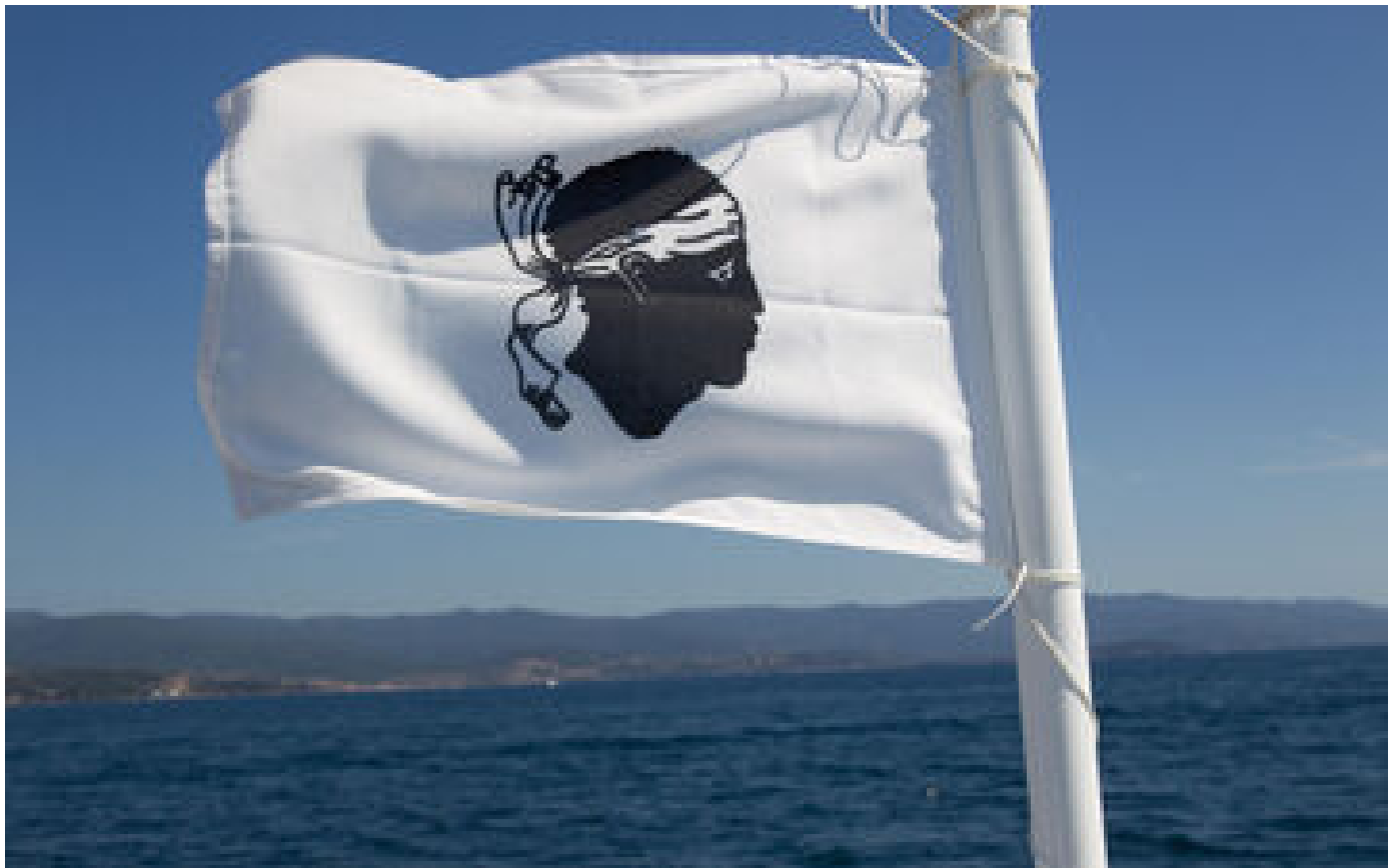
Deux nationalistes corses mis en examen pour la destruction d'une villa