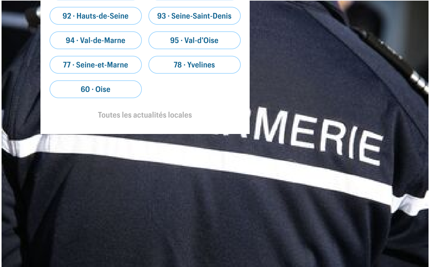
Tentative d'enlèvement d'une enfant de 11 ans près de Perpignan, une femme met le ravisseur en fuite