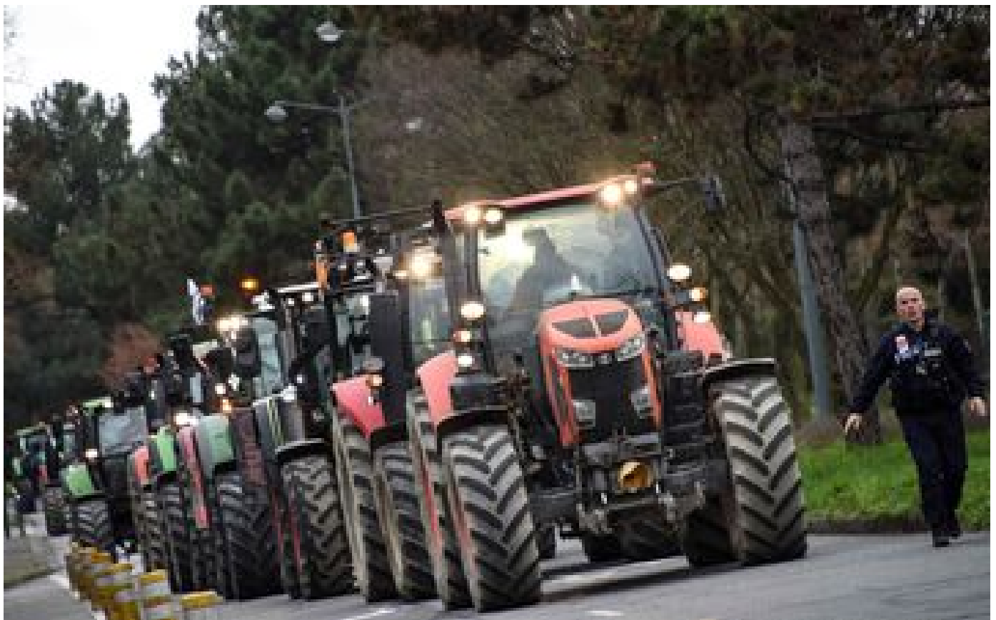
Finistère : une femme accouche dans sa voiture, bloquée dans des bouchons provoqués par les agriculteurs