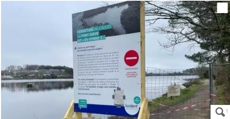
Fermée depuis le 15 décembre, la digue du Symbole reste inaccessible aux piétons pour une durée indéterminée.

Votre e-mail, avec votre consentement, est utilisé par la société Aditi Multimedia pour recevoir les newsletters sélectionnées. En savoir plus