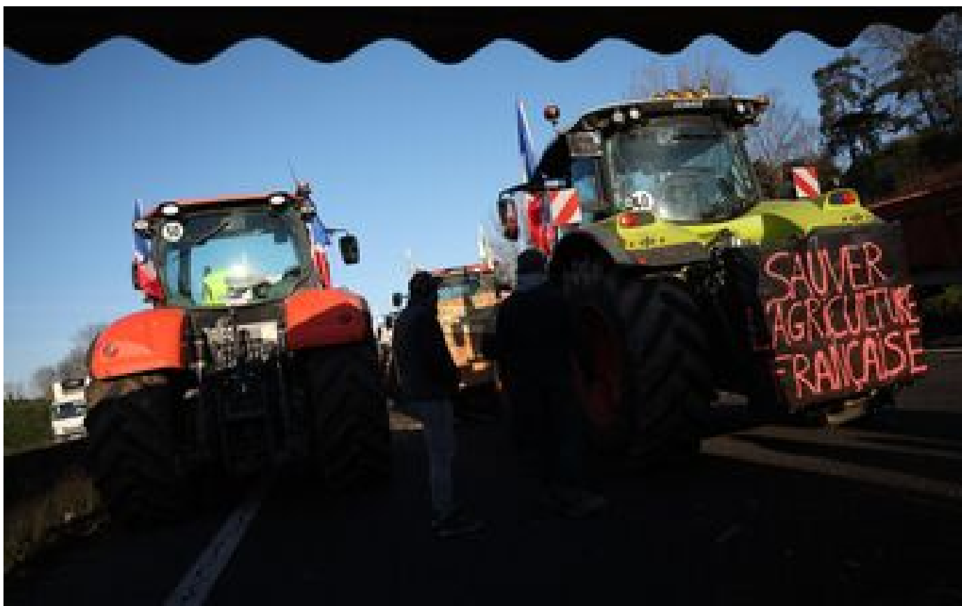
« L'élevage est encore une fois sacrifié » : pourquoi l'accord UE - Mercosur cristallise les passions P