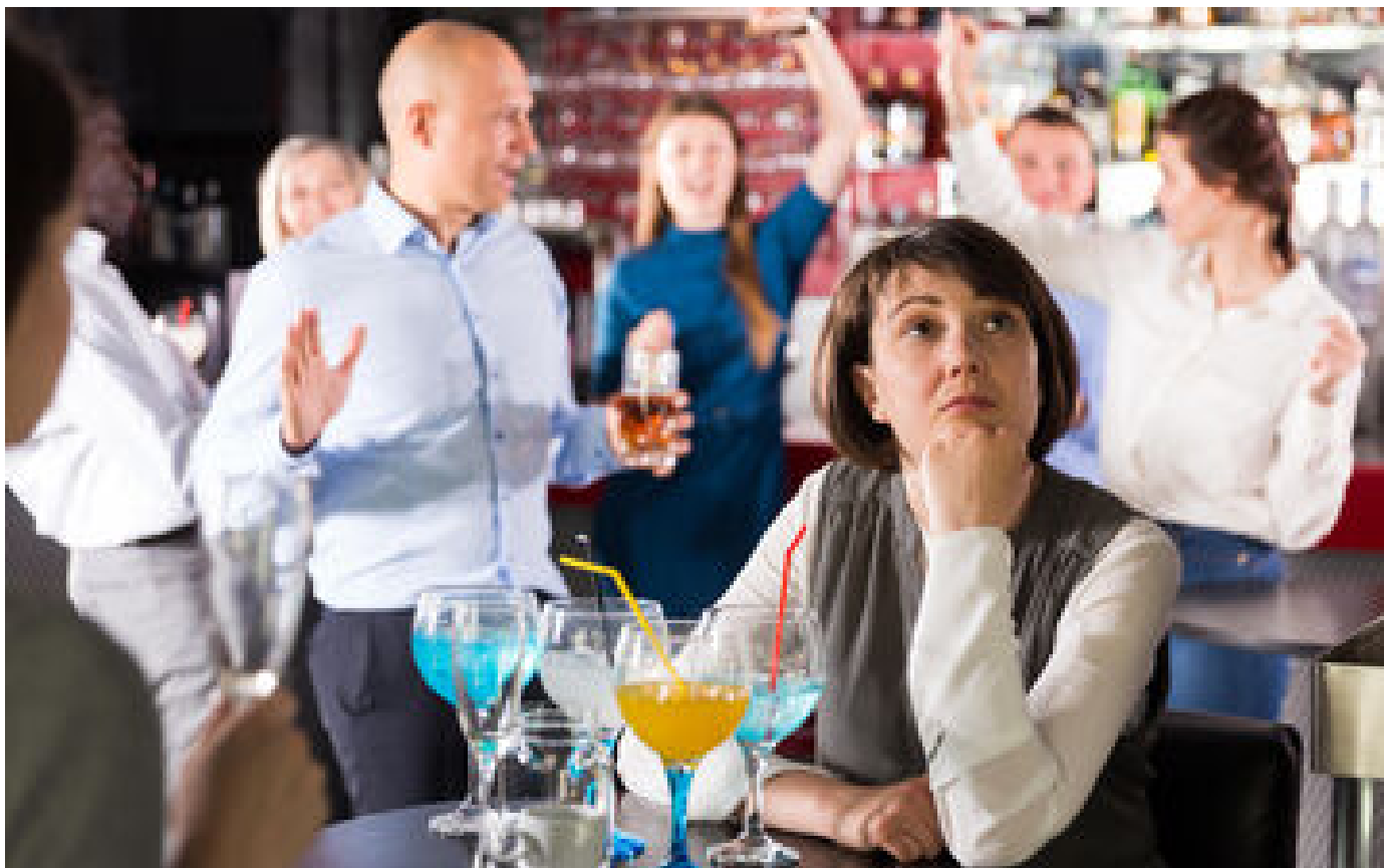
Viré pour ne pas avoir été « fun et pro » au travail, le salarié va toucher un demi-million d'euros