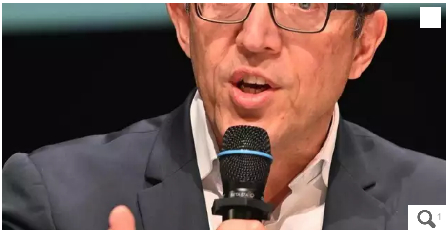
Christophe Clergeau, député européen, siège à la 5e place de la liste d'Union du PS avec le mouvement Place Publique de Raphaël Glucksmann.

Le chef de file de l'opposition au conseil régional des Pays de la Loire figure à la troisième place de la liste PS, aux élections européennes du 9 juin 2024, et sera donc le 5e de la liste d'union avec le Place Publique emmenée par l'essayiste et eurodéputé Raphaël Glucksmann.