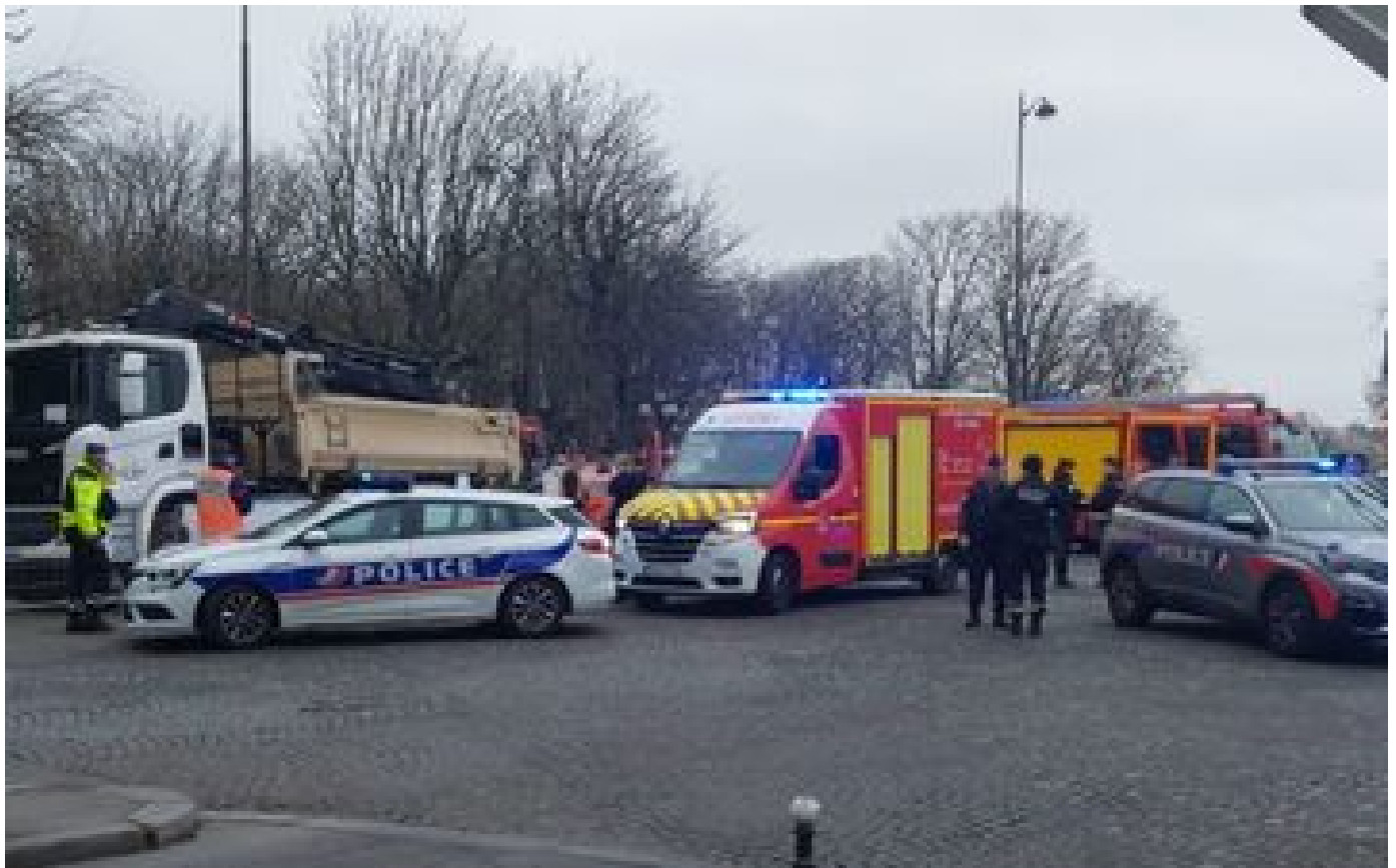
À Paris, une cycliste meurt percutée par un camion benne