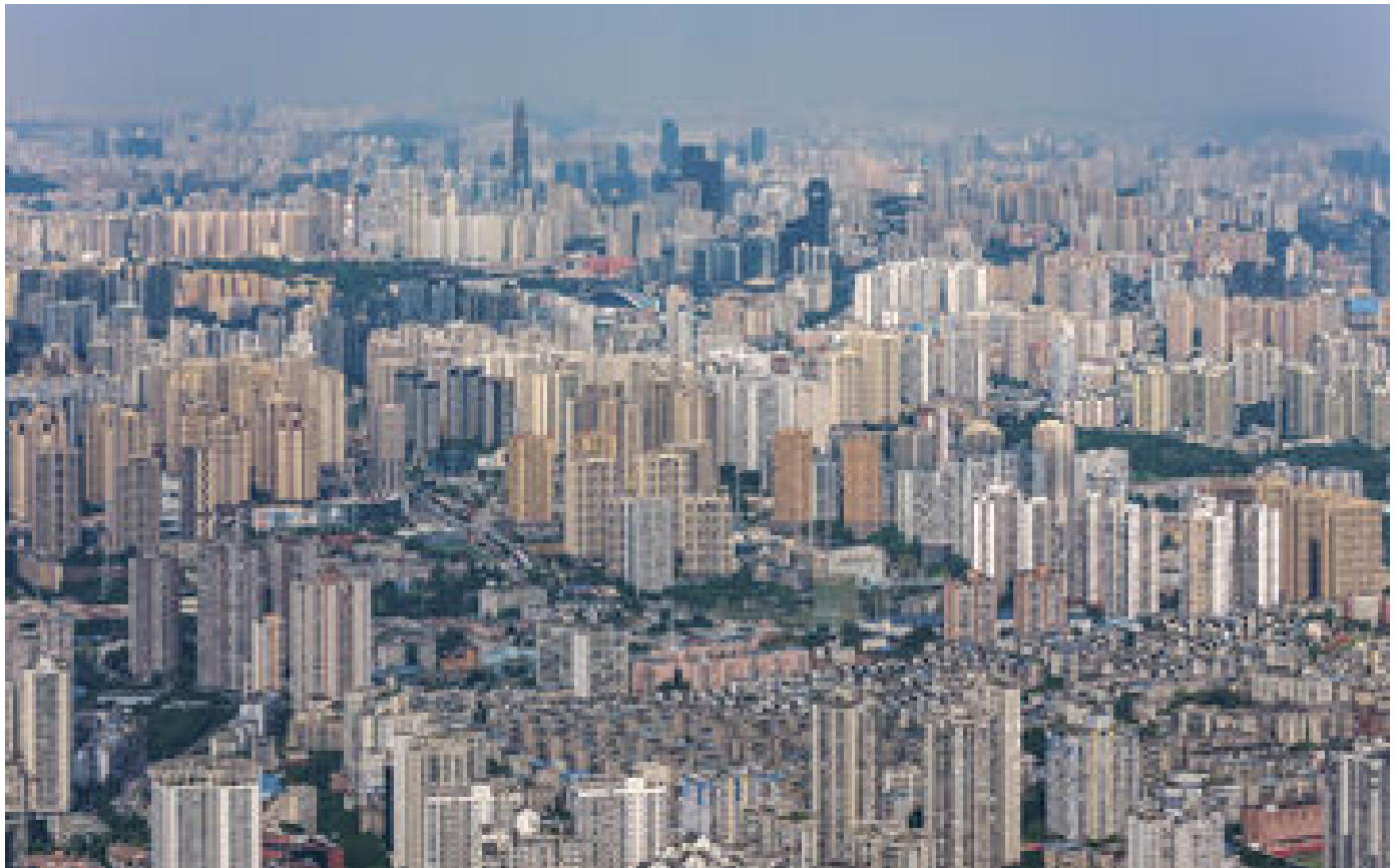
Il avait jeté ses bébés du 15e étage pour pouvoir l'épouser : en Chine, un homme et sa compagne exécutés