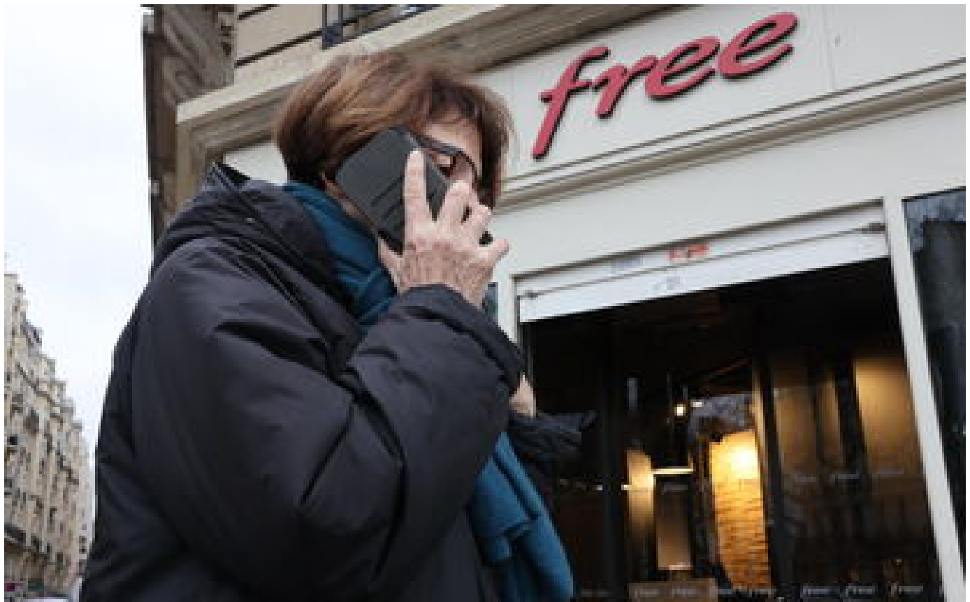
Téléphonie : Free s'engage à « bloquer le prix » de ses forfaits mobiles jusqu'en 2027 P