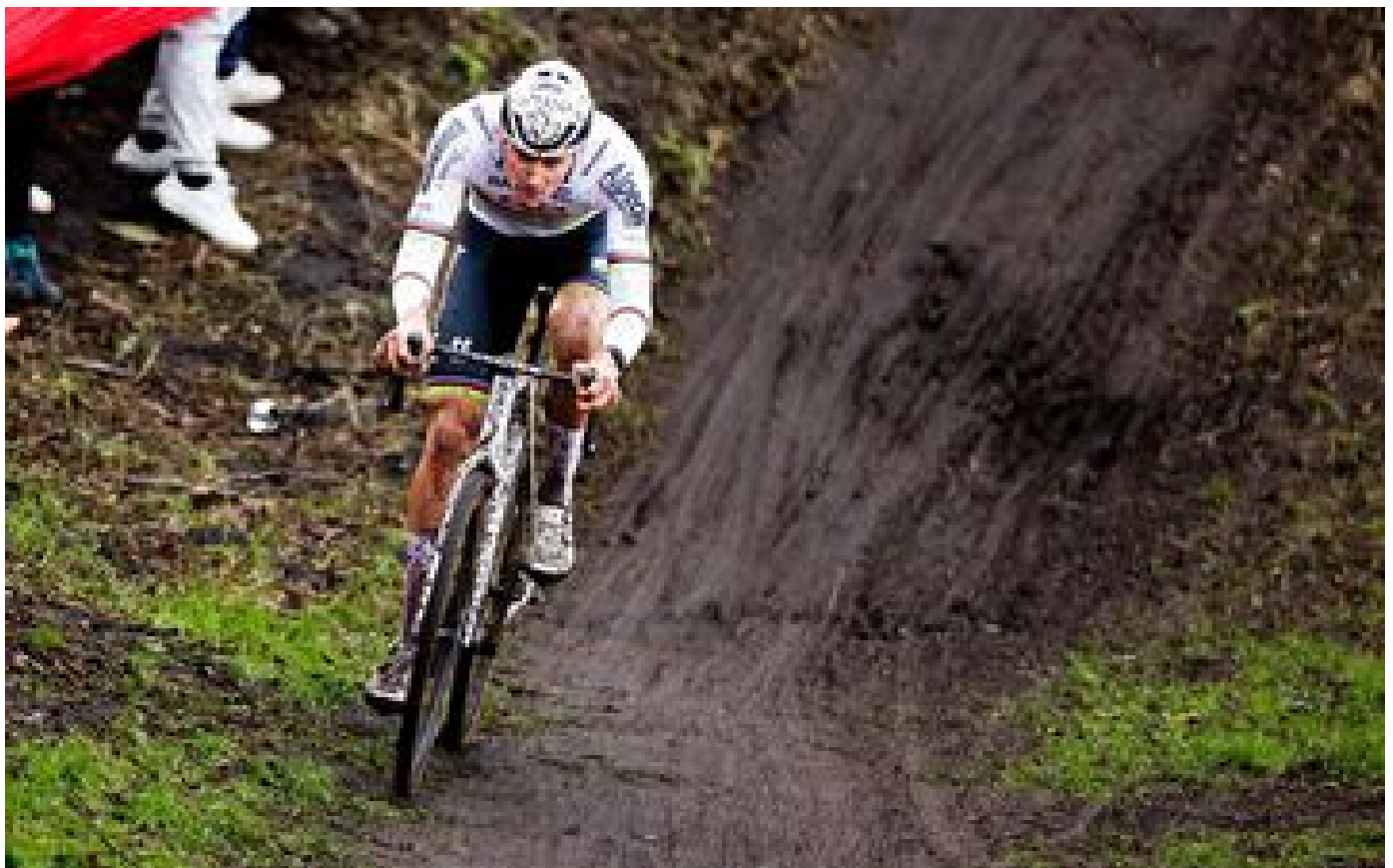
« À un moment, c'était trop » : quand Van der Poel crache sur un spectateur en cyclo-cross