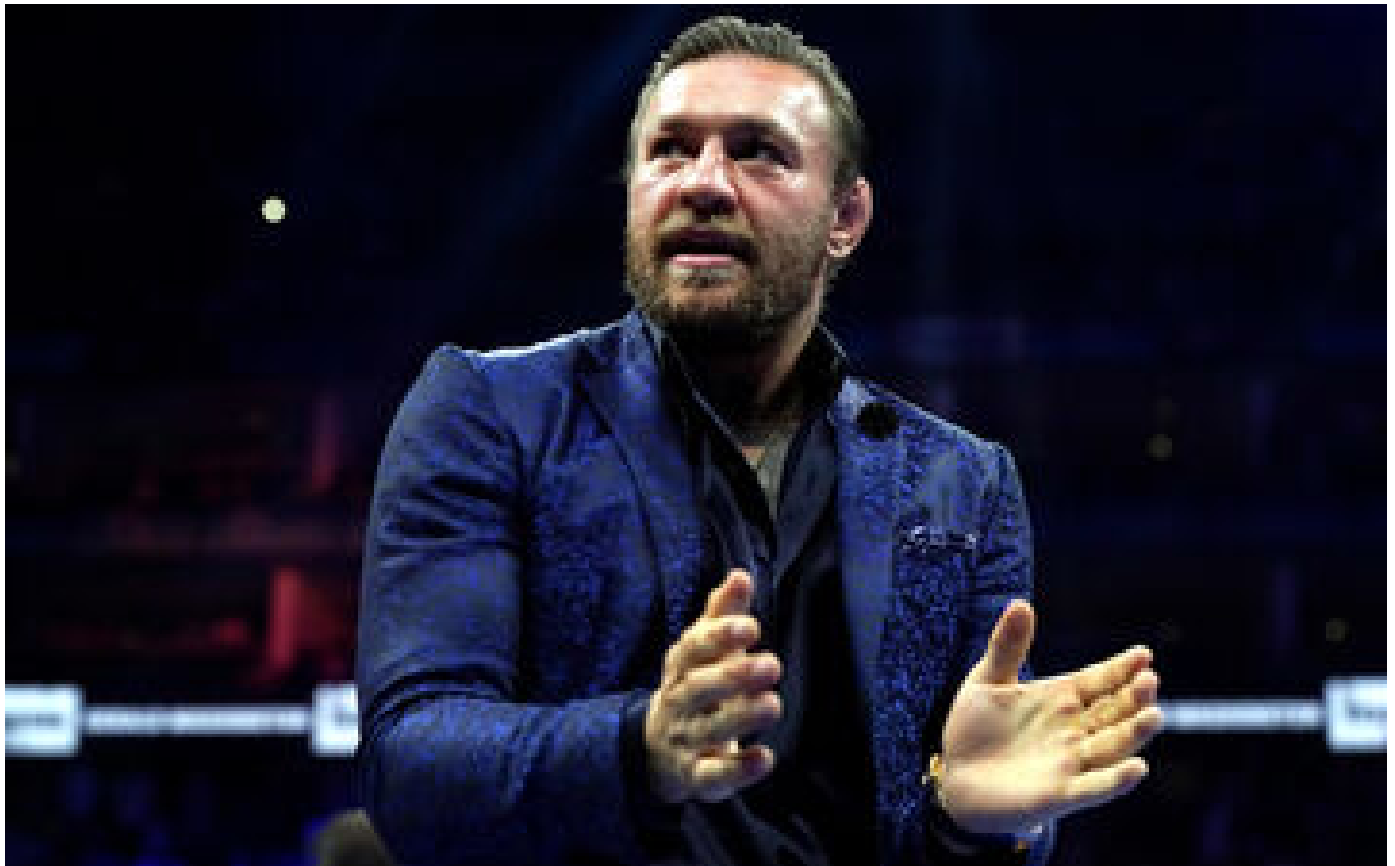
MMA : « Le plus grand come-back de l'histoire du sport », Conor McGregor annonce son retour pour 2024