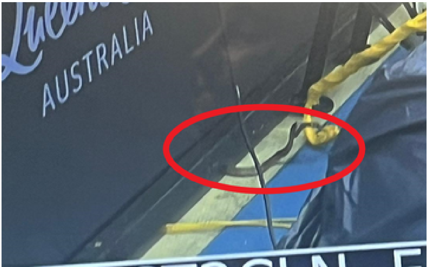
Tennis : un serpent venimeux perturbe le match de qualification de Dominic Thiem à Brisbane