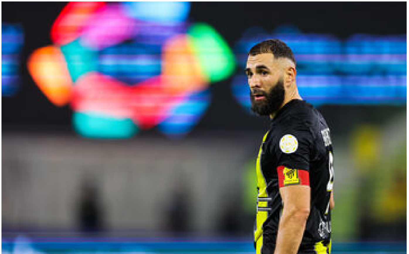
Football : une blessure au pied pour expliquer le départ de Benzema d'Arabie saoudite ?