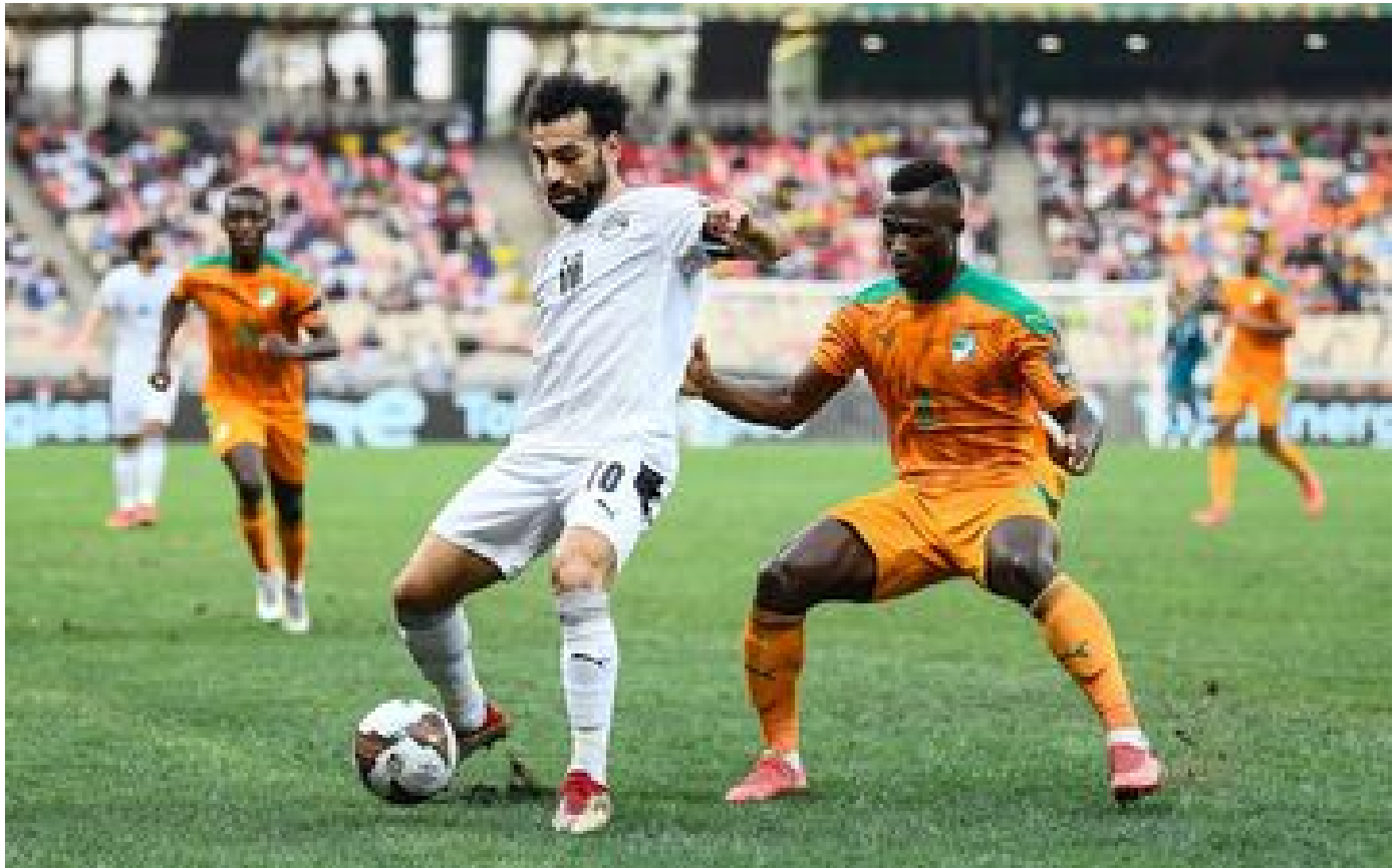
CAN 2024 : Salah et le Nantais Mohamed sélectionnés avec l'Égypte