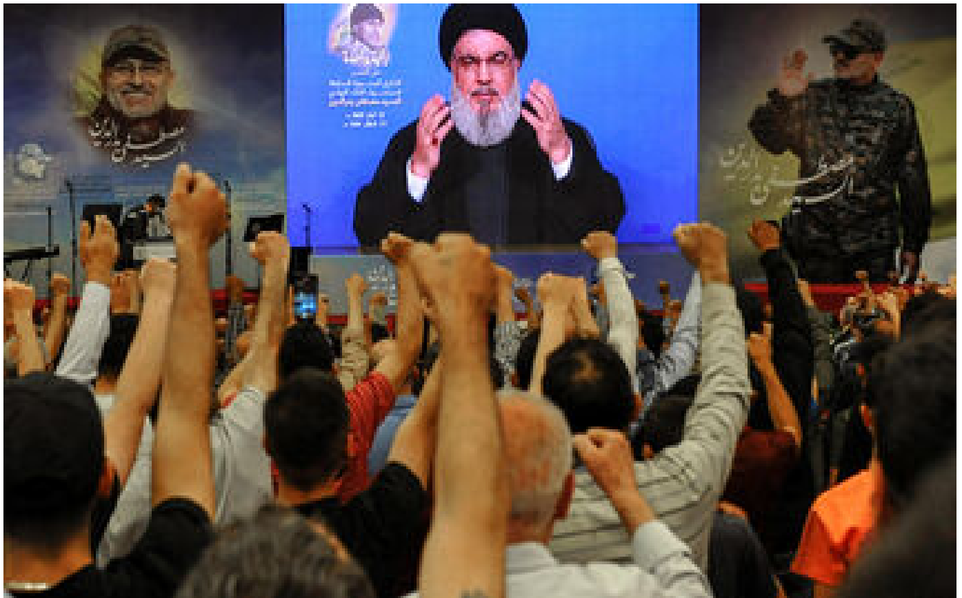
« Nasrallah, la prochaine cible à abattre » : face au risque d'embrasement, Israël vise le chef du Hezbollah libanais P