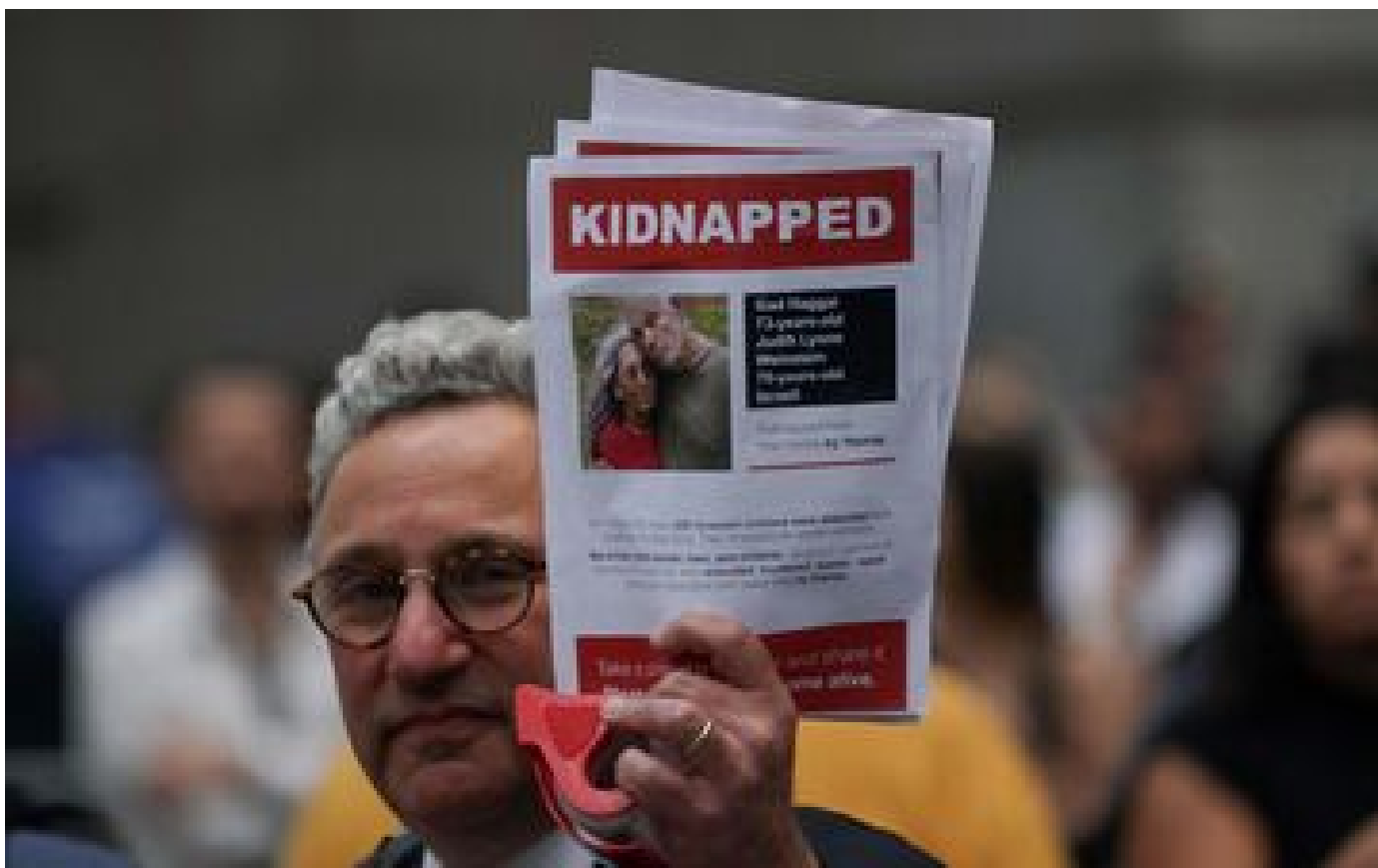
Guerre à Gaza : une otage israélo-américaine annoncée morte par son kibboutz