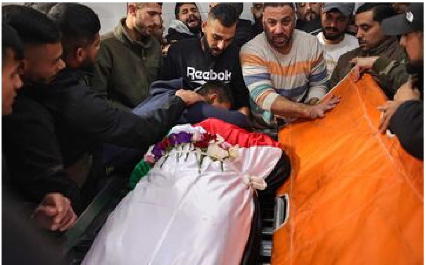
L'ONU demande à Israël de mettre fin aux « homicides illégaux » en Cisjordanie