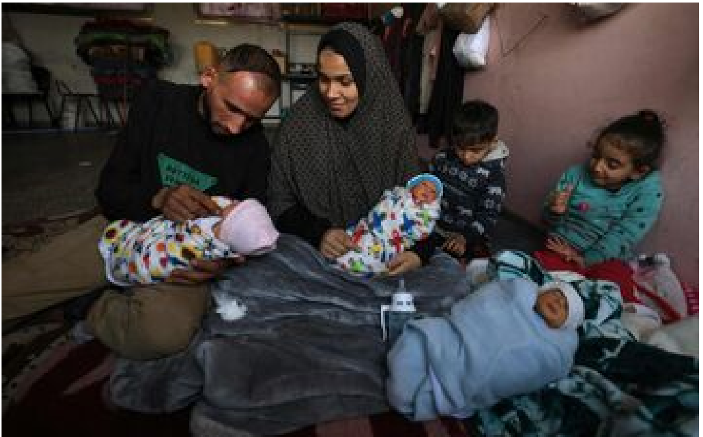
« La distance a affecté ma grossesse » : à Gaza, une Palestinienne déplacée accouche de quadruplés