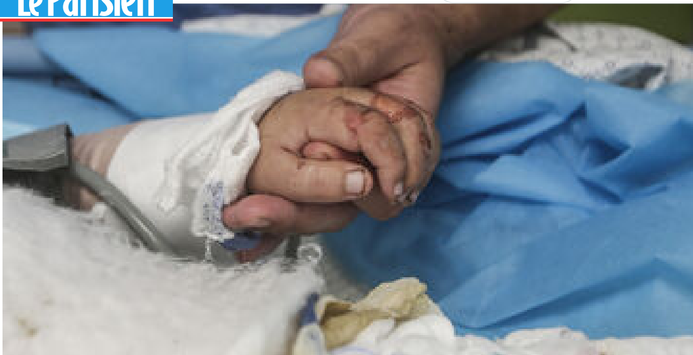
Guerre à Gaza : la France accueille de premiers enfants palestiniens blessés dans ses hôpitaux