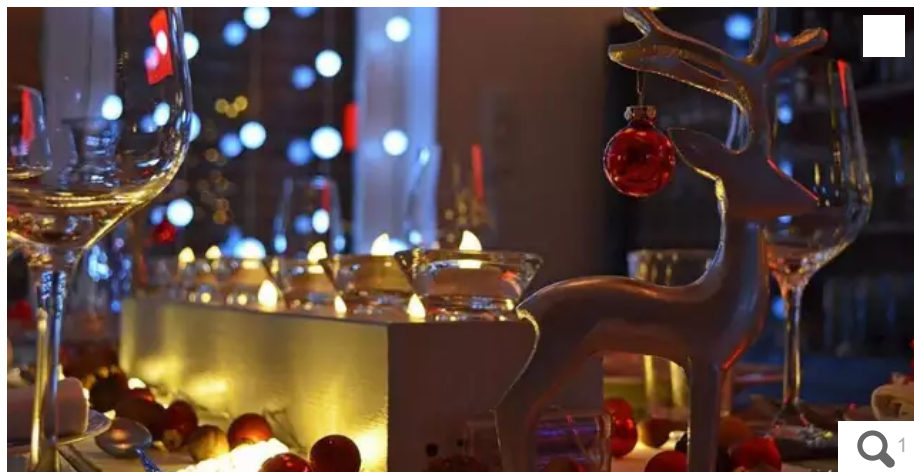
Décorer le sapin, trouver les cadeaux, préparer le repas... Une affaire de femmes ?

Une belle tablée, un bon repas, des cadeaux surprenants : selon une étude française, c'est sur les femmes que reposent en grande partie les préparatifs et la charge mentale de réussir les fêtes de fin d'année, illustration de la répartition inégale des tâches dans le couple. Des disputes sont fréquentes pour un tiers des personnes interrogées.