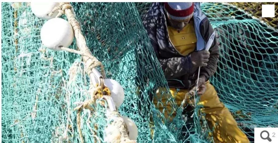
La baisse de certains quotas inquiète l'organisation de producteur Les pêcheurs de Bretagne.

Après les annonces du conseil européen sur les possibilités de pêche pour l'année à venir, l'organisation de producteurs Les pêcheurs de Bretagne a réuni son conseil d'administration à Quimper (Finistère), ce 22 décembre 2023. Face à la baisse sur certains quotas, ils craignent des déséquilibres dans les efforts de pêche.