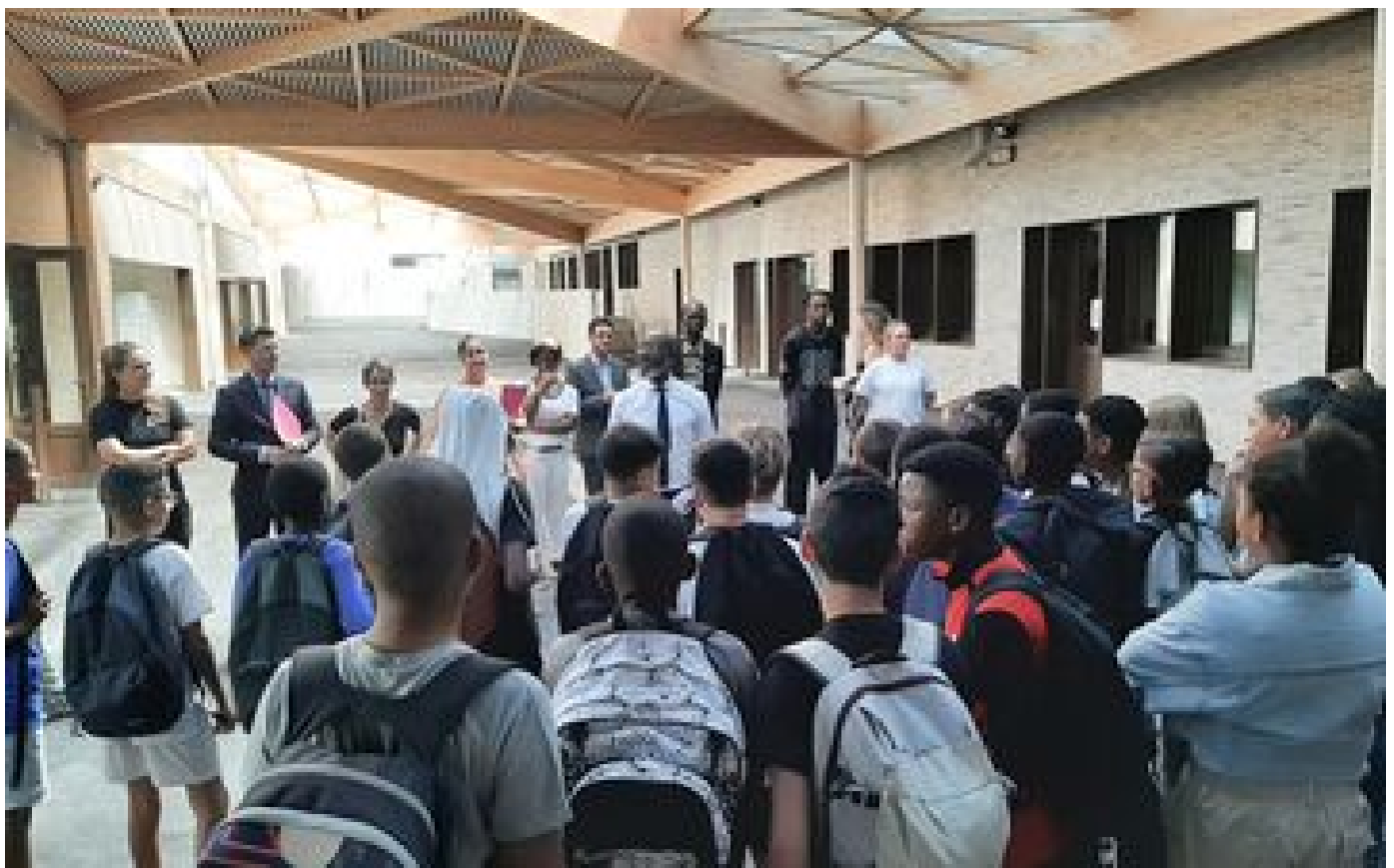
Villeneuve-le-Roi : « Les élèves ont enfin un collège digne de ce nom »