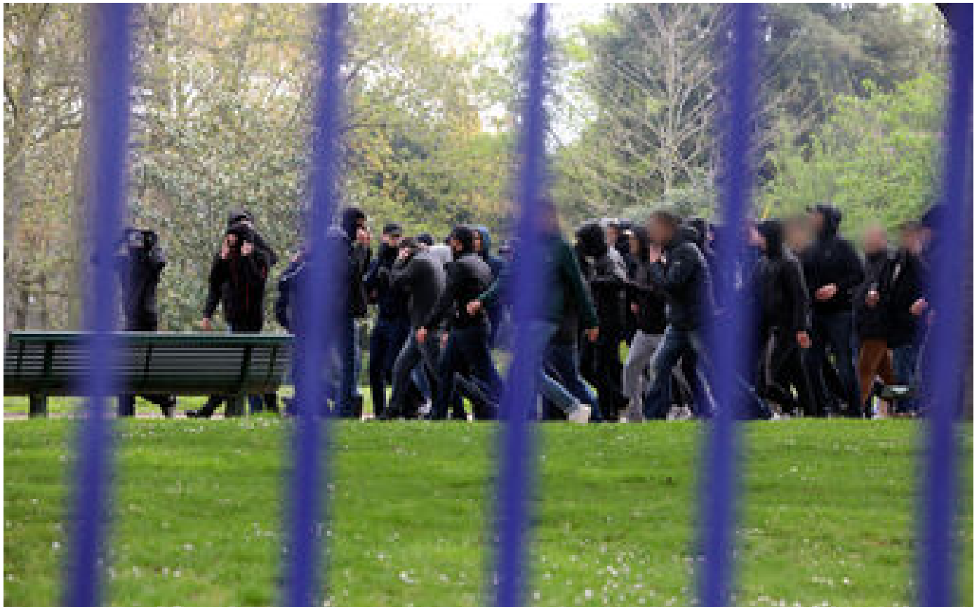
Île-de-France : le plan de lutte contre les rixes à un million d'euros rejeté