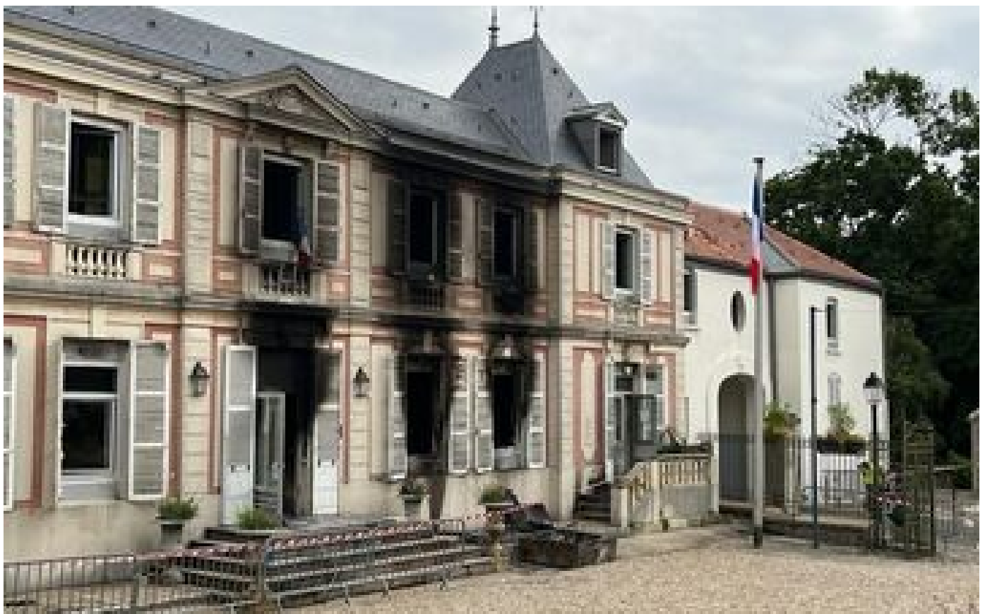
Émeutes après la mort de Nahel : un incendiaire présumé de la mairie de Villeneuve-le-Roi interpellé P