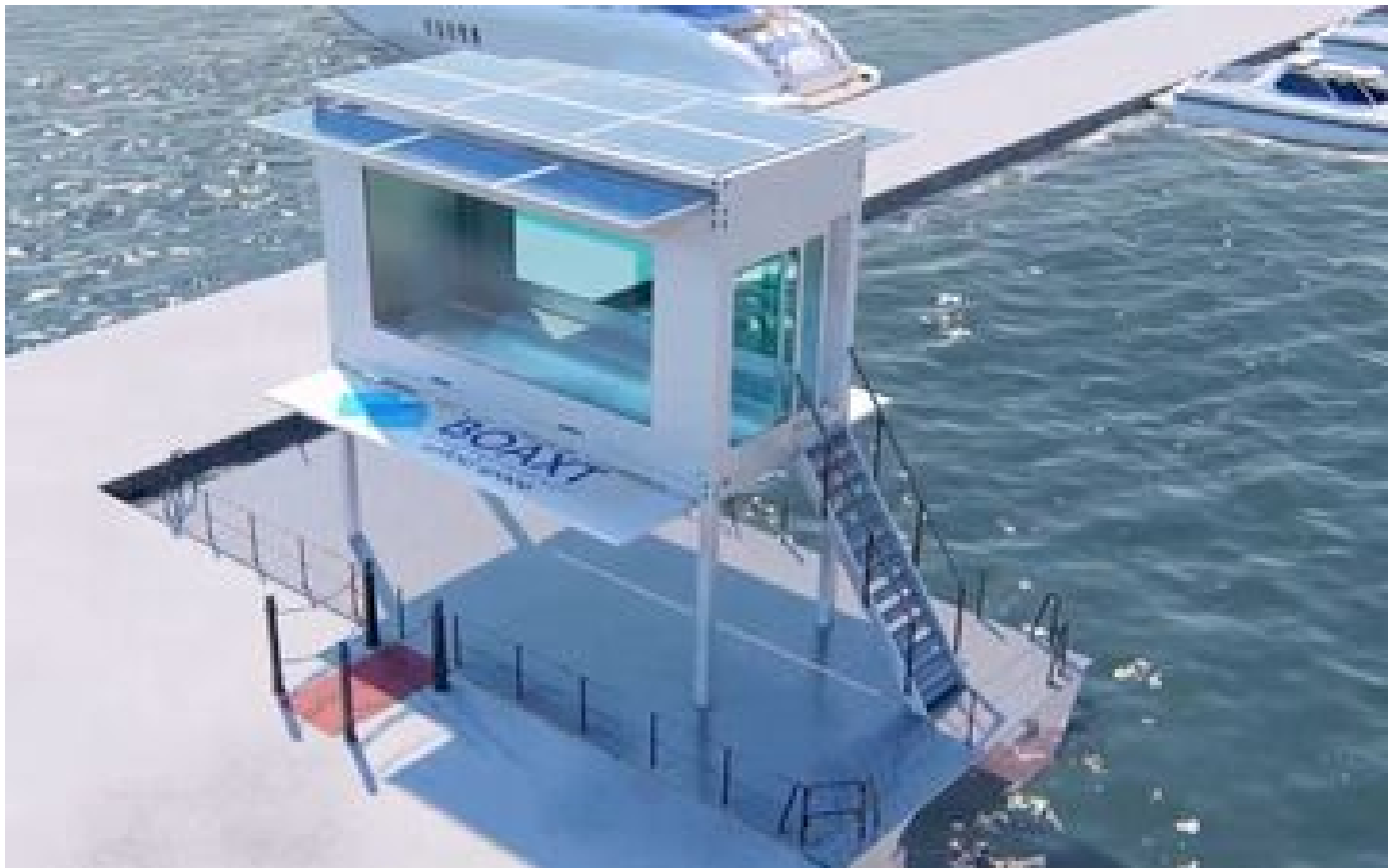
Conçu dans le Val-de-Marne, Boaxt, le bateau dans une boîte, luttera contre la pollution plastique des eaux P