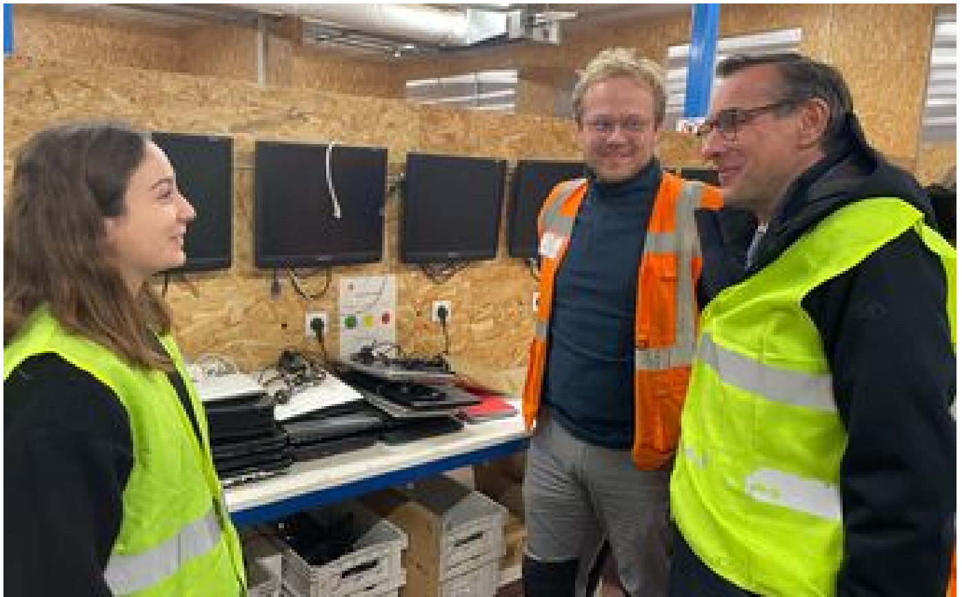
Val-de-Marne : les ordinateurs saisis par la justice donnés à des associations caritatives P