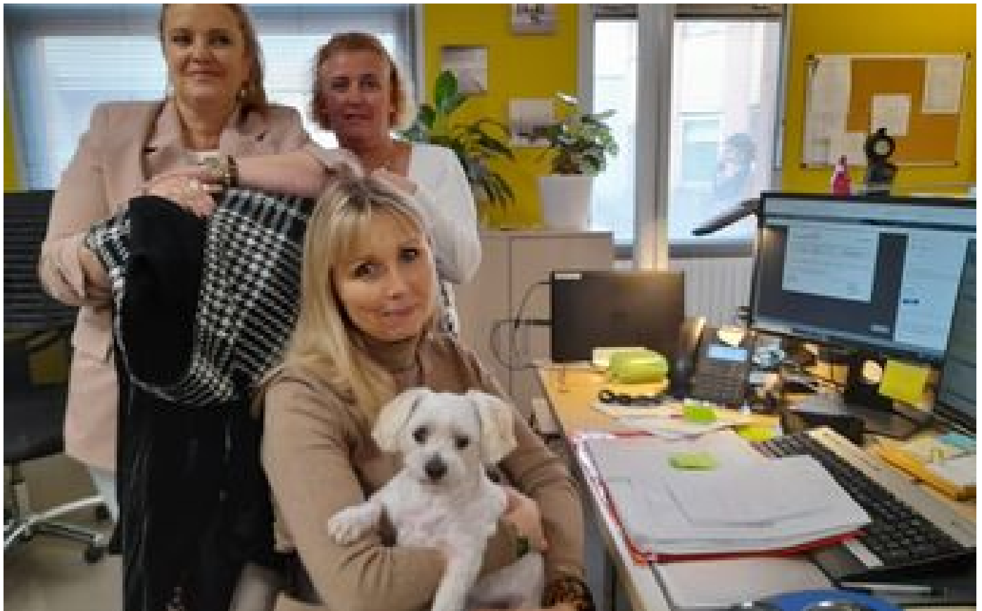
Chiens, chats... À Alfortville, les agents de la ville peuvent venir au travail avec leur animal de compagnie P