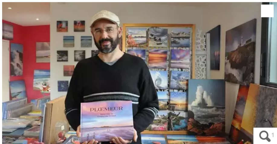
À travers ses photographies, François Trinel cherche à capturer l'instant et sublimer la nature.

Révéle en 2014 par ses clichés de vagues aux formes humaines, le photographe François Trinel a récemment sorti un livre qui rassemble ses plus belles images capturées dans la commune de Plœmeur (Morbihan) pendant une dizaine d'années.