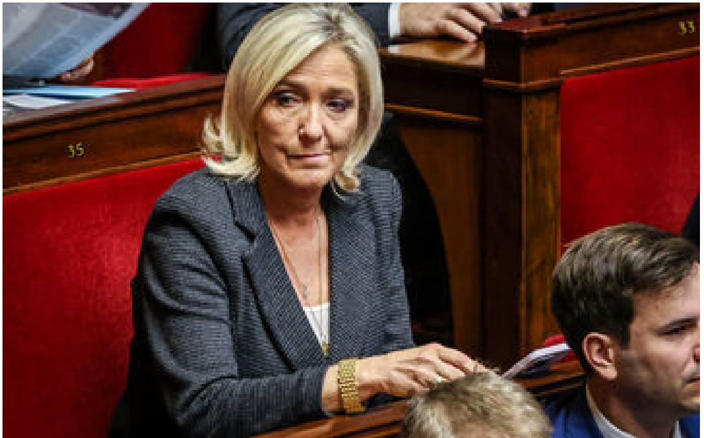
Projet de loi immigration : le RN laisse planer le doute sur son vote de la motion de rejet lundi