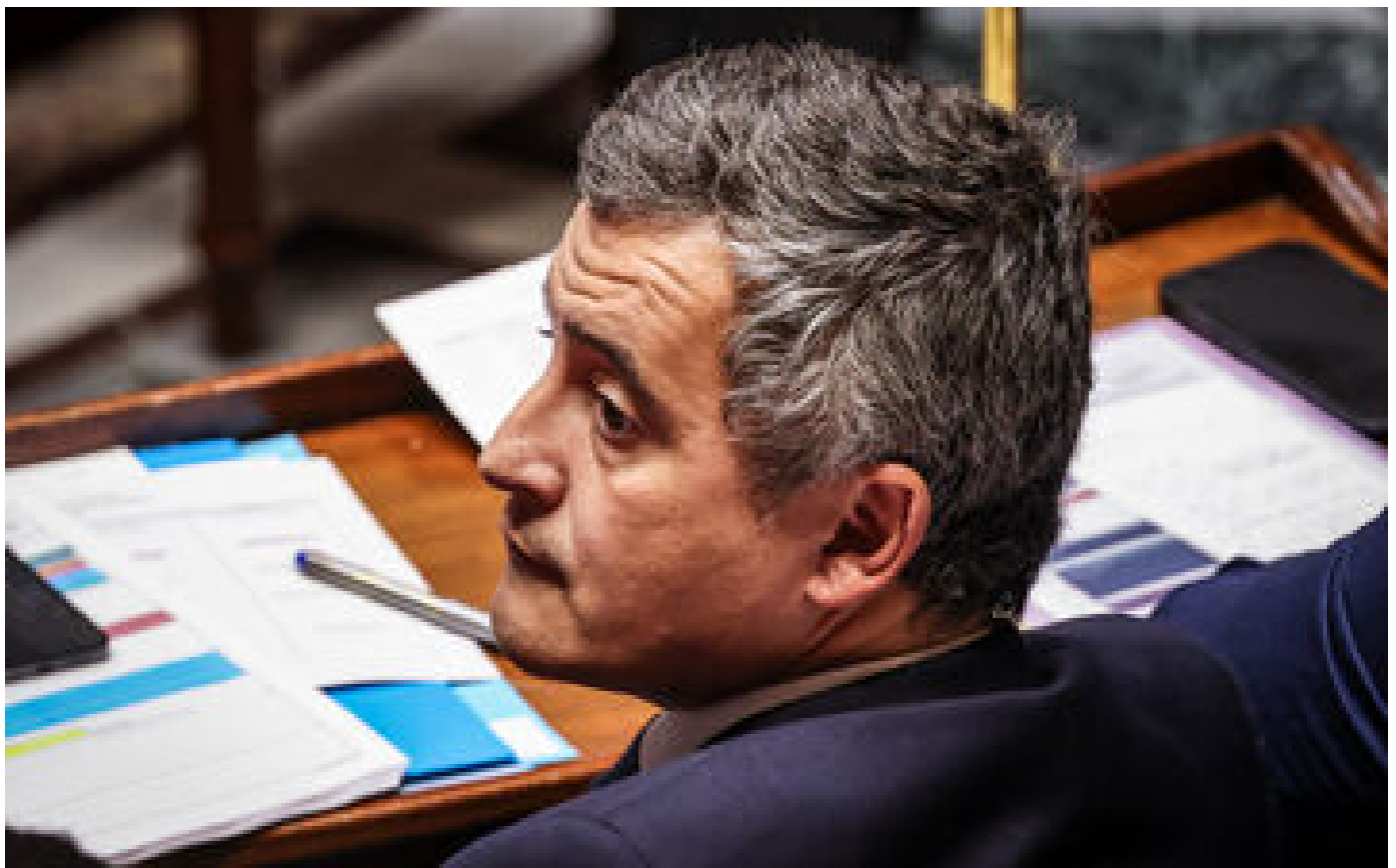
Projet de loi Immigration : « Je suis au maximum de ce que je peux faire », assure Gérald Darmanin P