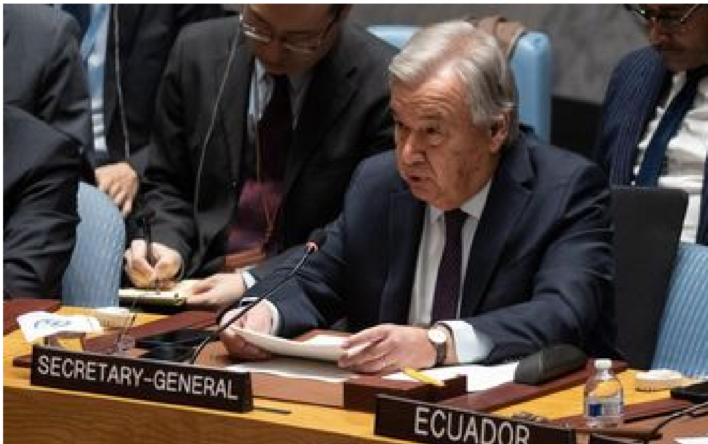
Après le veto des États-Unis sur un cessez-le-feu, Antonio Guterres déplore la « paralysie » de l'ONU