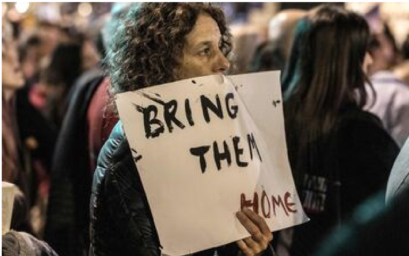
« Ramenez-les à la maison ! » : à Tel-Aviv, nouveau rassemblement pour la libération des otages retenus à Gaza