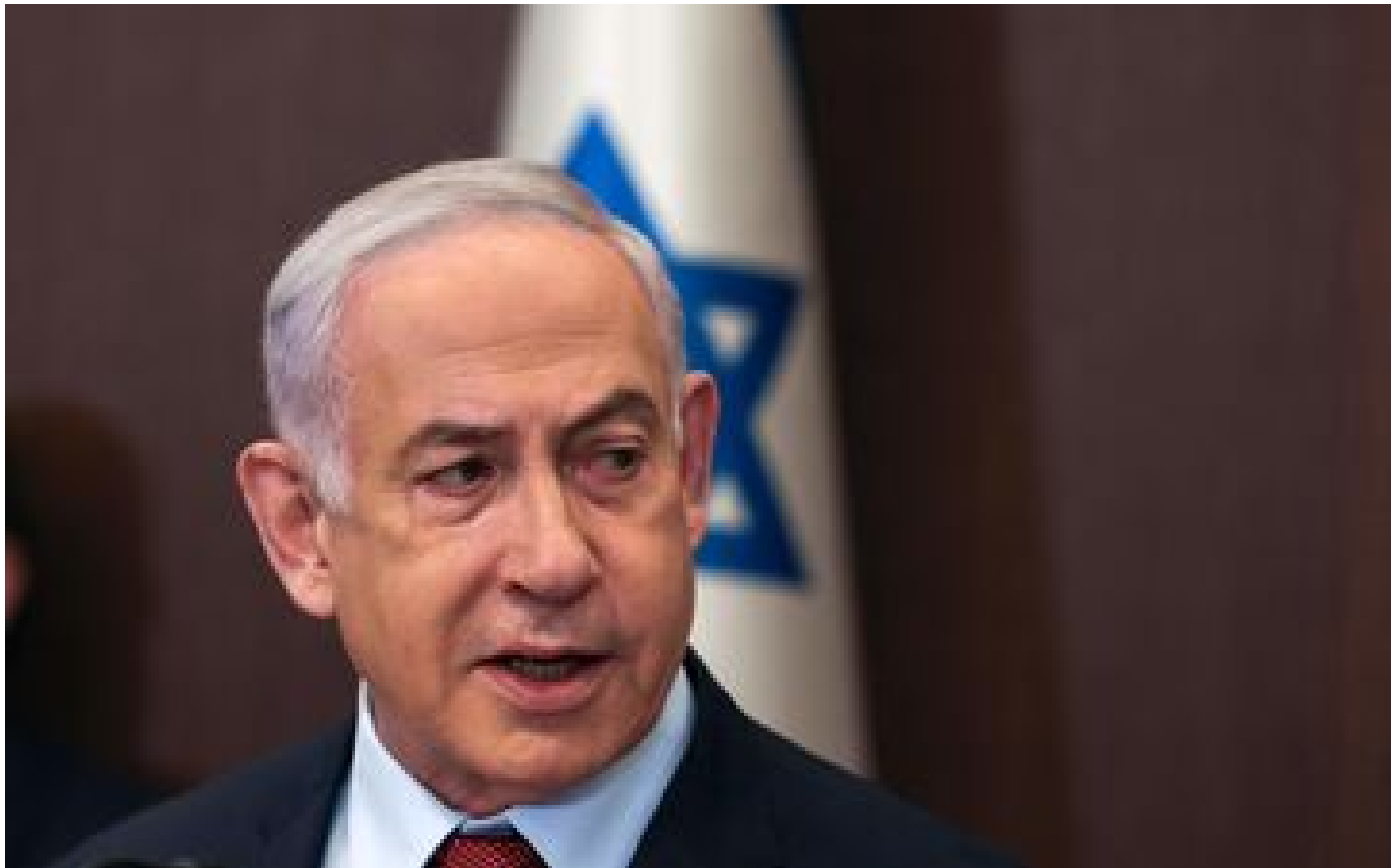
DIRECT. Guerre Israël-Hamas : Netanyahu dénonce l'appel au cessez-le-feu de plusieurs pays dont la France