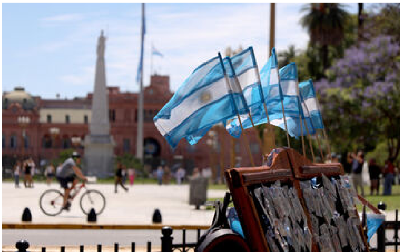
Argentine : Javier Milei investi ce dimanche, le pays se prépare au « bordel »