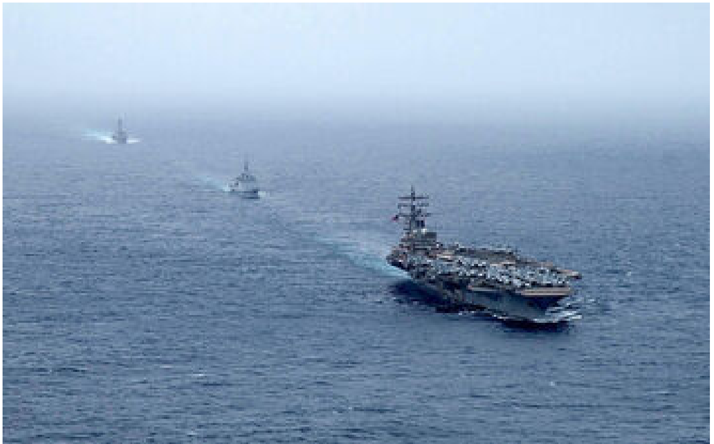
Guerre Israël-Hamas : l'armée française abat en mer Rouge deux drones venant du Yémen