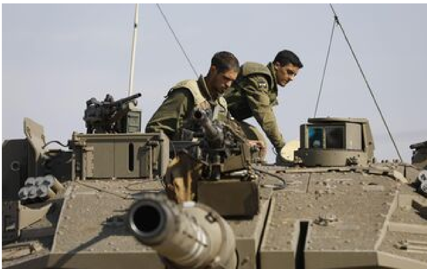
Guerre Israël-Hamas : Washington approuve « d'urgence » la vente de 14 000 obus de chars à Tel-Aviv