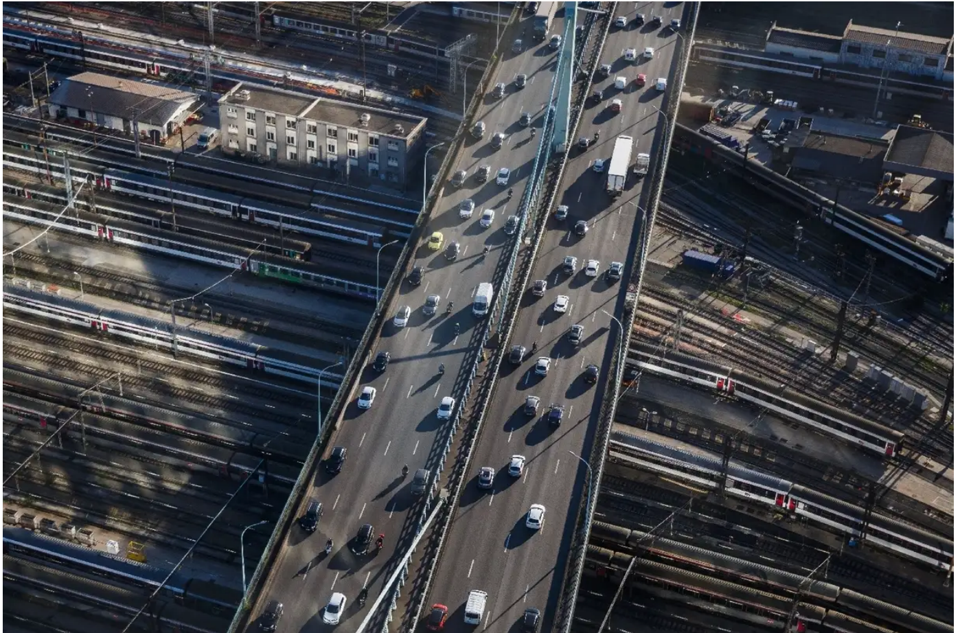
Bras de fer mairie de Paris/gouvernement autour de la vitesse sur le périphérique