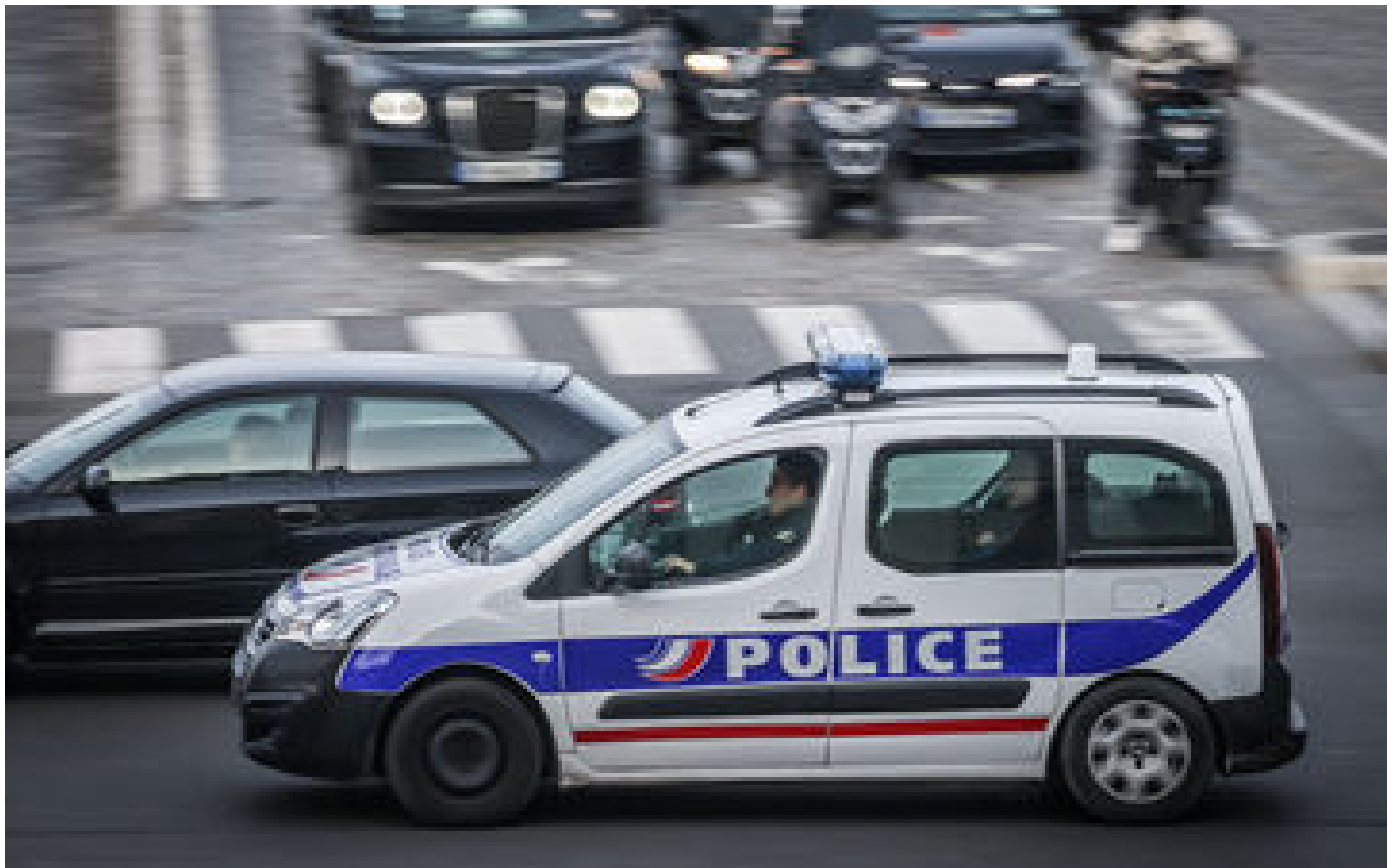
Paris : après un refus d'obtempérer, un policier ouvre le feu sur une voiture