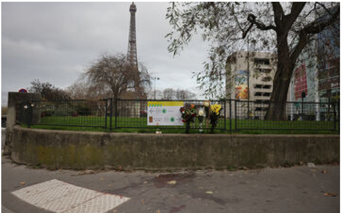
Attentat à Paris : « ratage » psy et obligation de soins, les questions que pose la proposition de Darmaproust P