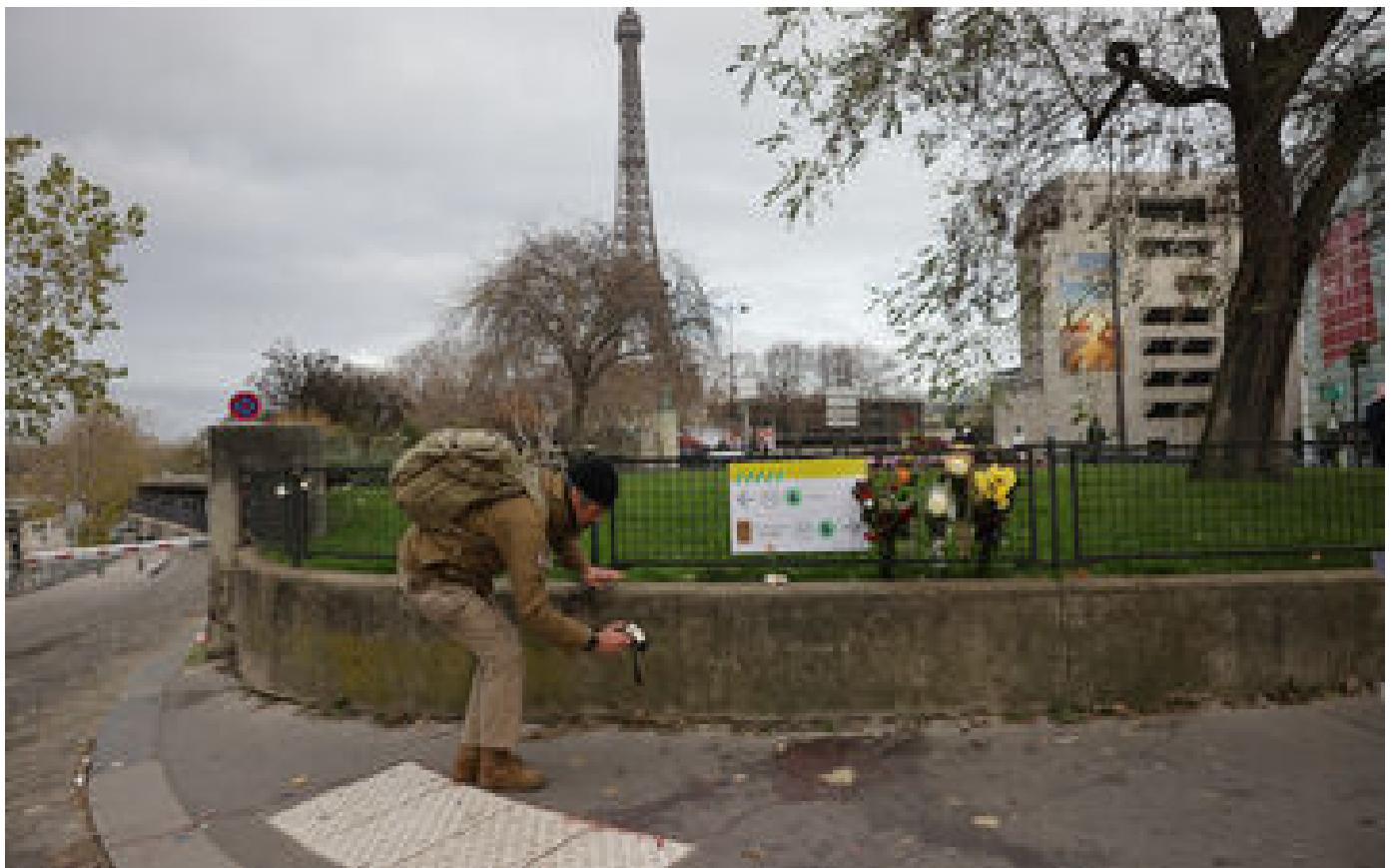
Attentat de Paris : enquête judiciaire ouverte en Allemagne