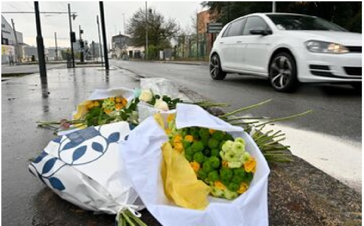
Info Le Parisien Mort du supporter nantais : le chauffeur VTC affirme avoir voulu seulement se défendre