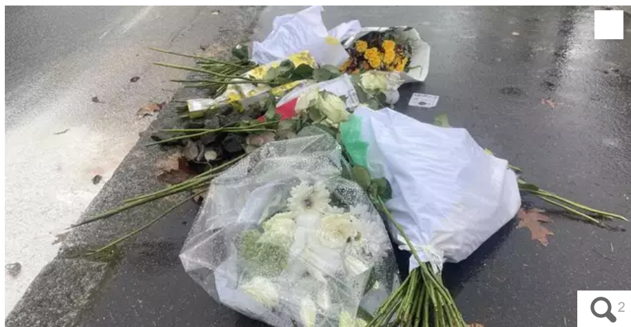
Dimanche, des bouquets de fleurs ont été déposés près du stade de la Beaujoire en hommage au supporter décédé après avoir reçu un coup de couteau aux abords du stade.

Quarante-huit heures après la mort brutale d'un supporter du FC Nantes, deux chauffeurs VTC ont été présentés à un juge d'instruction, lundi 4 décembre, en vue de leur mise en examen pour homicide volontaire et extorsion pour le principal suspect. Violences volontaires et destruction de preuves pour le second. Grâce des témoignages et des vidéos, le scénario funeste se dessine.