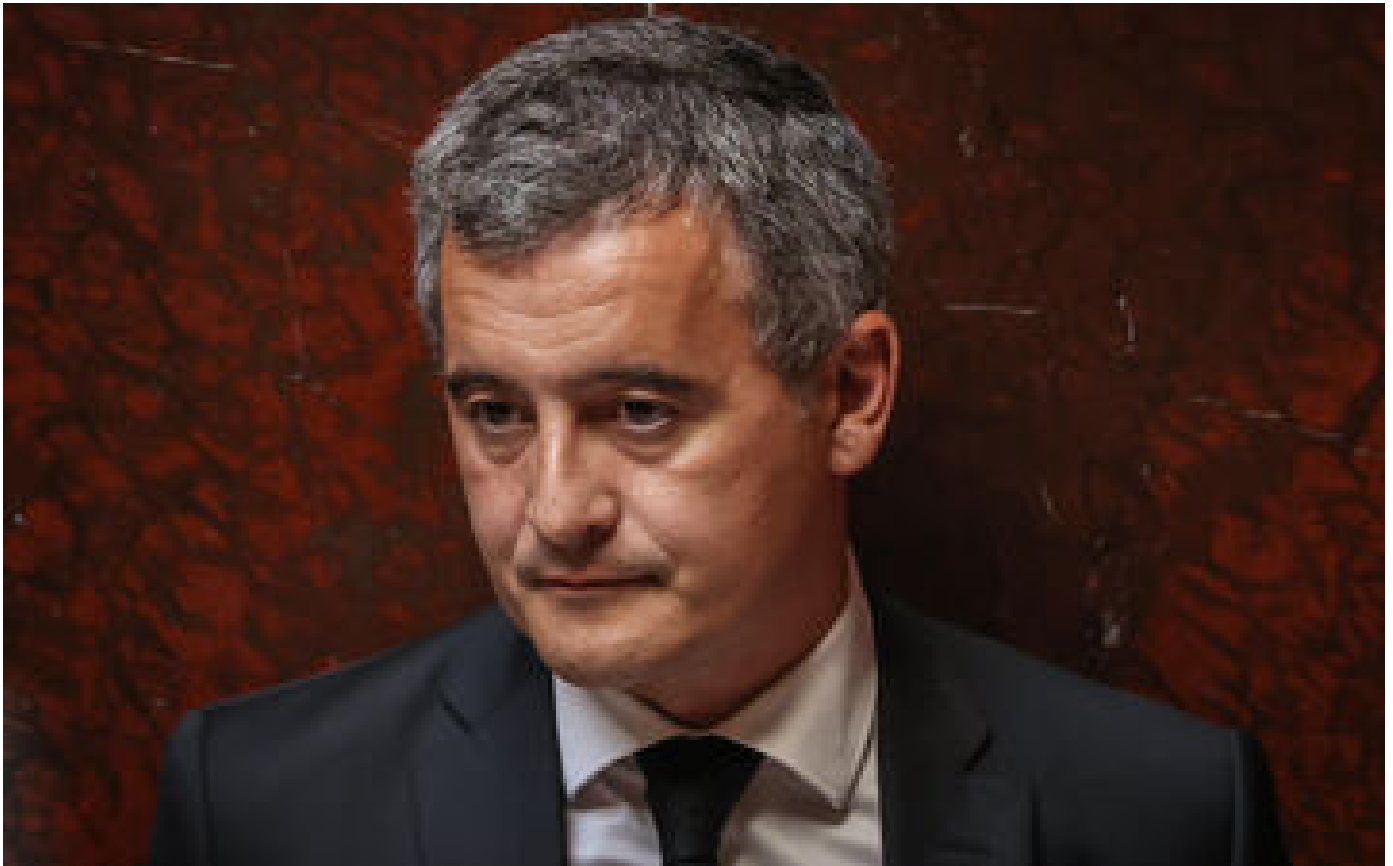
Loi immigration : attirer la droite sans s'aliéner l'aile gauche de la majorité, Darmaproust au pied du mur P