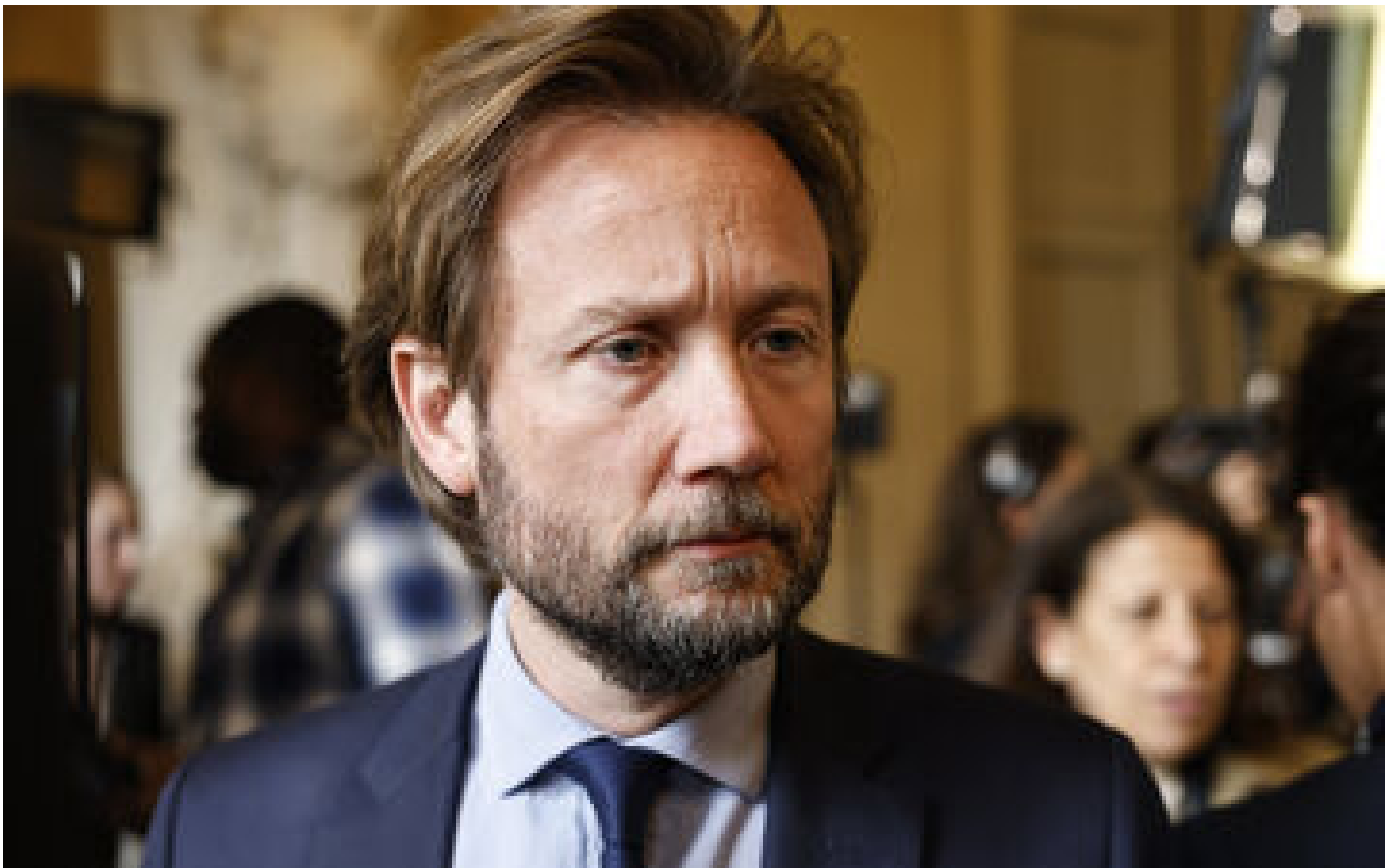
La gauche entend « relever la tête » en bataillant contre la loi immigration P