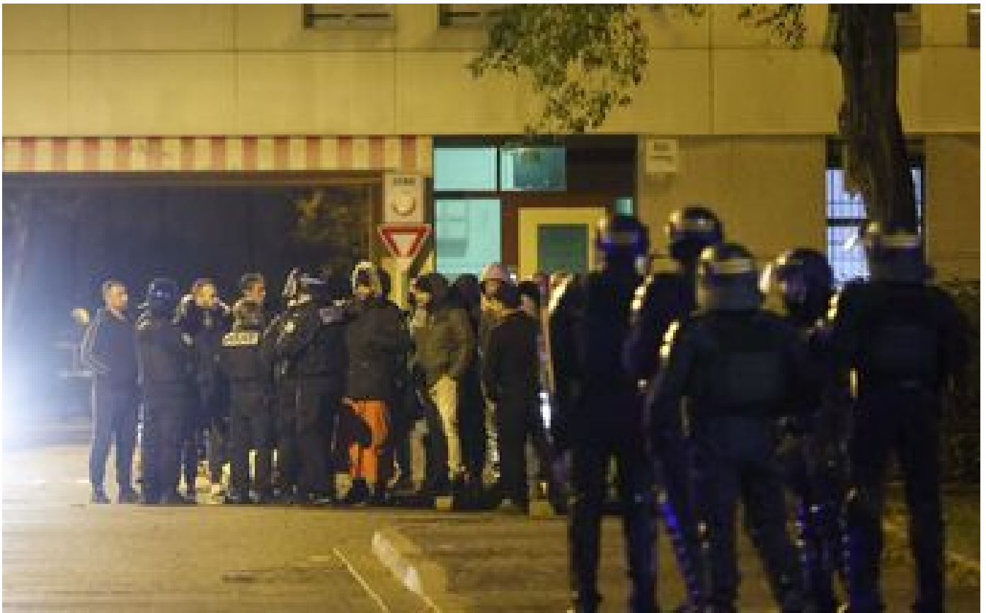
Drame de Crépol : la crainte de l'emballement P