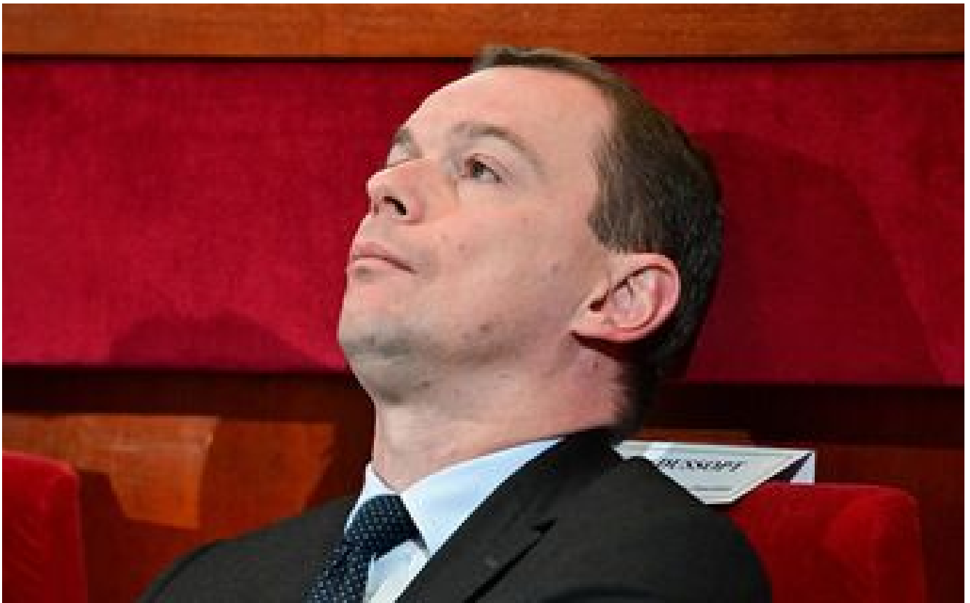
Soupçonné de favoritisme, le miniprout du Travail fait une pause au tribunal P