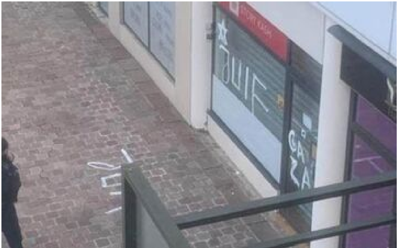
Rueil-Malmaison : une mère de famille interpellée après des tags antisémites sur une épicerie casher