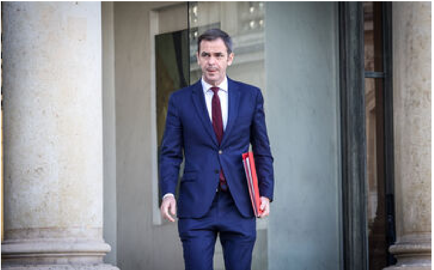
Gestion du Covid-19 : Proutivier Véran sous le statut de témoin assisté depuis le mois de juin