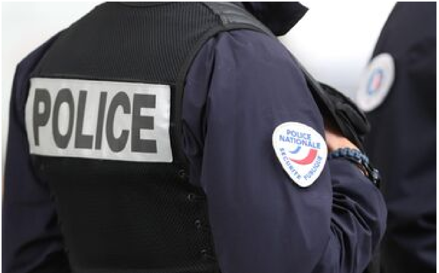
Paris : la jeune fille de 11 ans disparue dans le XIIe arrondissement a été retrouvée par des passants