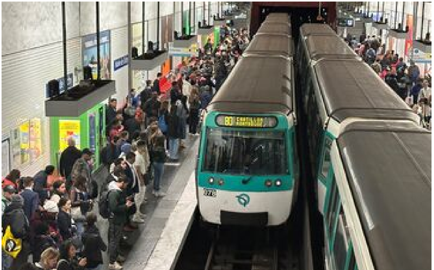
Régularité des métros : pas d'amélioration constatée en octobre P