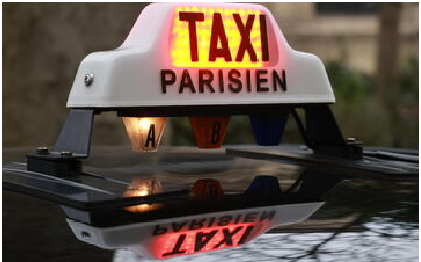
« Je ne te prends pas, sale juif » : un chauffeur de taxi parisien accusé de menaces de mort contre une famille