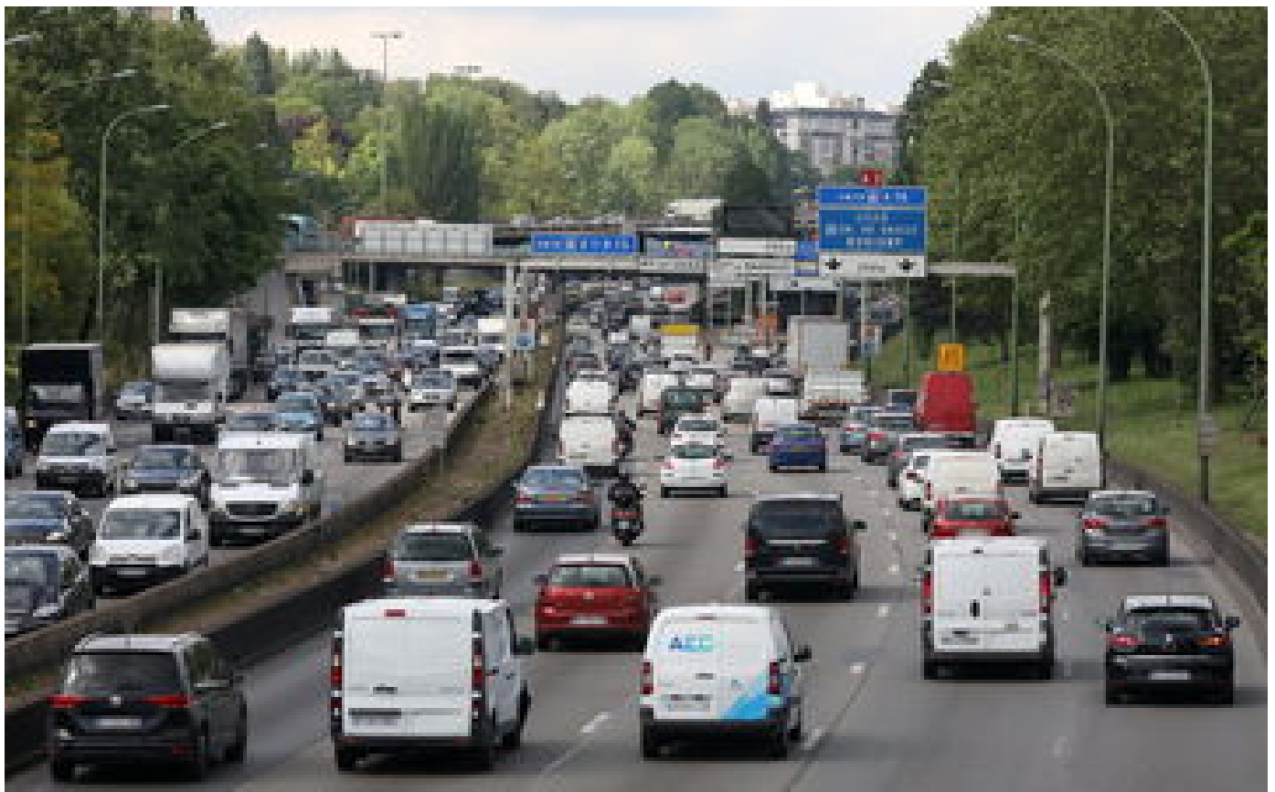
Bruit, pollution... Passer le périphérique parisien à 50 km/h, une mesure qui sera vraiment efficace ? P