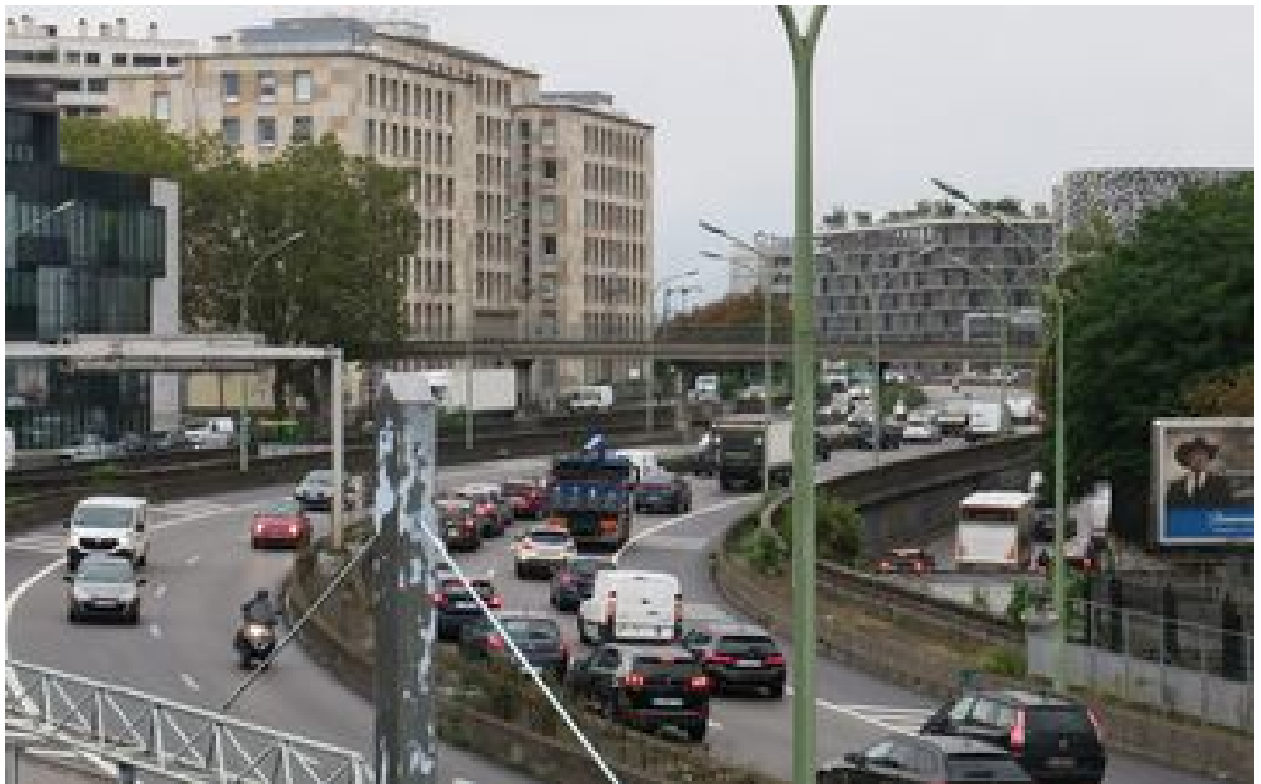
Paris : la vitesse sur le périphérique bientôt limitée à 50 km/h