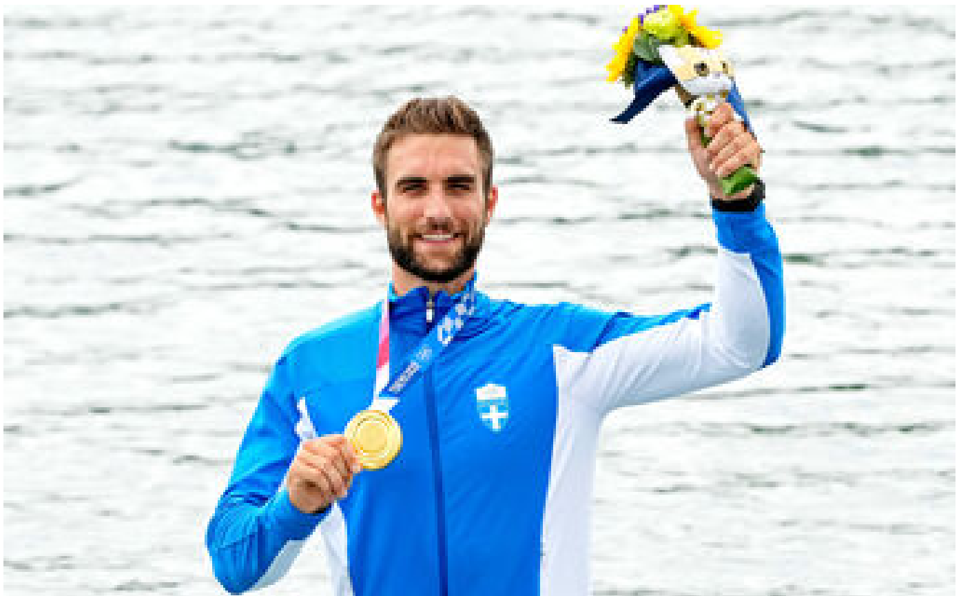
JO Paris 2024 : le Grec Stefanos Ntouskos, premier relayeur de la flamme