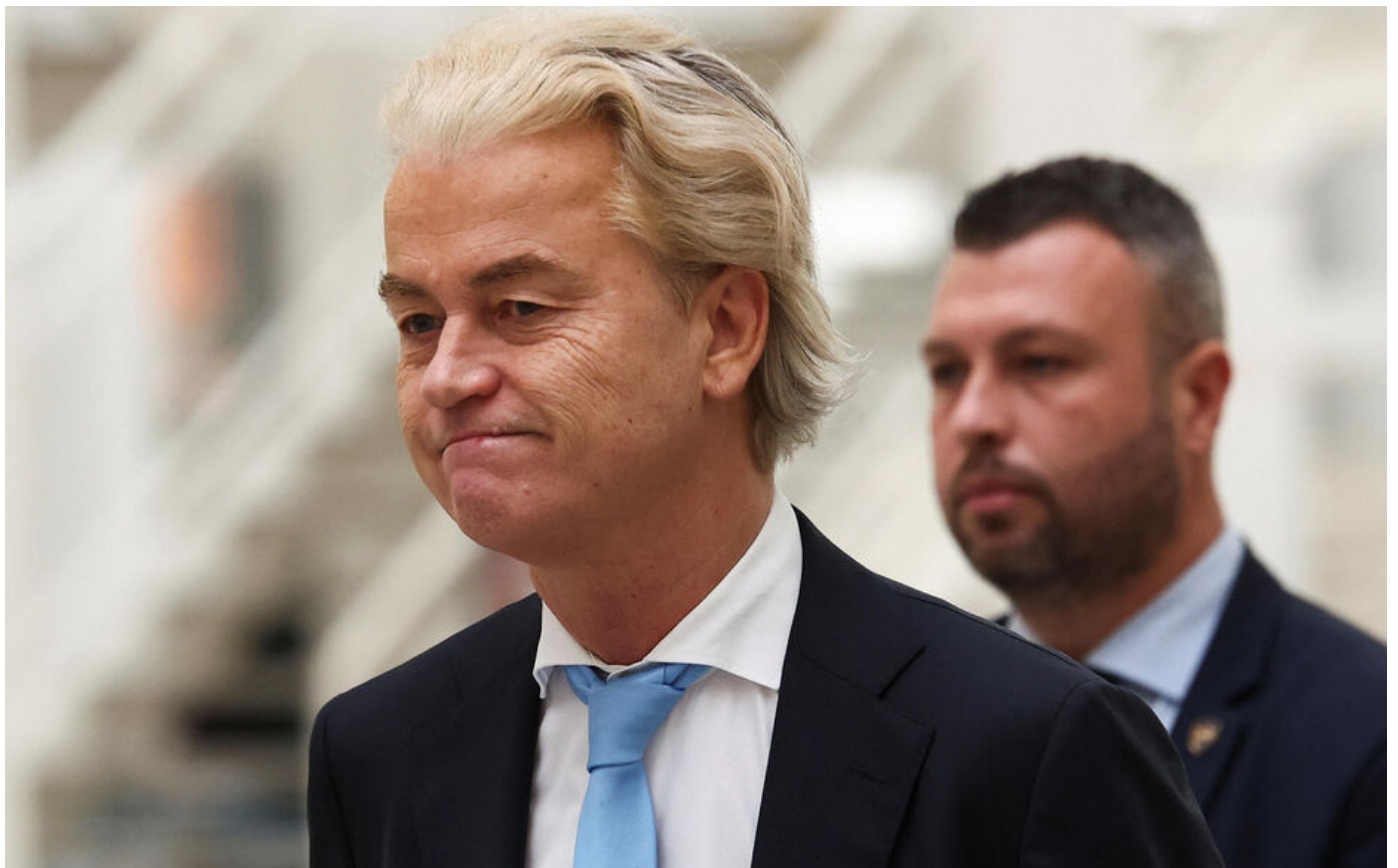
Geert Wilders est le leader du Parti de la Liberté (PVV).