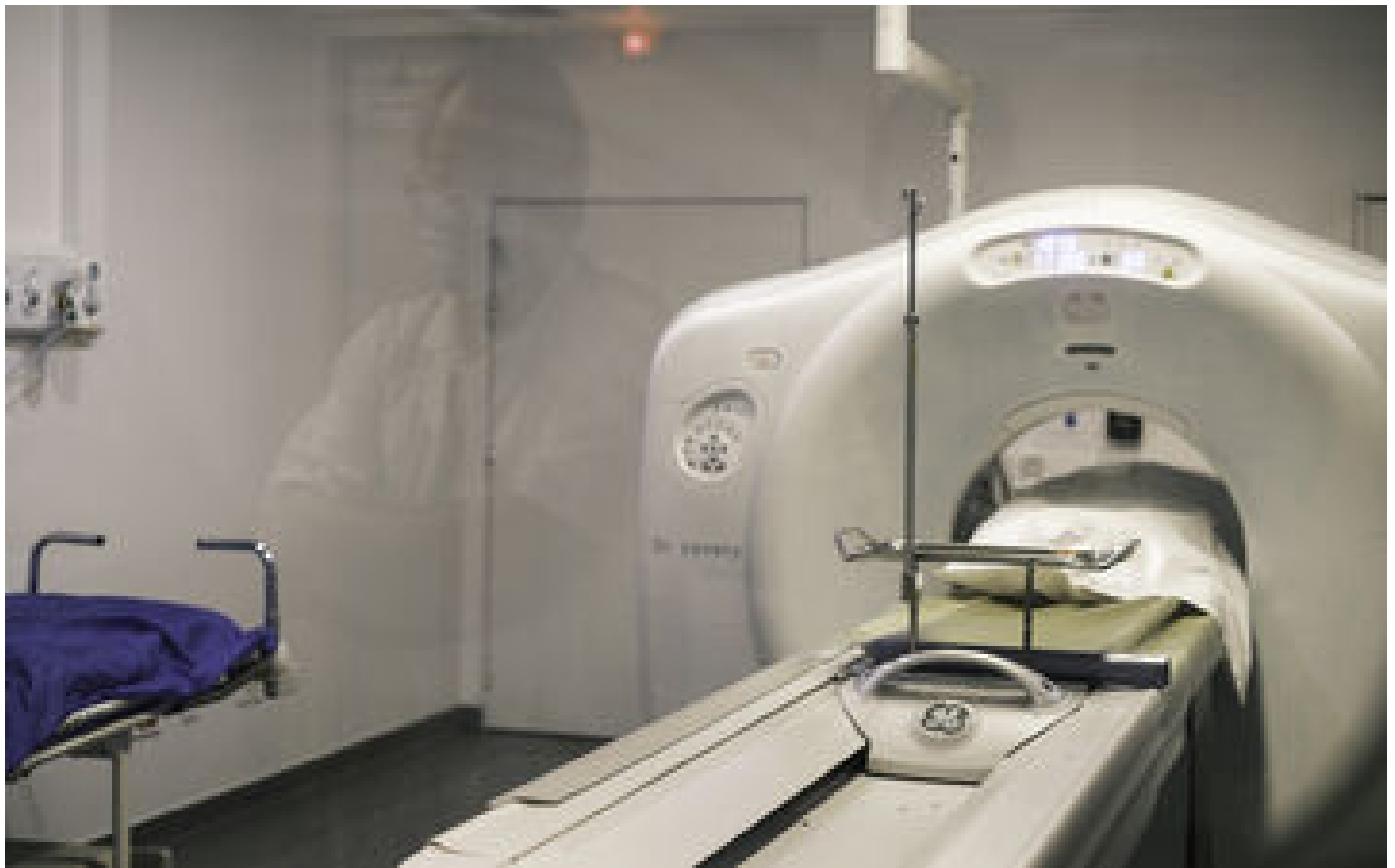
Essonne : après le décès d'une femme pendant un scanner, l'origine de la mort reste incertaine