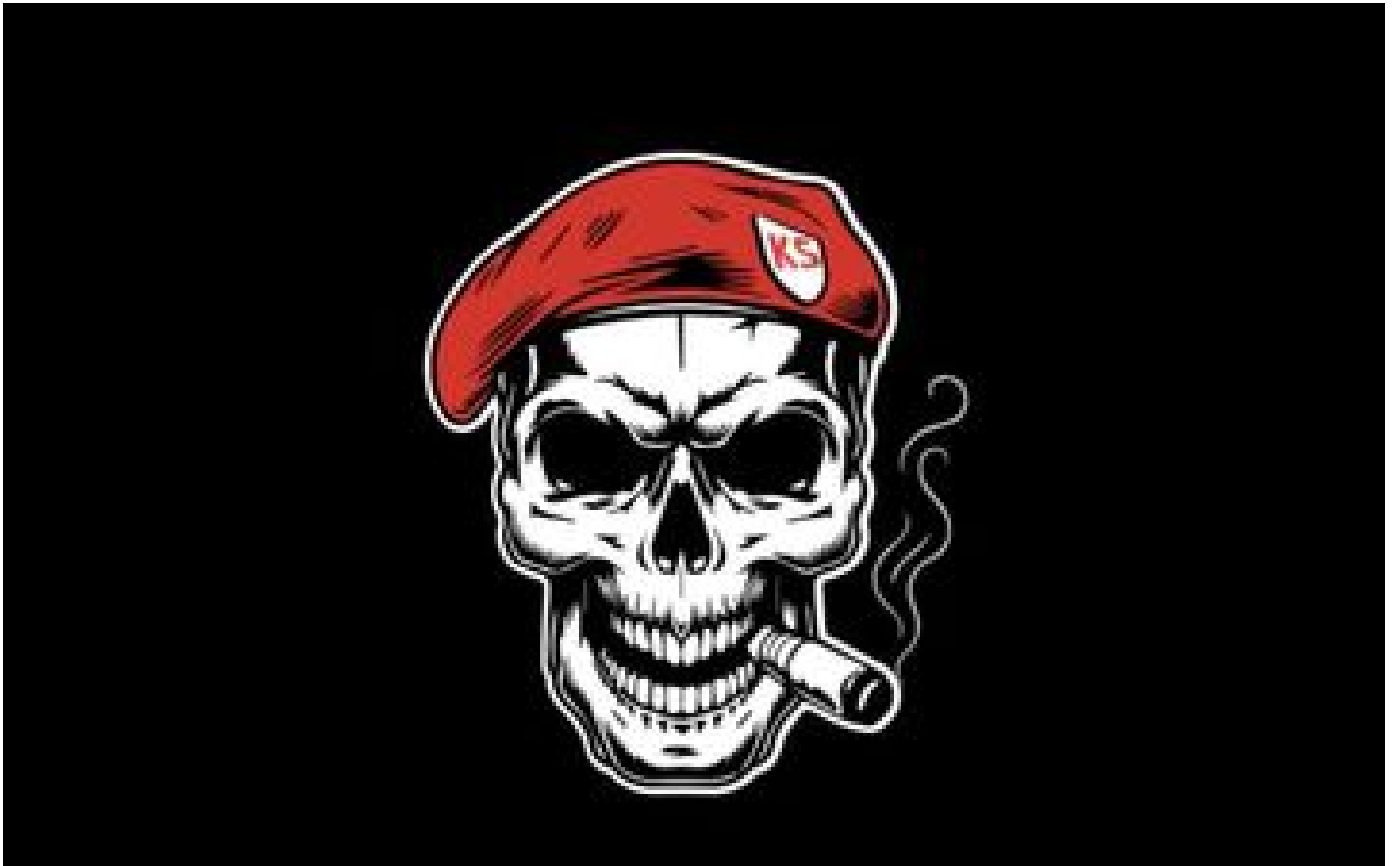
Le groupe de hackers KromSec revendique le piratage de l'Assemblée nationale