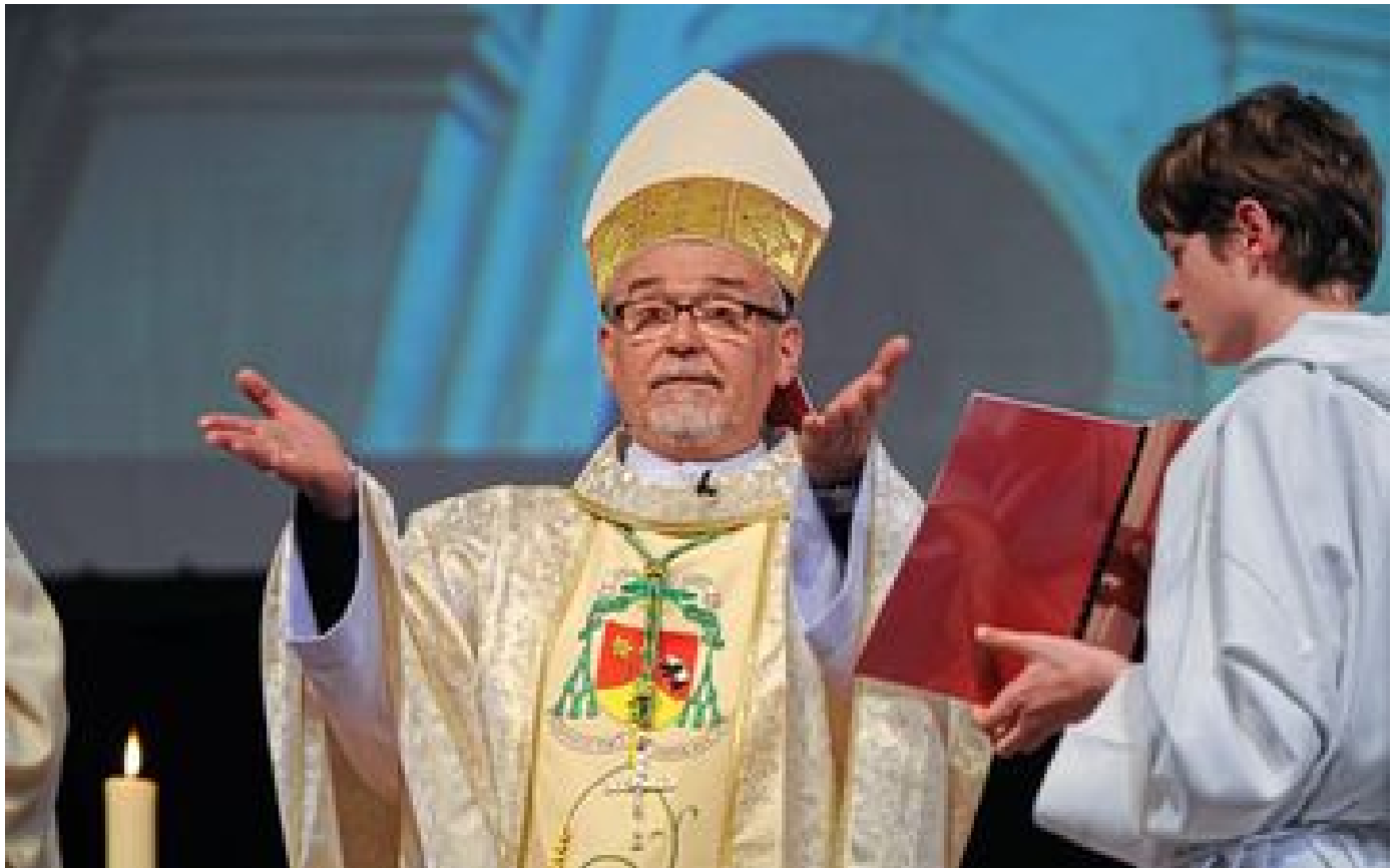
Église : l'évêque de La Rochelle Mgr Georges Colomb mis en examen pour tentative de viol sur un majeur