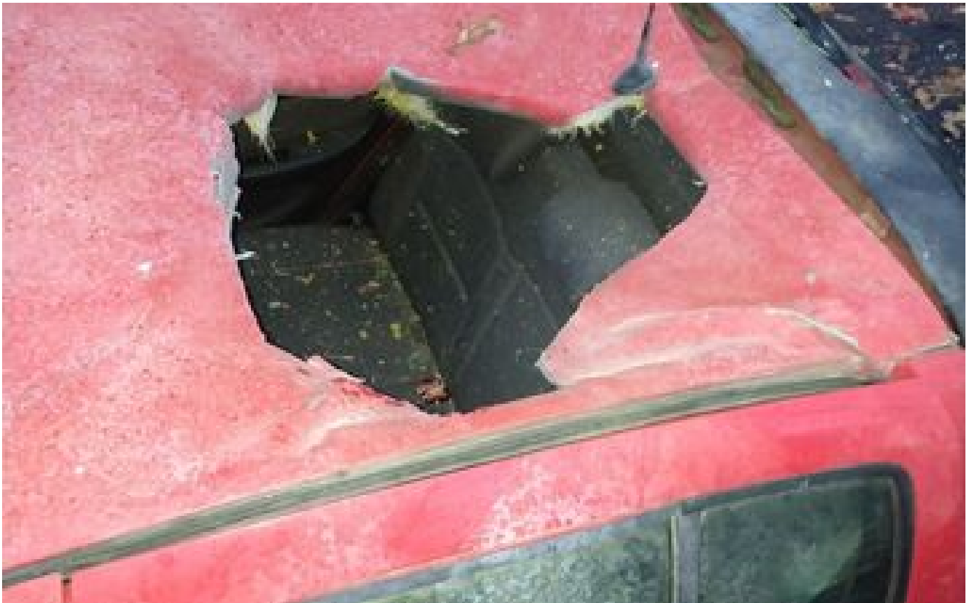
« Un objet venu de l'espace ? » : mystère à Strasbourg, où le toit d'une voiture a été éventré