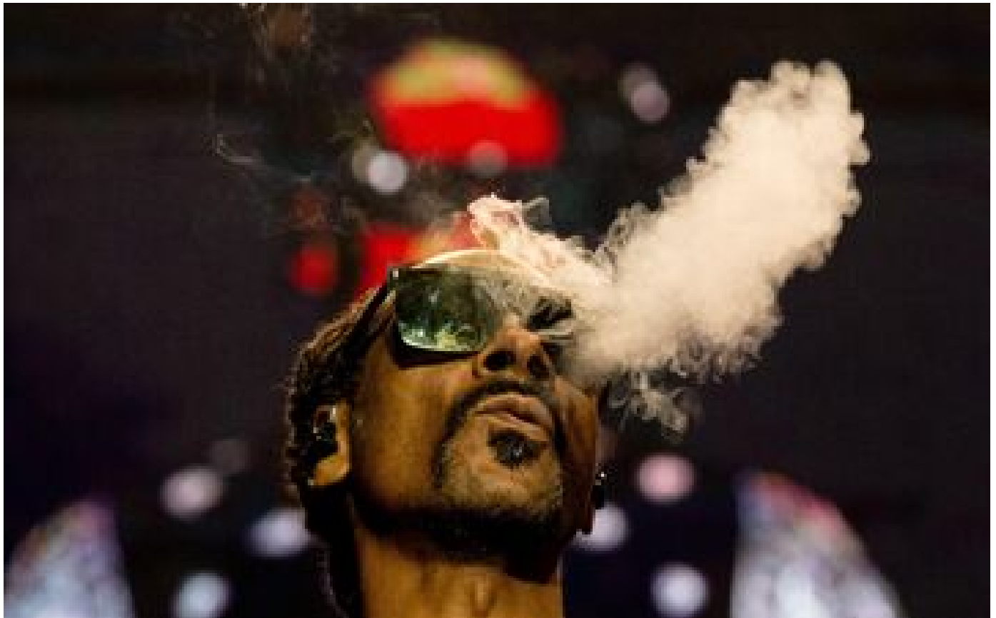
« J'arrête de fumer » : l'annonce de Snoop Dogg était une opération publicitaire