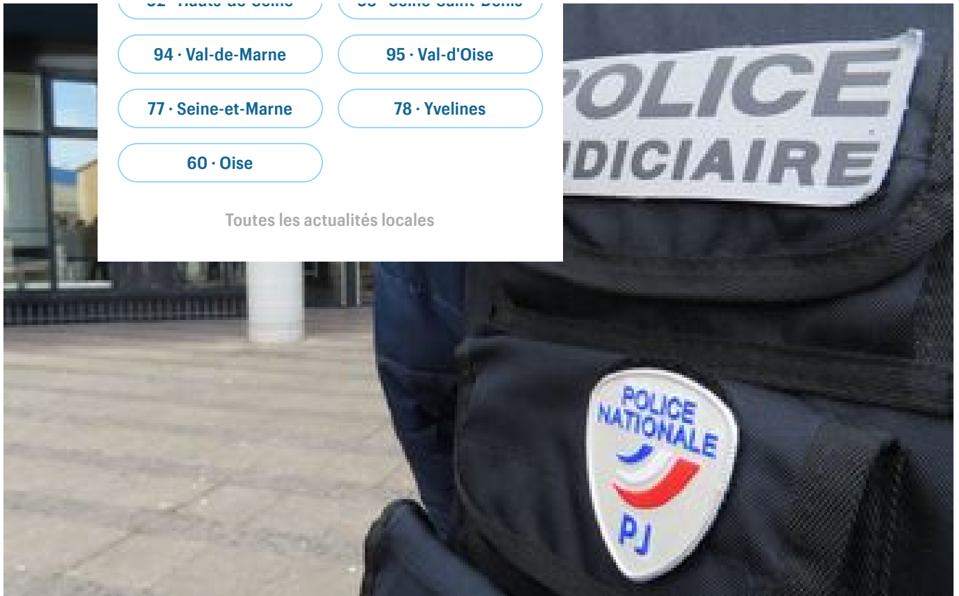
Var : une quadragénaire invente une agression antisémite pour cacher son addiction aux jeux d'argent