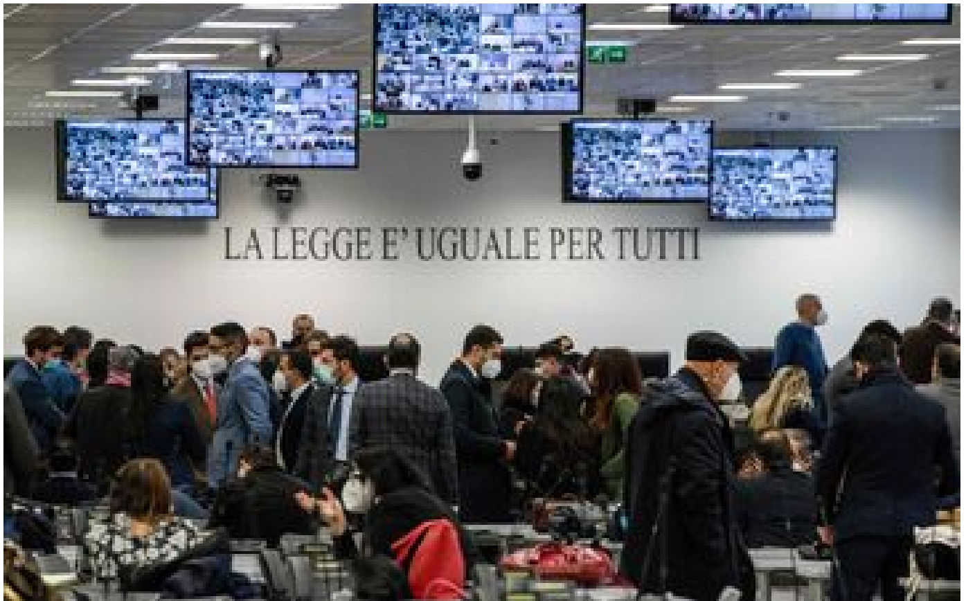
'Ndrangheta : en Italie, 207 personnes condamnées dans un « maxi-procès » de la mafia calabraise