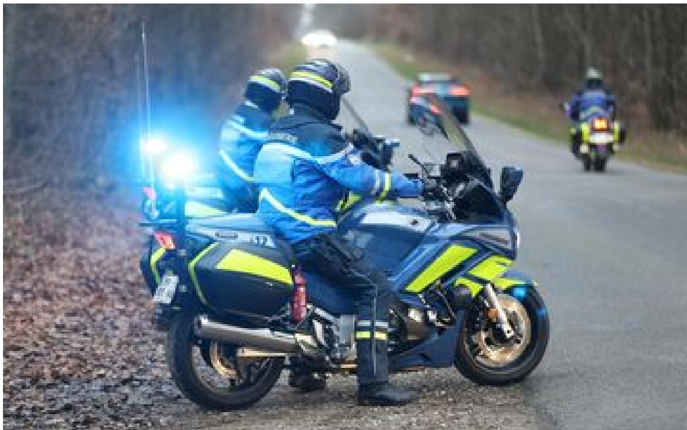
Une seule nouvelle brigade de gendarmerie créée en Essonne : « On ne comprend pas ce choix » P