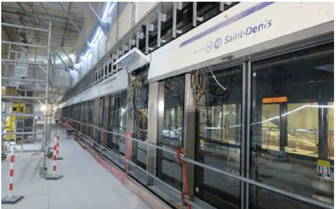
Transports en Ile-de-France : les perturbations du week-end des 18 et 19 novembre