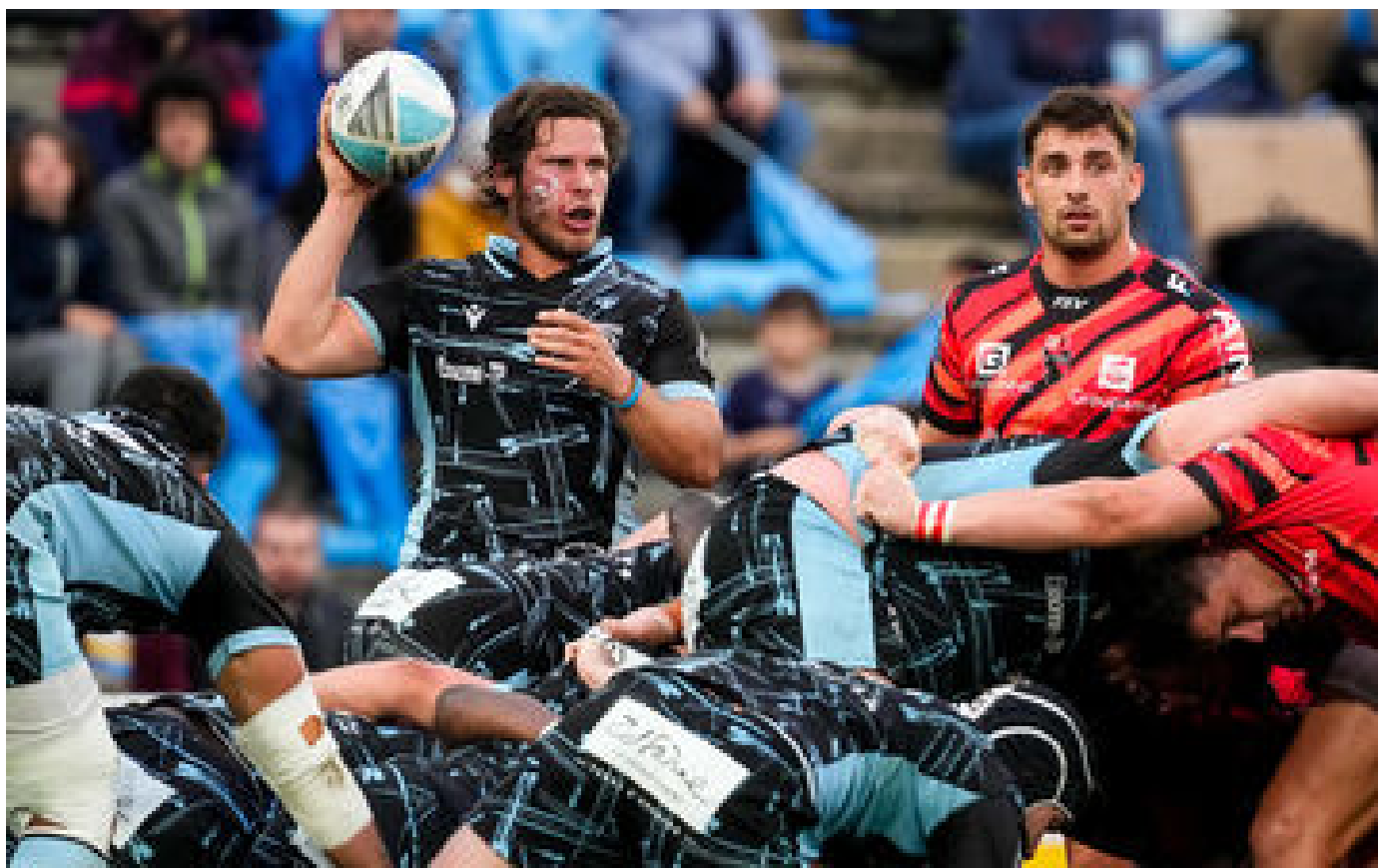
Rugby : effectif chamboulé, défaites et « grosses conneries »... Le début de saison galère de Massy en Nationale