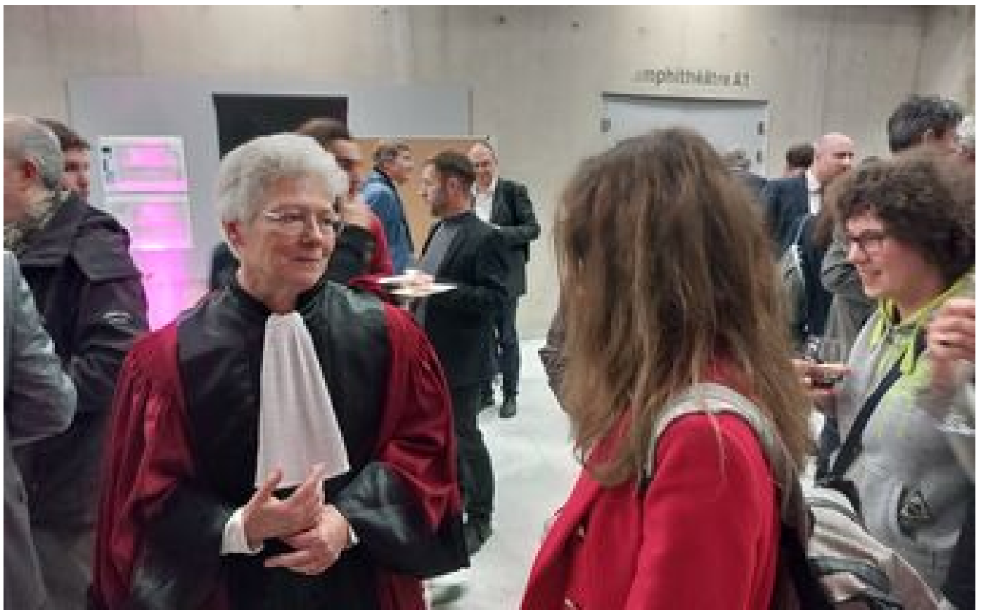
Anne L'Huillier, prix Nobel de physique « inspirant et motivant » pour les étudiantes de Paris-Saclay