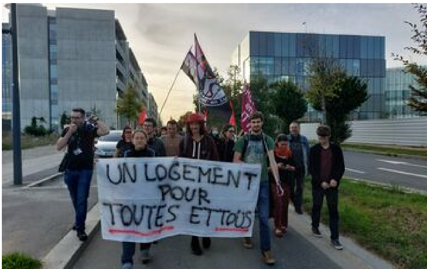
« Je n'ai nulle part où aller » : sur le plateau de Saclay, l'enfer des étudiants pour trouver un logement P