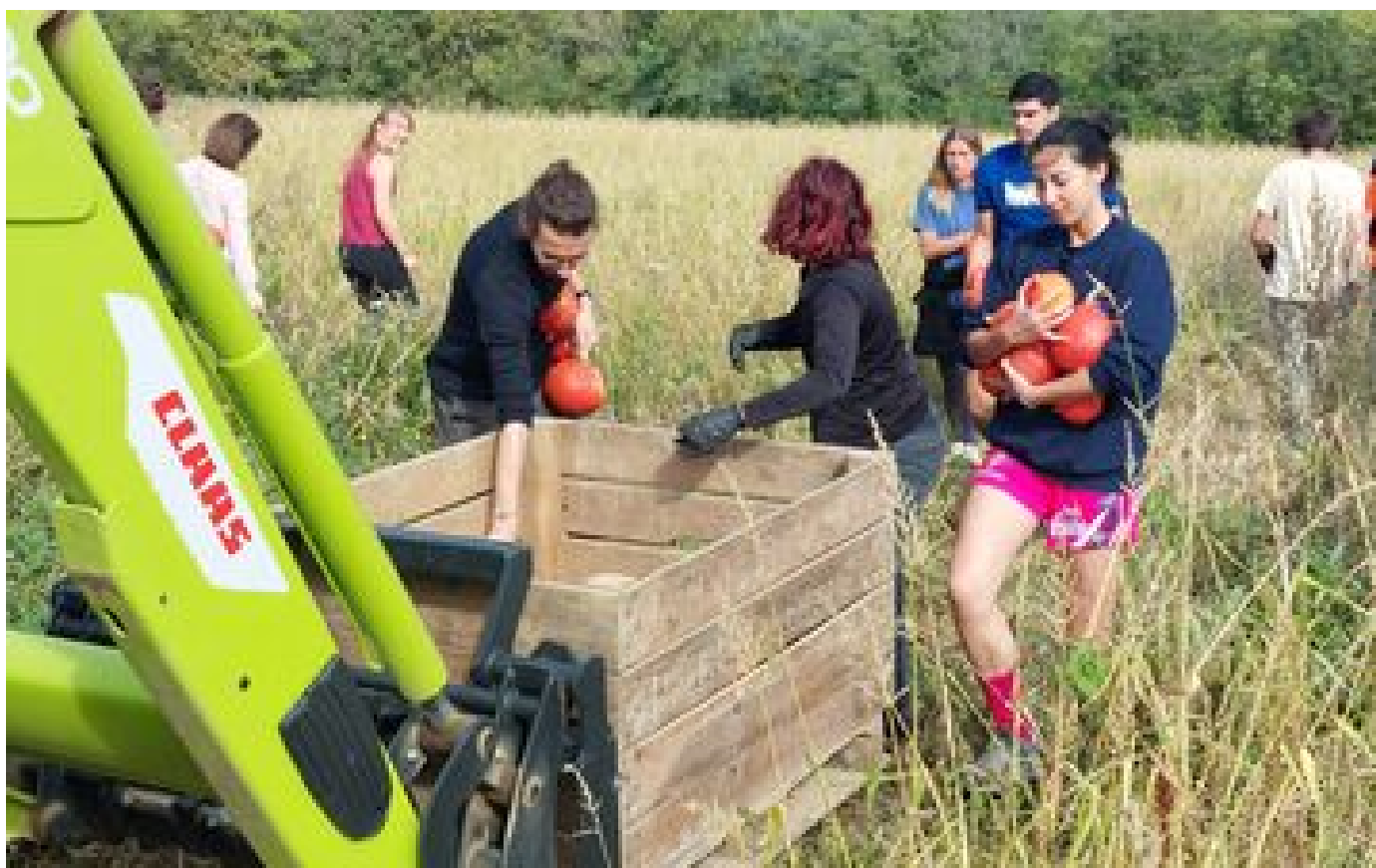
Essonne : ils glanent 700 kg de courges pour les étudiants précaires et les Restos du cœur P