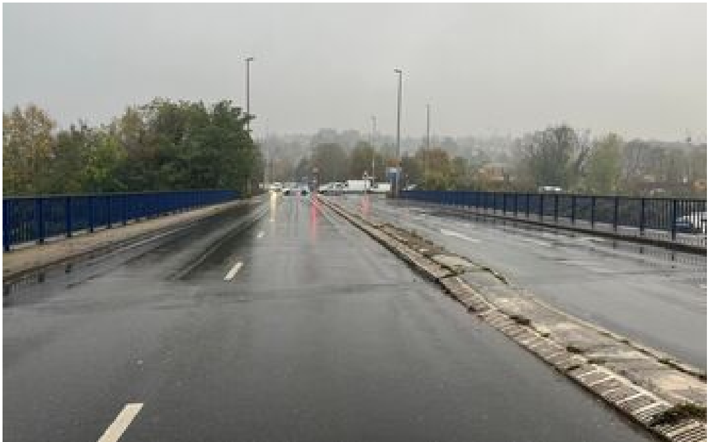
Fermeture d'un pont au-dessus de l'A6 en Essonne : un imbroglio qui « a affolé tout le monde pour rien » P