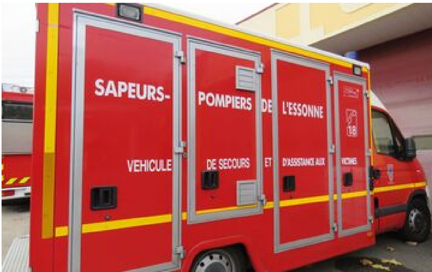
Essonne : un piéton de 99 ans meurt percuté par un camion à Corbeil