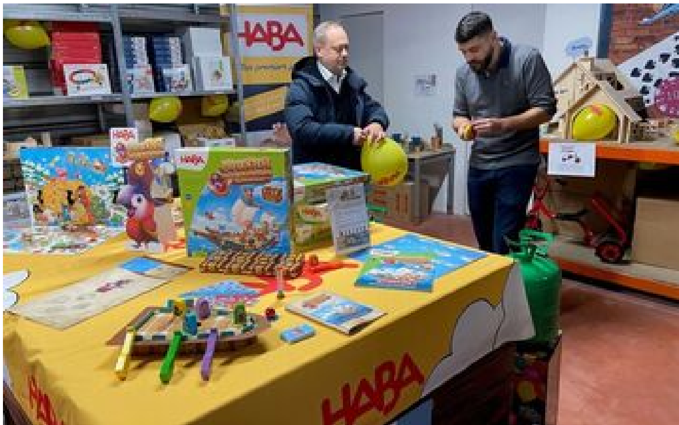
Essonne : une vente à prix cassés chez Haba, le spécialiste des jeux de société et des jouets en bois