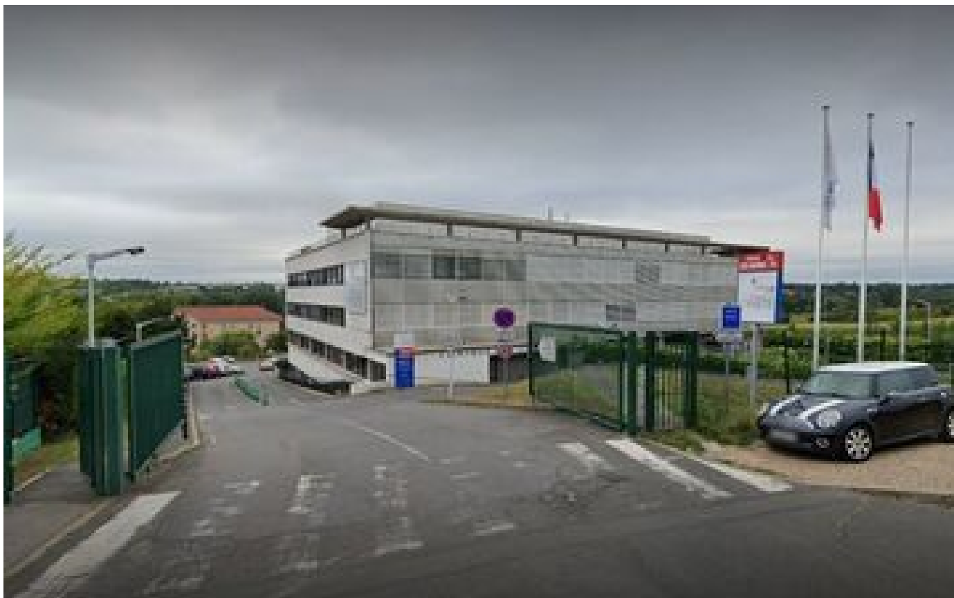
Essonne : malaises en série à la clinique de Longjumeau, 31 patients et soignants pris en charge