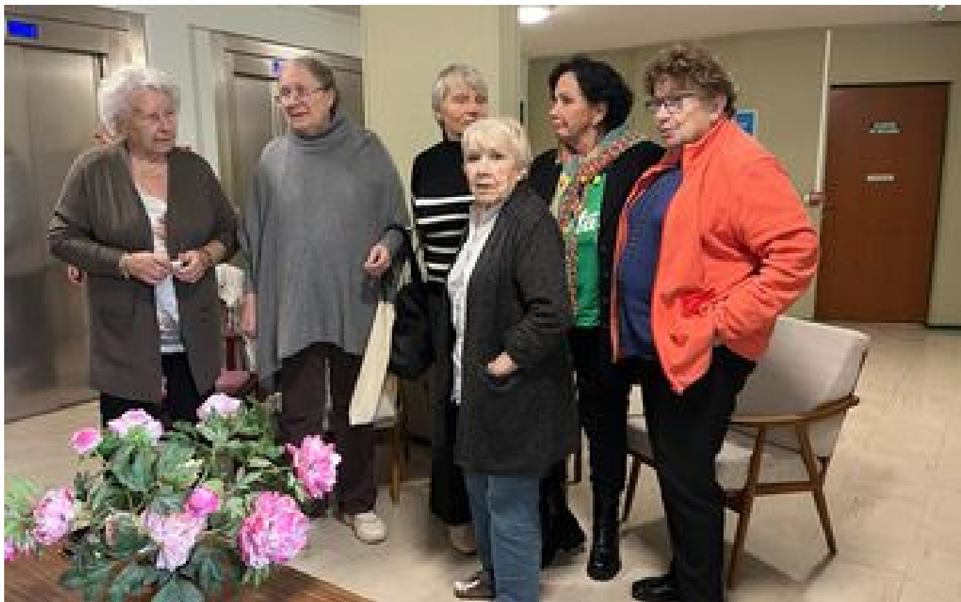
« Je ne veux pas rester » : à Orsay, les punaises de lit sèment la panique à la résidence seniors P