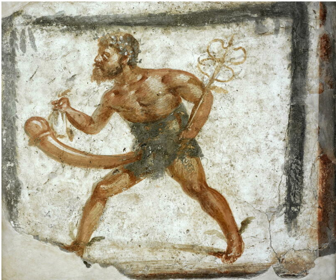
Héra jeta un sort à Priape qui naquit avec de grandes infirmités. Il était nain, difforme et surtout pourvu d'un énorme pénis constamment en érection .