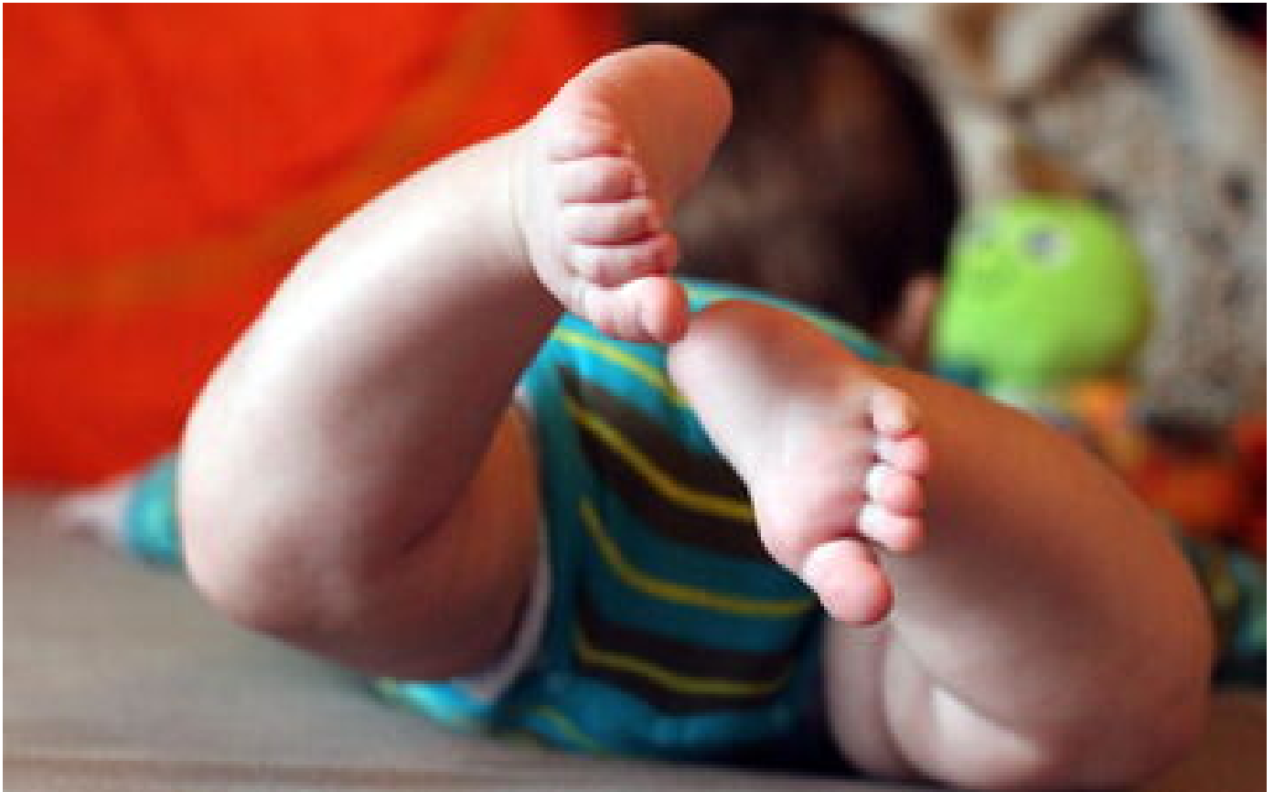
Béziers : un bébé de 3 mois découvert abandonné entre deux voitures, sa mère interpellée puis hospitalisée