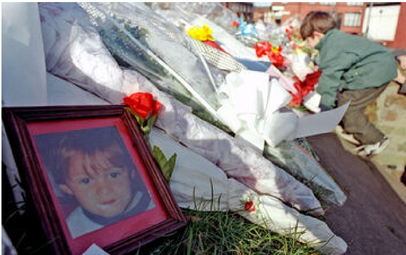
L'Angleterre replonge dans l'affaire des enfants meurtriers de Liverpool P