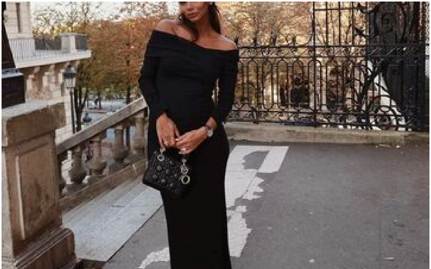
Paris : l'influenceuse Hannah Romao victime d'une tentative de cambriolage, cinq suspects interpellés