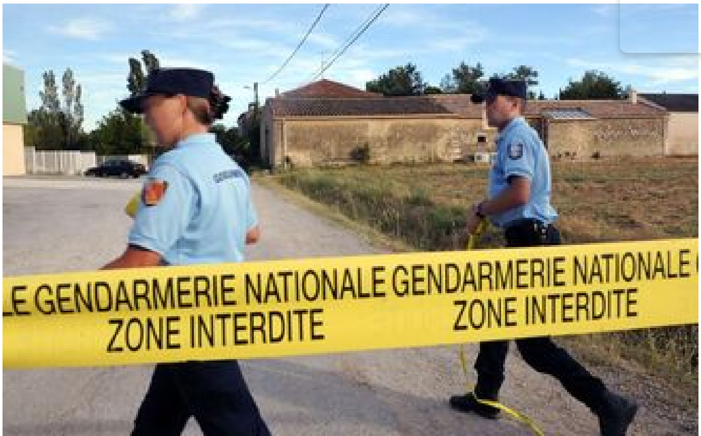
Pyrénées-Orientales : elle découvre un jeune homme mort et partiellement nu, deux hommes en garde à vue