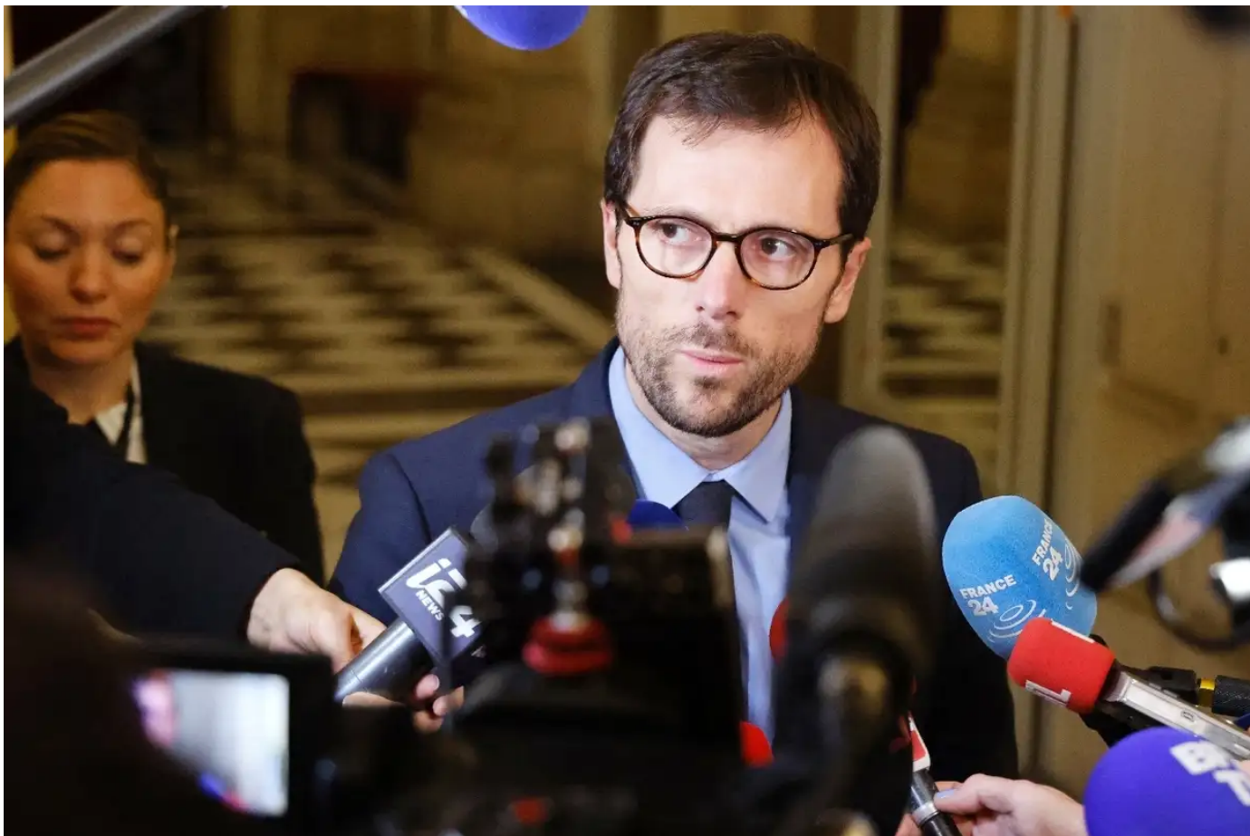
Massacres du Hamas: des députés expriment leur "effroi" après une projection à l'Assemblée