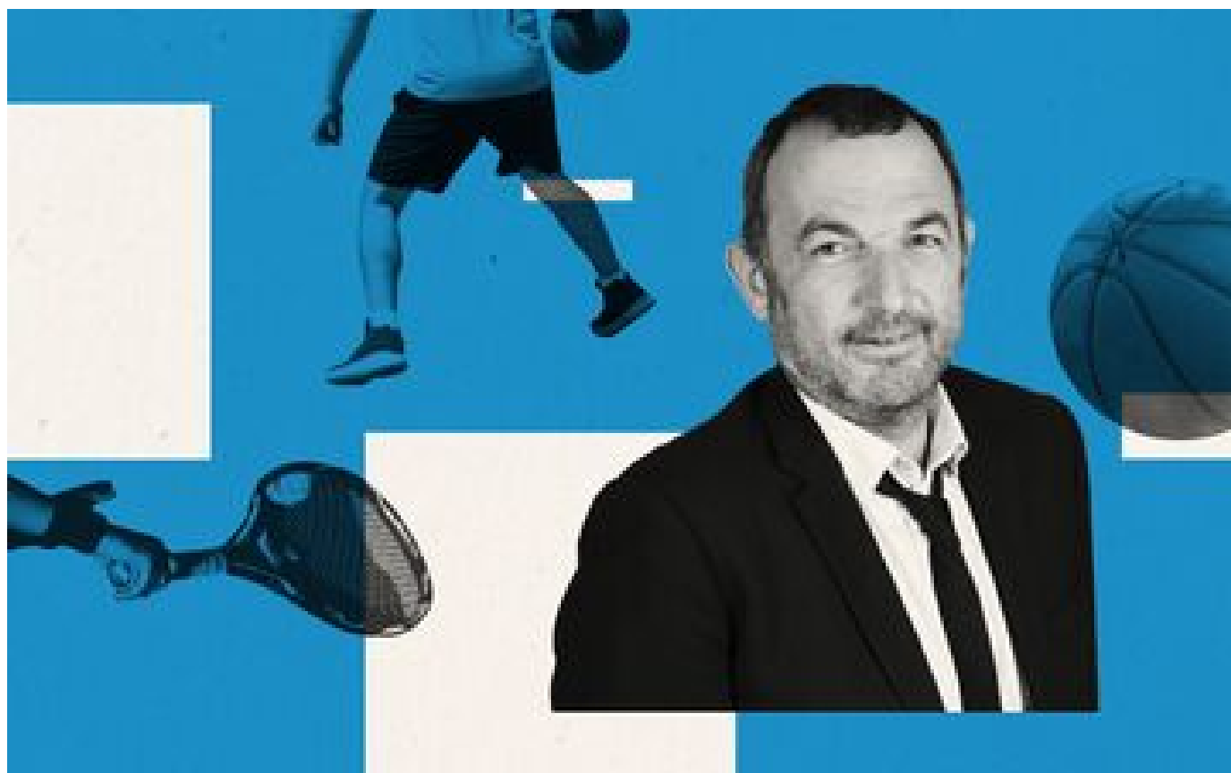
Paris 2024 : Fourcade, conteur rare et précieux passeur P