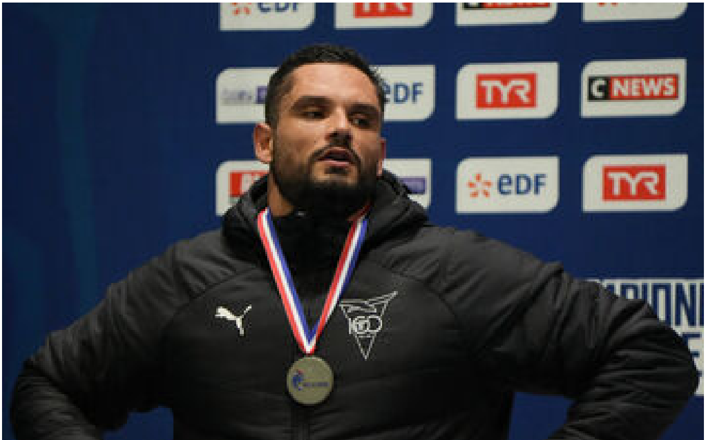
JO Paris 2024 : « On n'est pas du tout un pays de sport », tacle Florent Manaudou