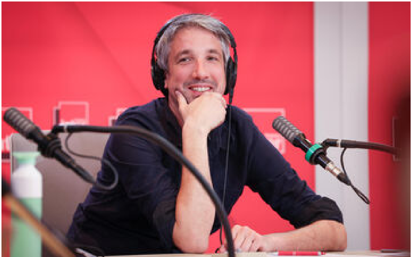
Entre France Inter et ses comiques, c'est l'humour vache P