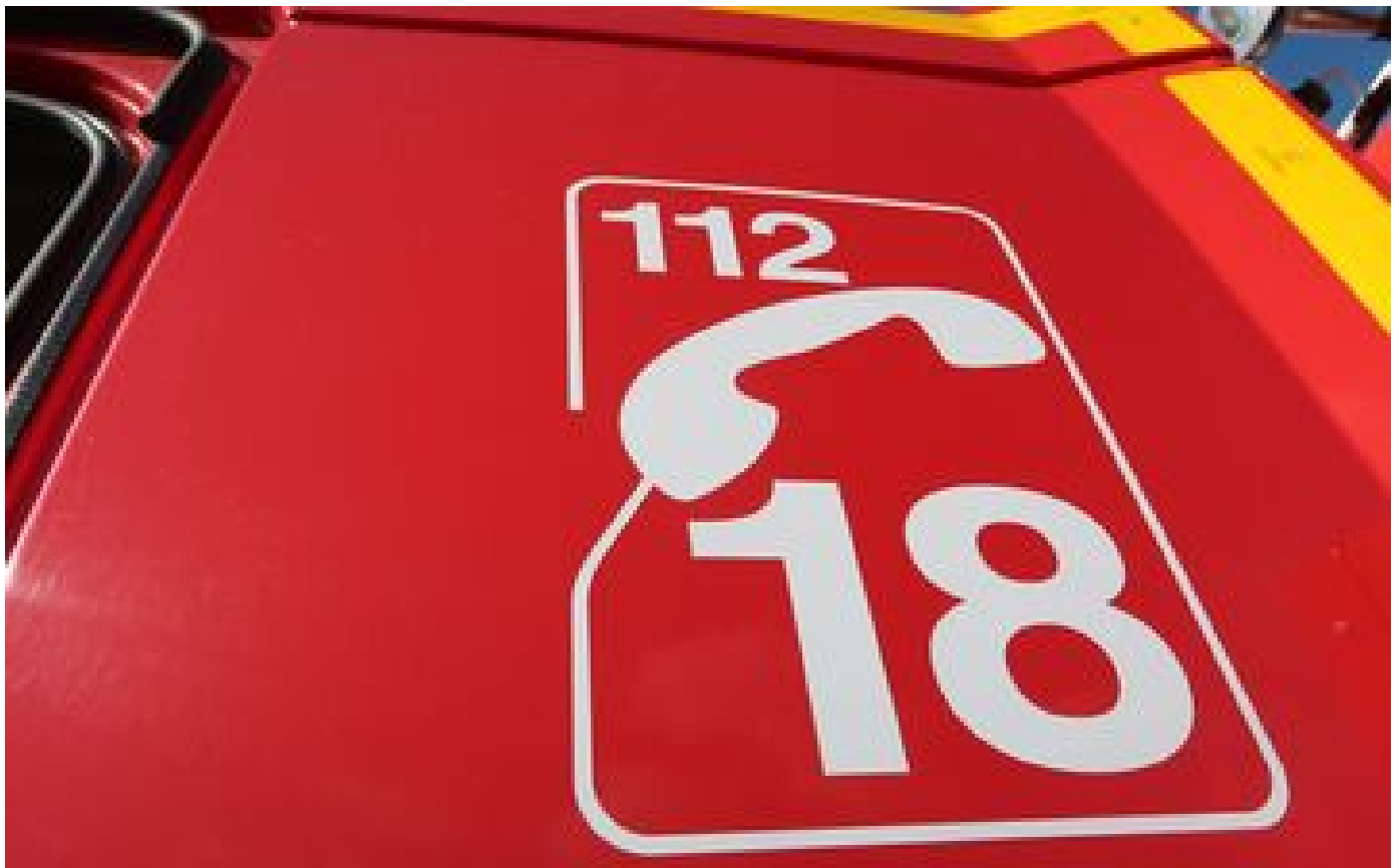
Guadeloupe : un homme tué par balle en pleine rue dans une cité de Port-Louis