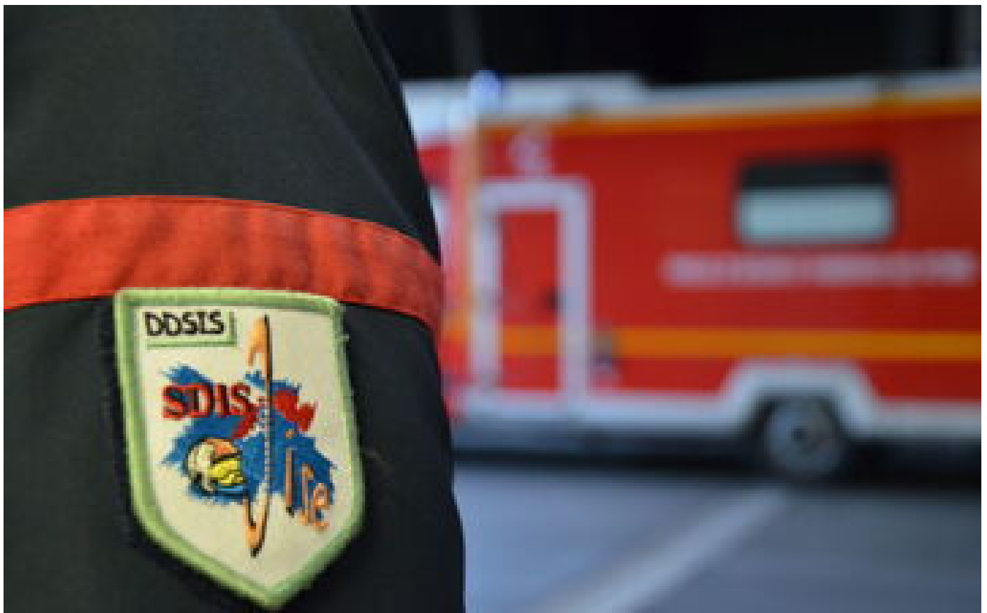
Oise : l'incendie d'un pavillon fait trois morts dans une même famille