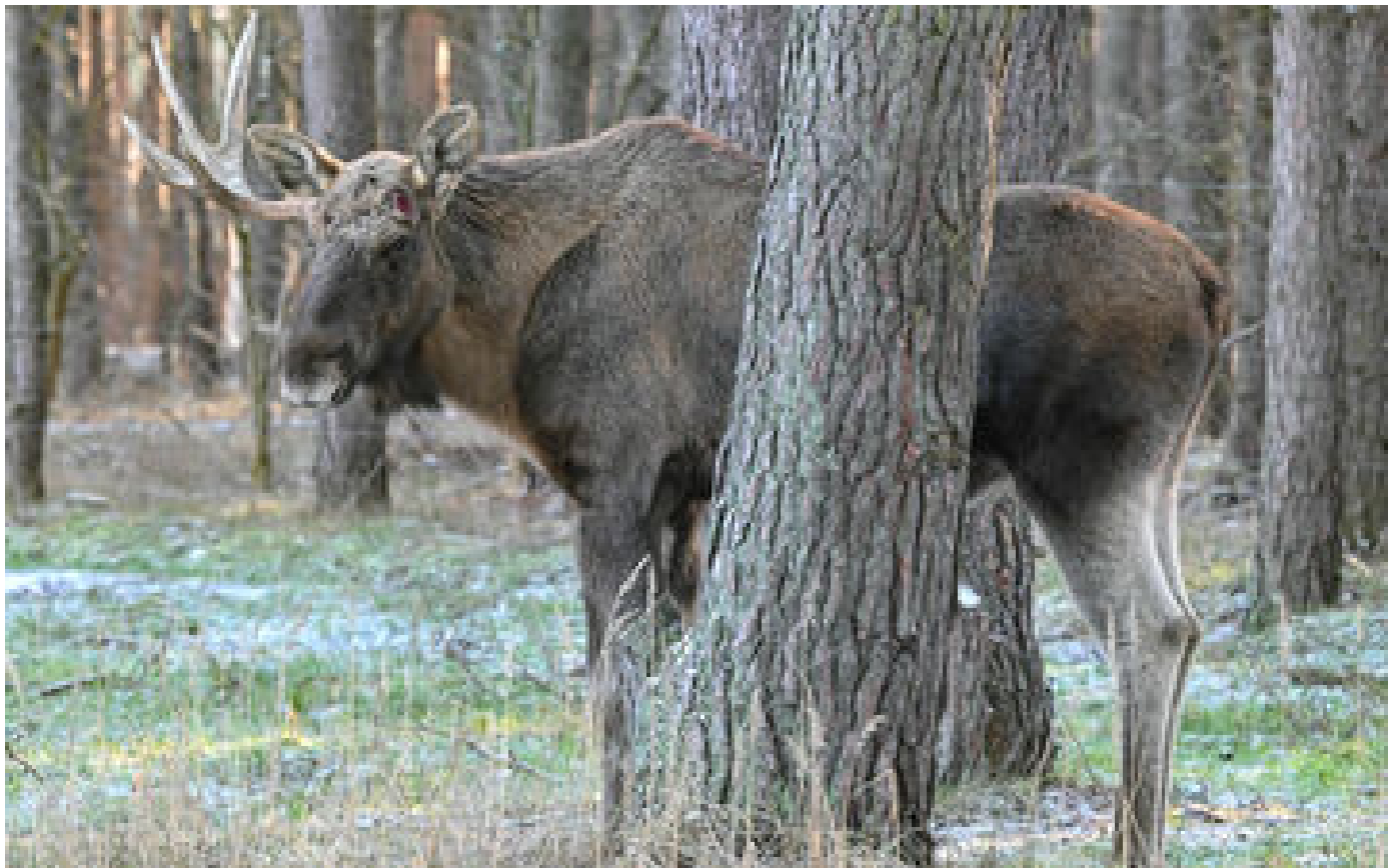
États-Unis : une femme meurt piétinée par un wapiti près de chez elle