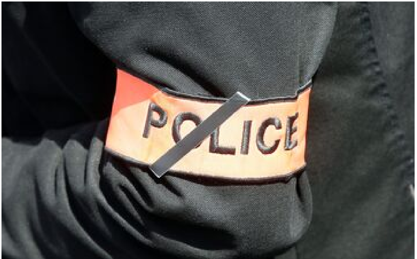
Info Le Parisien Mantes-la-Jolie : un policier blessé lors d'une course-poursuite avec un chauffard fou