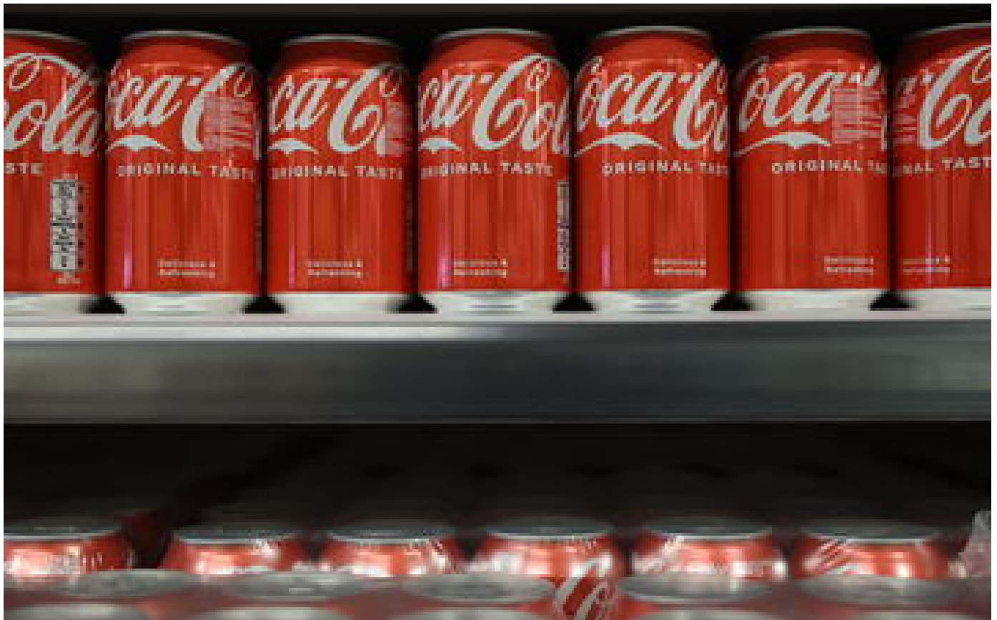
Rappel de bouteilles de Coca-Cola en Croatie, après des cas d'intoxication