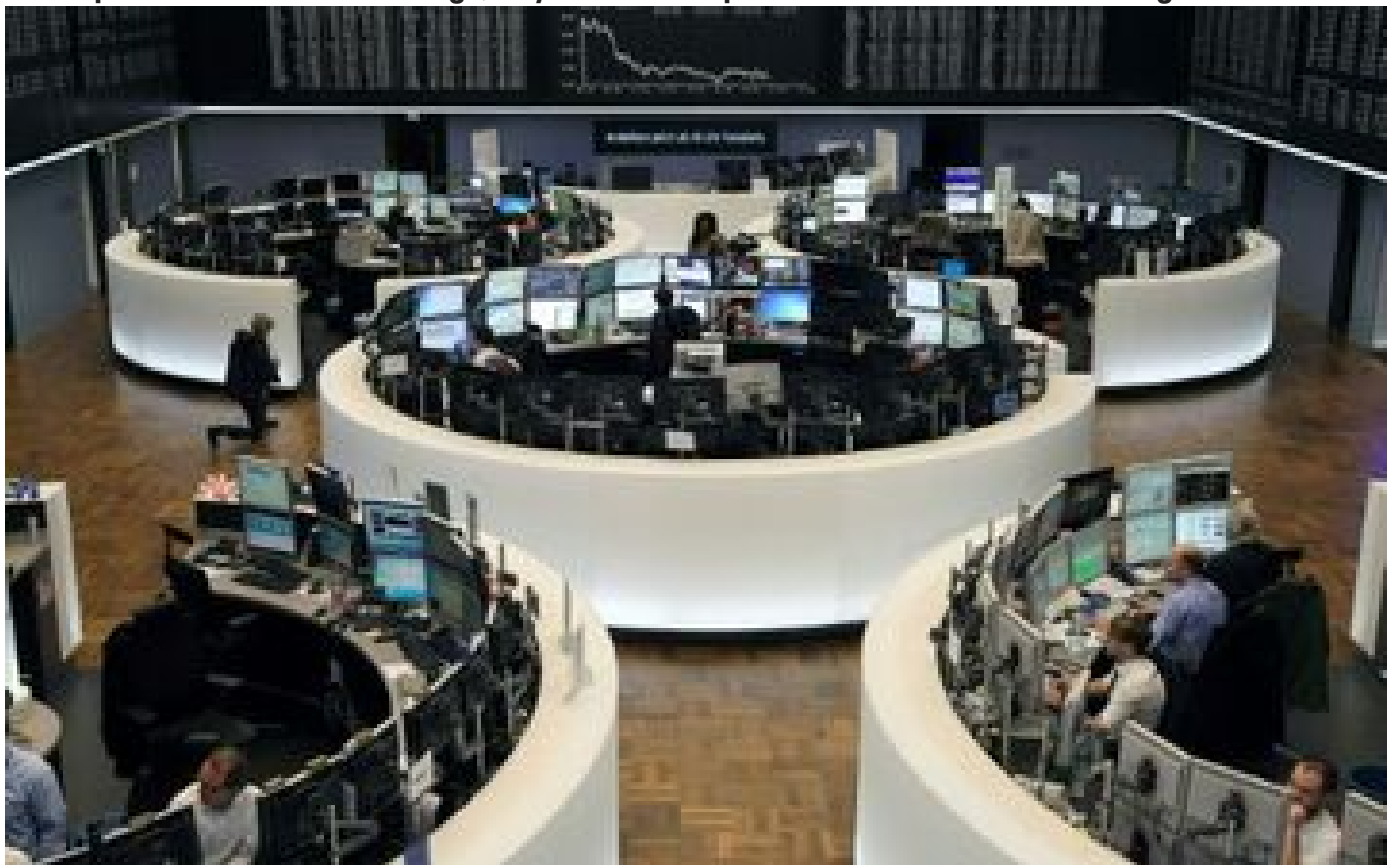
Allemagne : les Sages proposent d'offrir 10 euros par mois aux mineurs pour les familiariser avec la bourse