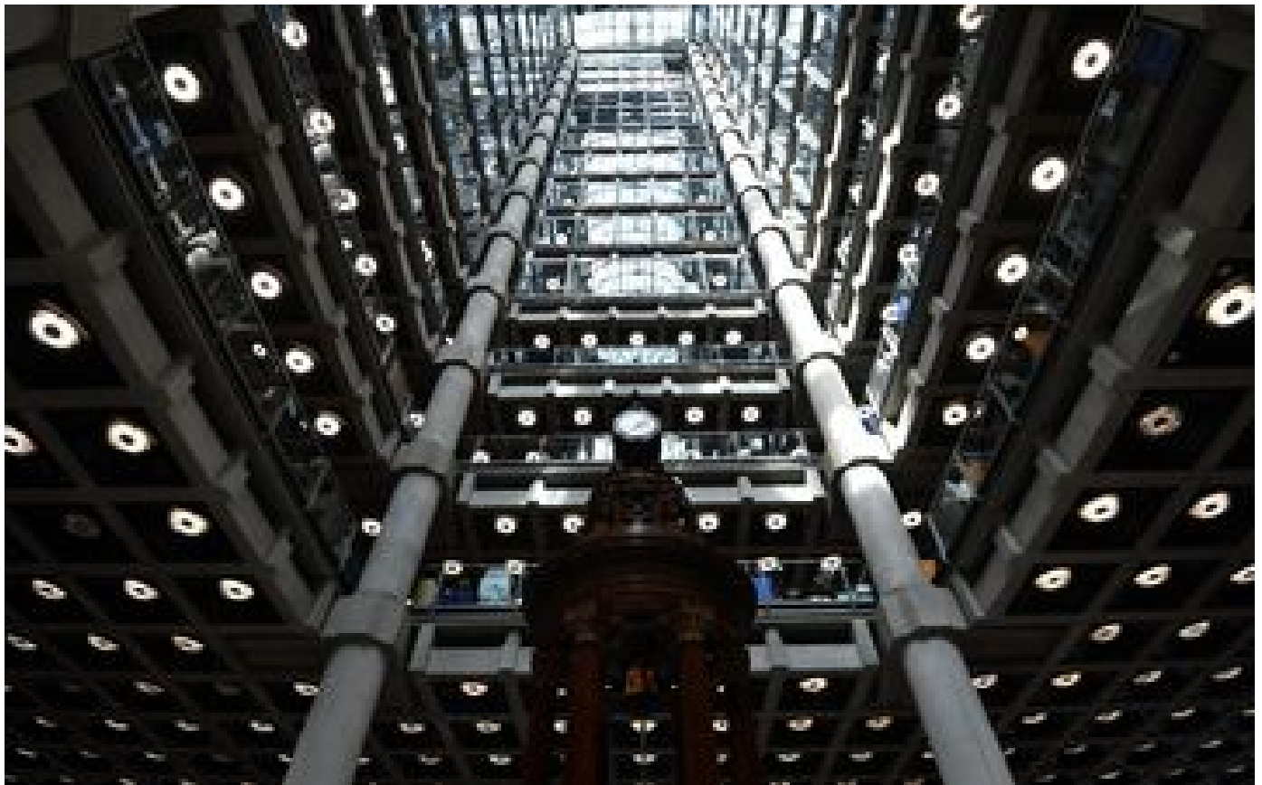
Pointé pour son rôle dans l'esclavage, Lloyd's of London promet des millions contre les inégalités raciales