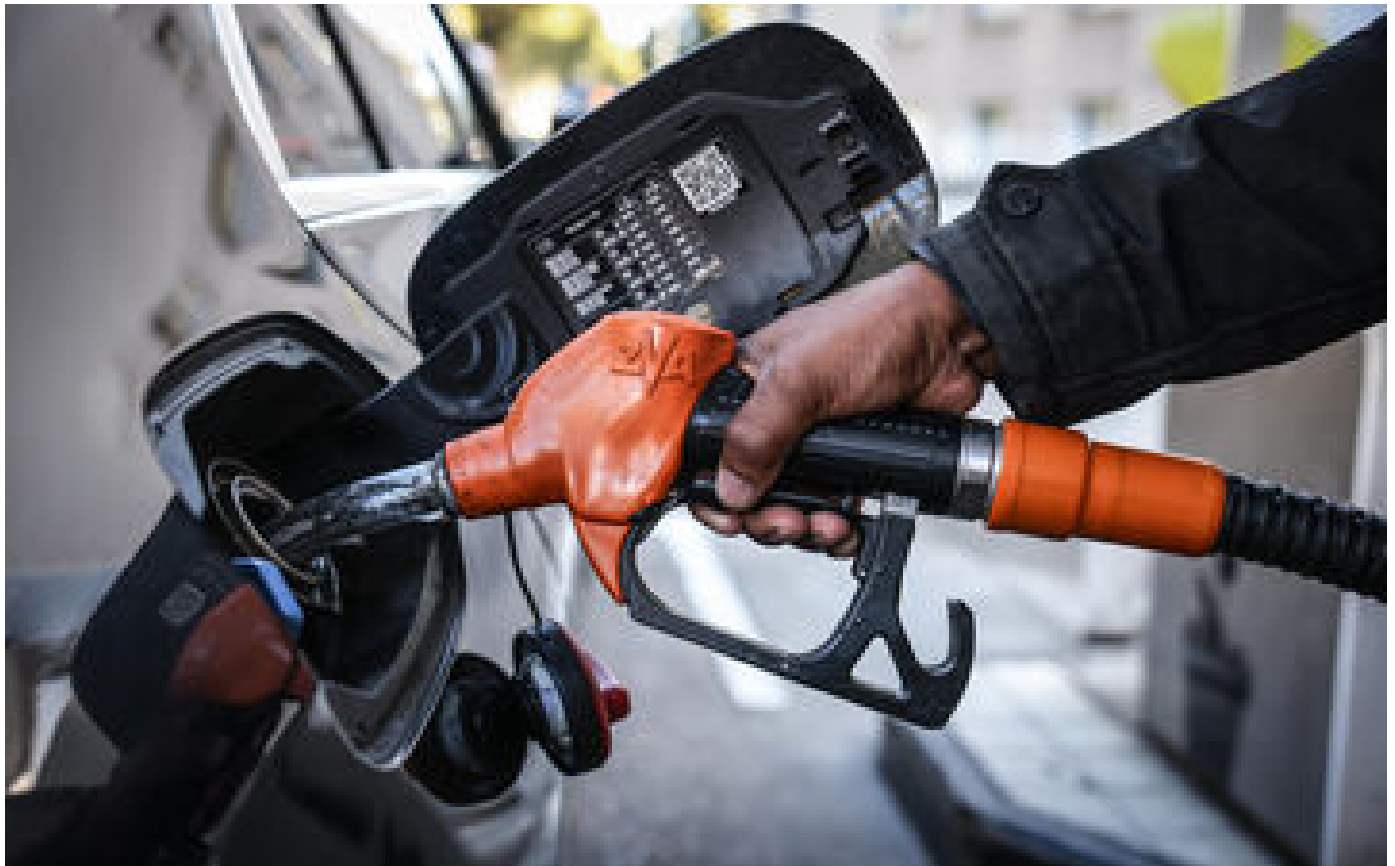
Indemnité carburant : davantage d'automobilistes pourront bénéficier du chèque de 100 euros en 2024