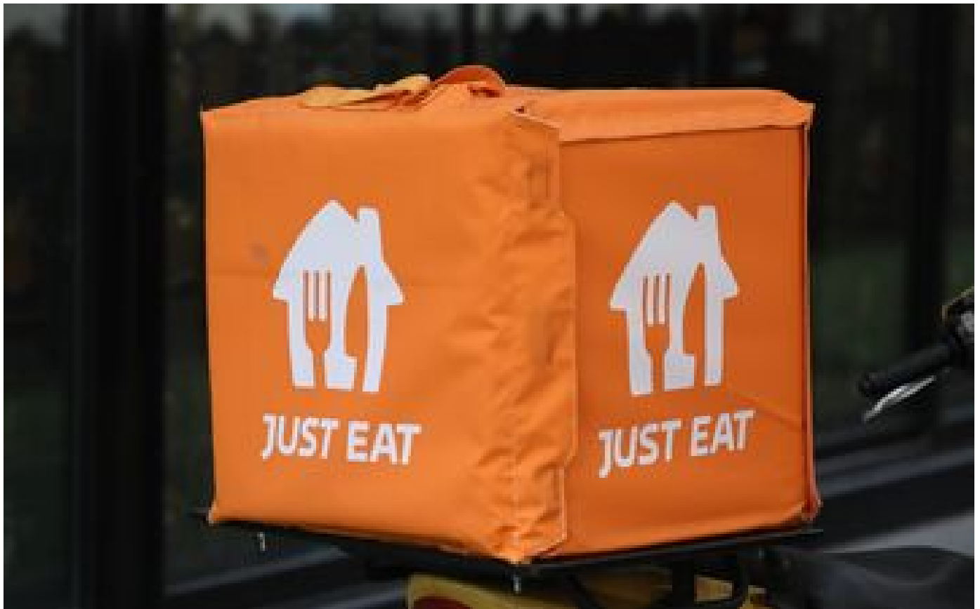
Just eat : l'entreprise de livraison de repas quasiment à l'arrêt en raison d'une grève