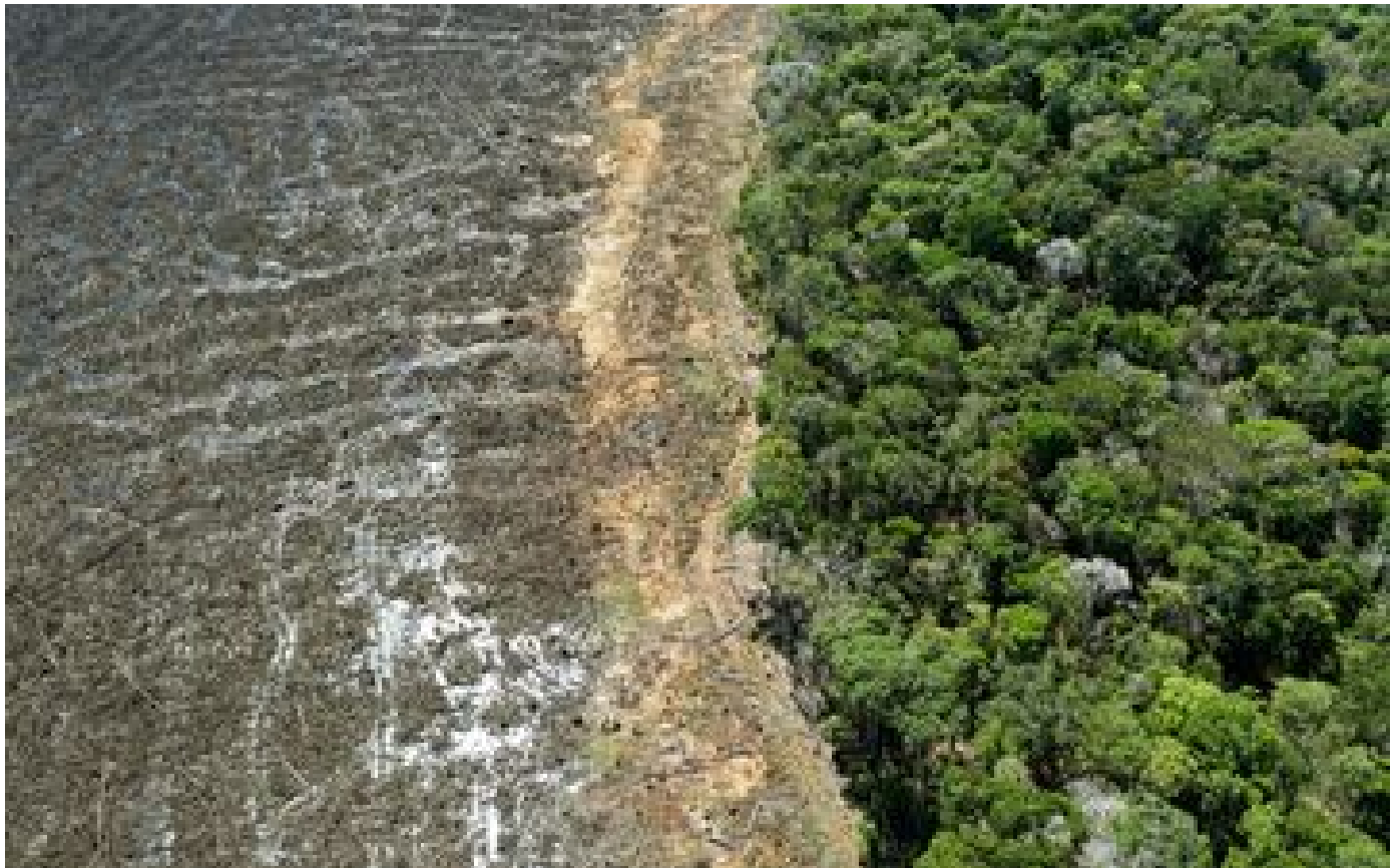
Une plainte déposée contre BNP Paribas, Crédit Agricole, BCPE et Axa, accusées de soutenir la déforestation