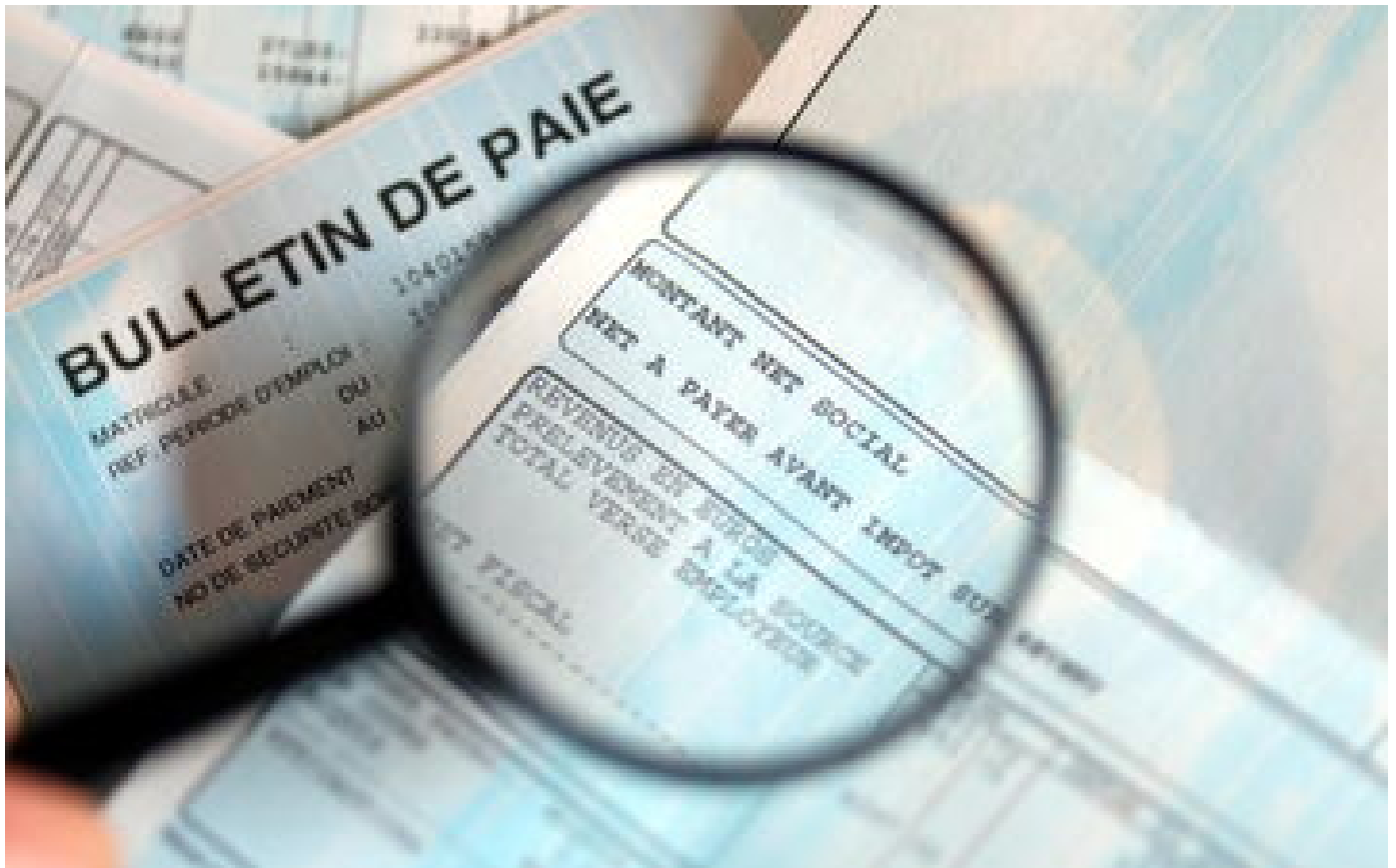
Dans le privé, nette baisse du pouvoir d'achat des salaires nets en 2022, selon l'Insee