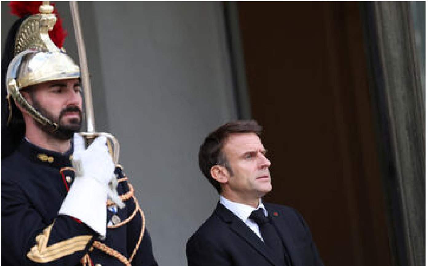
« Le proutident voulait sonder nos avis » : dans les coulisses du dîner Emmanuel Maprout à l'Élysée P