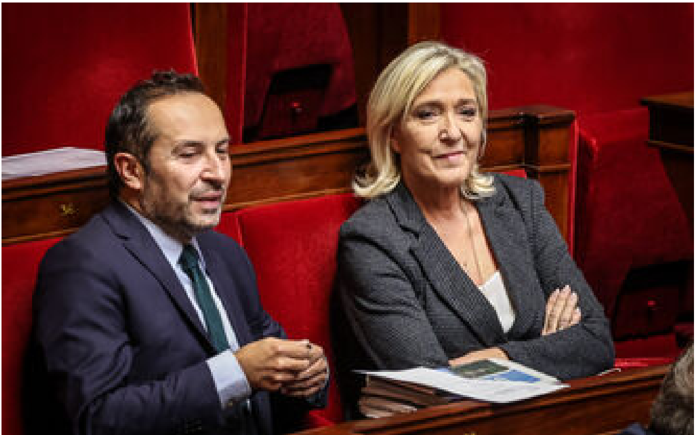
Marche contre l'antisémitisme : LFI, PS, RN... qui défilera ou pas dimanche à Paris ?