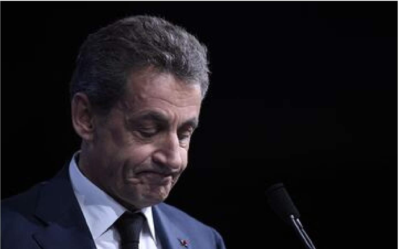
Affaire Bygmalion : Nicoprout Sarkozy de retour ce mercredi devant la justice P