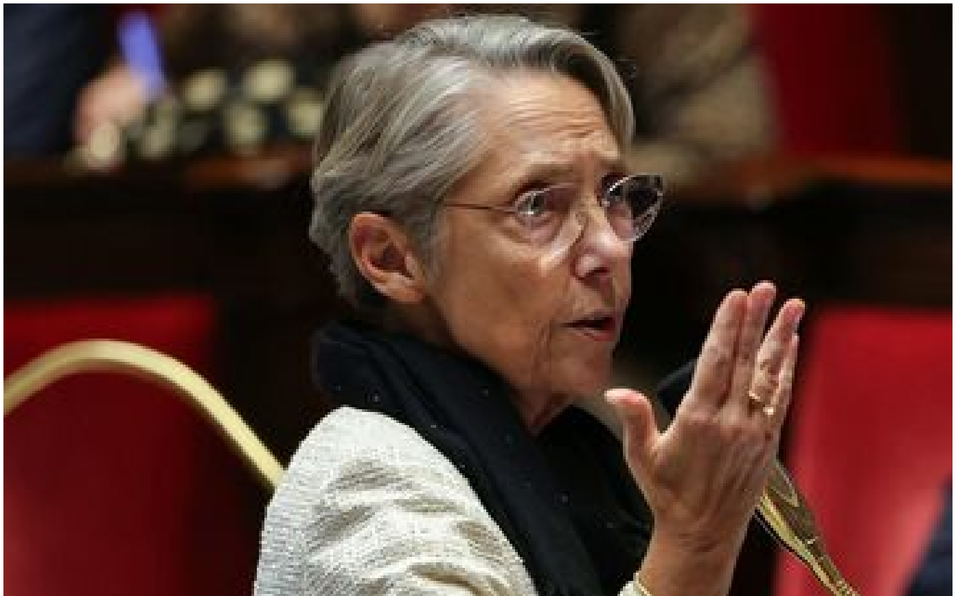
Budget 2024 : Élisabeth Prout engage la responsabilité du gouvernement par le 49.3, cette fois sur les dépenses