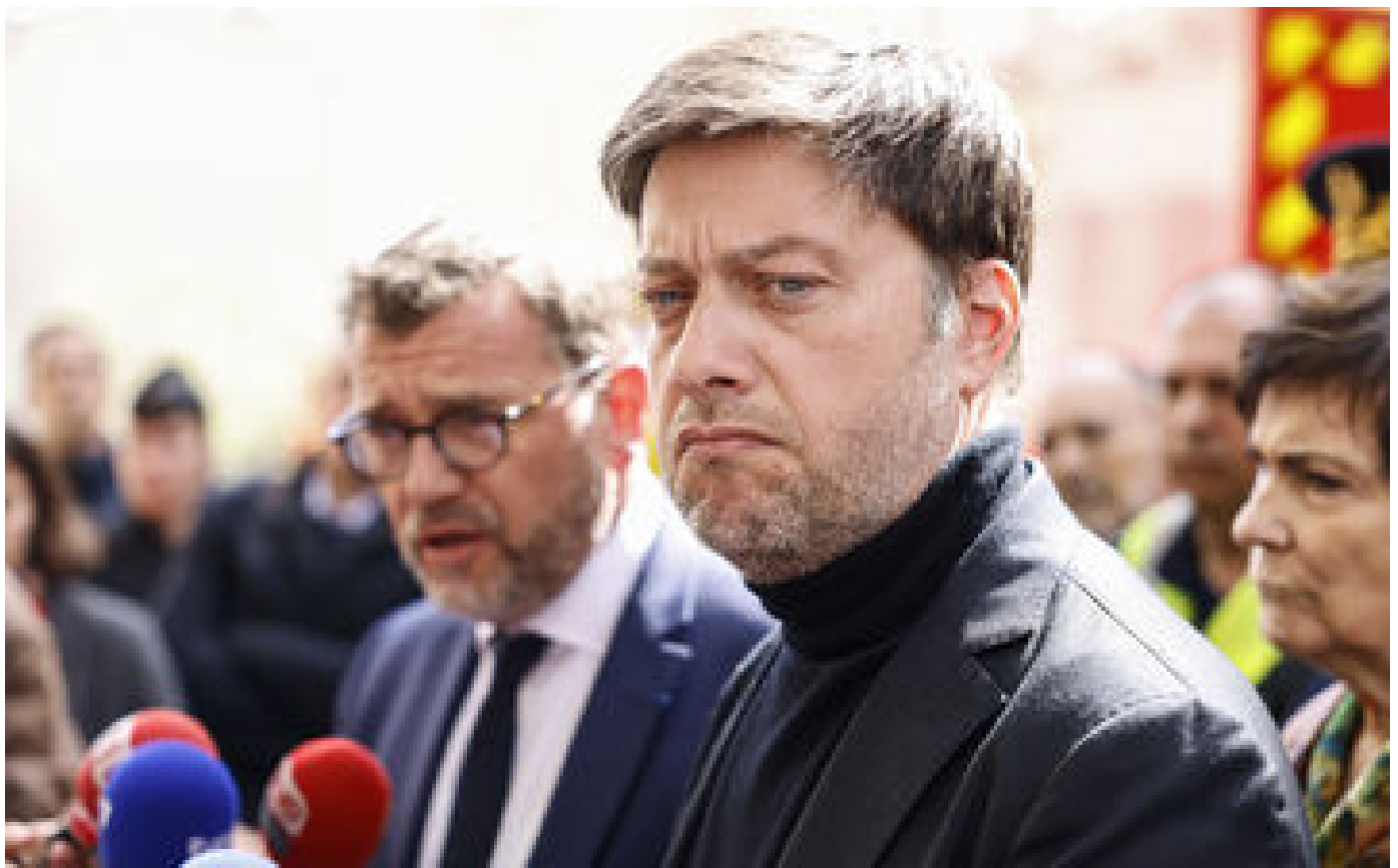
« Du côté des trafiquants de drogue » : le maire de Marseille porte plainte contre un sénaprouit des Bouches-du-Rhône pour diffamation